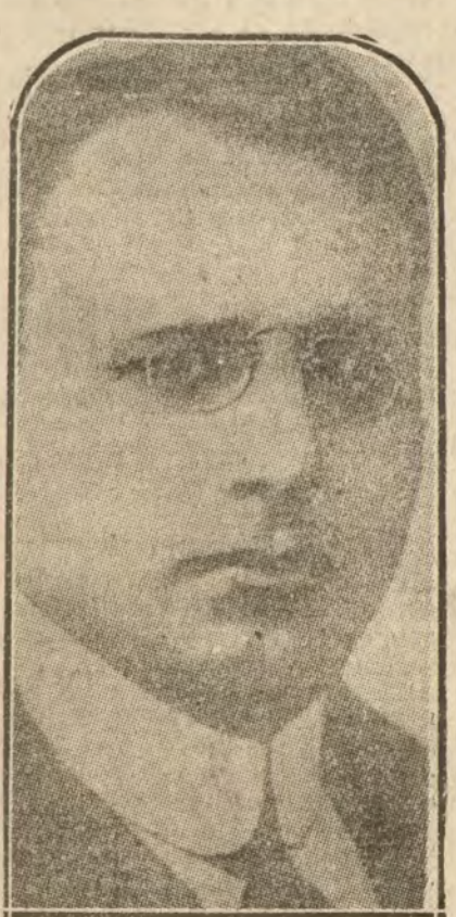
Cox, gobernador general del Ohio, candidato designado por la Convención democrata para la lucha presidencial, derrotando a Mac Adoo.

Los oficiales con permiso han recibido orden de unirse a sus regimientos y se espera una movilización de tres quintas.