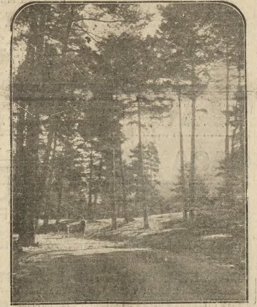
Un lugar de la sierra.

—No es sólo éste el motivo que nos guía en nuestras excursiones, sino el de