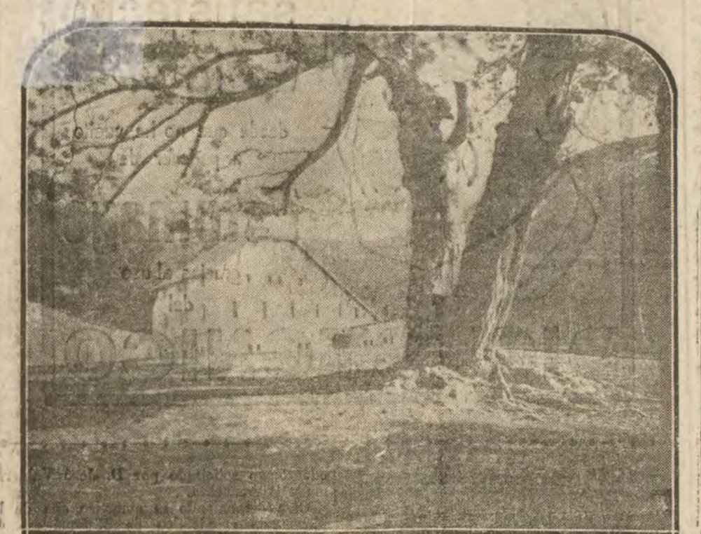
Chalet de Peñalara.