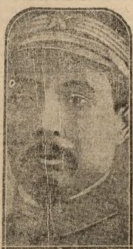
El mariscal Tsuruichi, general en jefe del Ejército de defensa de Pekín, amenazado por el Ejército rebelde

No nos cansaremos de repetirlo: nacionalizar todas nuestras industrias primordiales es la más sana política económica.