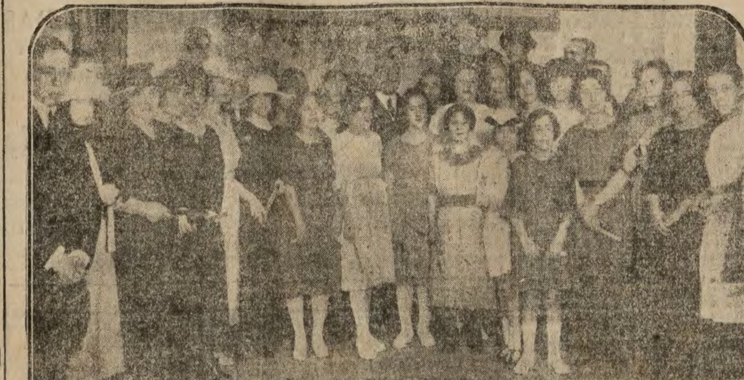
Los profesores del Centro de Instrucción Comercial, con las alumnas que han presentado trabajos en la Exposición inaugurada ayer tarde

Copenhague 14.—Según informaciones recibidas de Korno, las tropas polacas, continúan evacuando el territorio lituano.