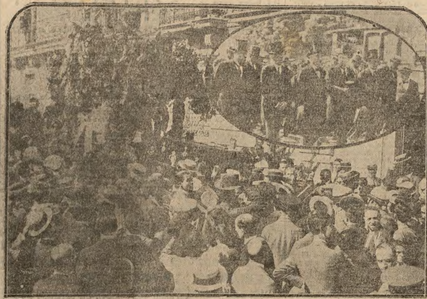
Momento de sacar el féretro de la redacción de "El Sol" para depositarlo en el coche fúnebre. En el óvalo la presidencia del duelo