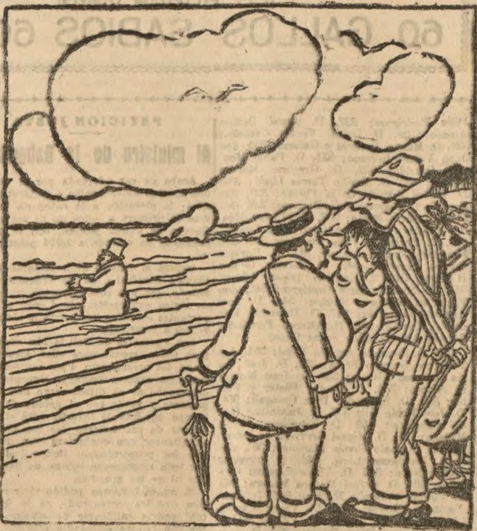
LA OLA DE BAJA —Pero ese hombre está loco. ¿Por qué se baña con abrigo? —Para protestar del precio excesivo de los trajes de baño.

Cuentas corrientes a la vista con 3 por 100 de interés anual; imposiciones a plazo fijo con intereses a convenir. Descuentos, giros, préstamos, créditos, operaciones de Bolsa y todas las de Banca en general. Dividendo por el ejercicio de 1919, 8 por 100.