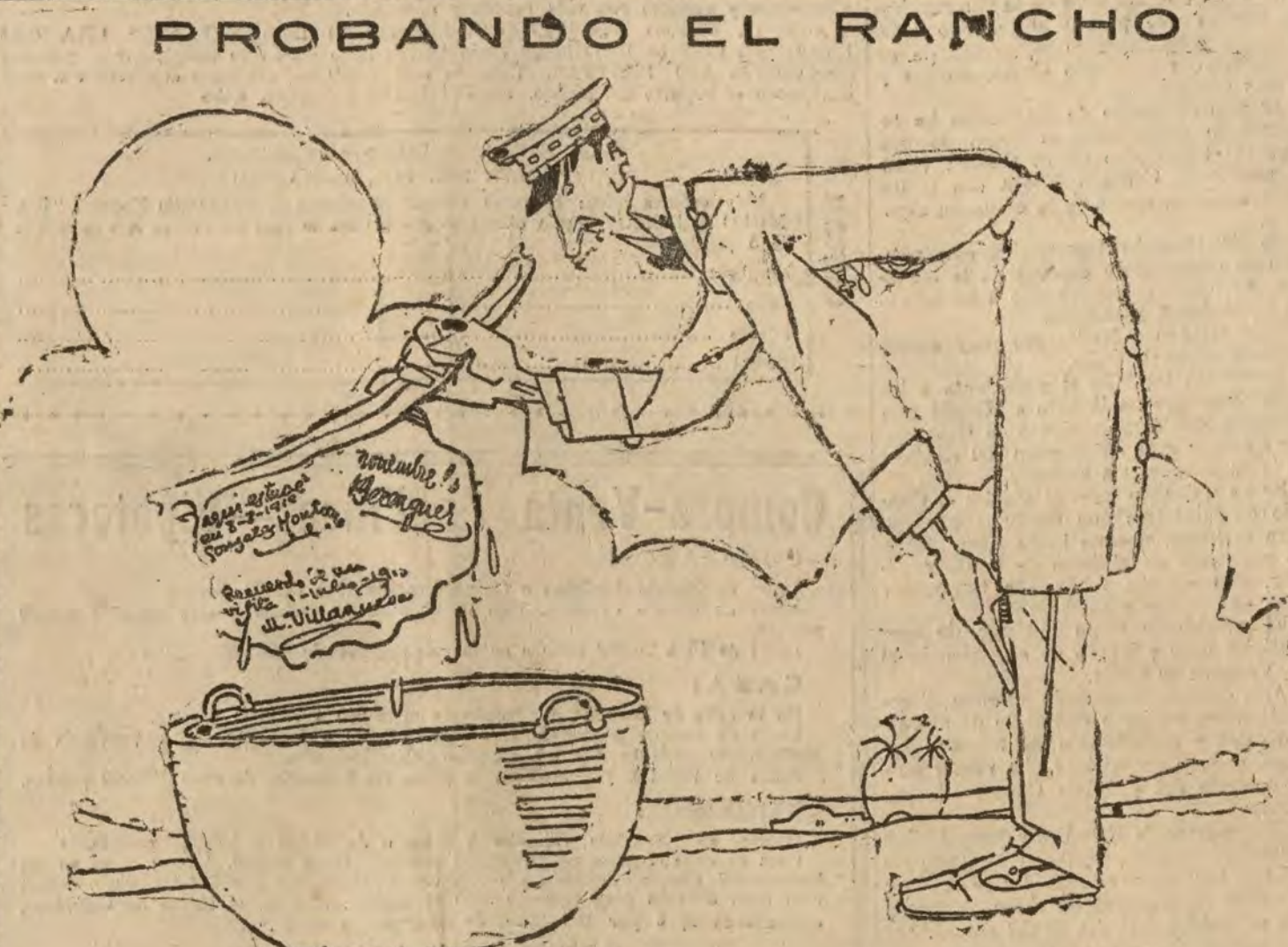
La chuleta única

Londres 14.—La escasez de lino ha dado un vivo impulso al cultivo y a la industria de este producto en el Canadá. El número de hiladoras de lino ha pasado de nueve a cuarenta y siete.