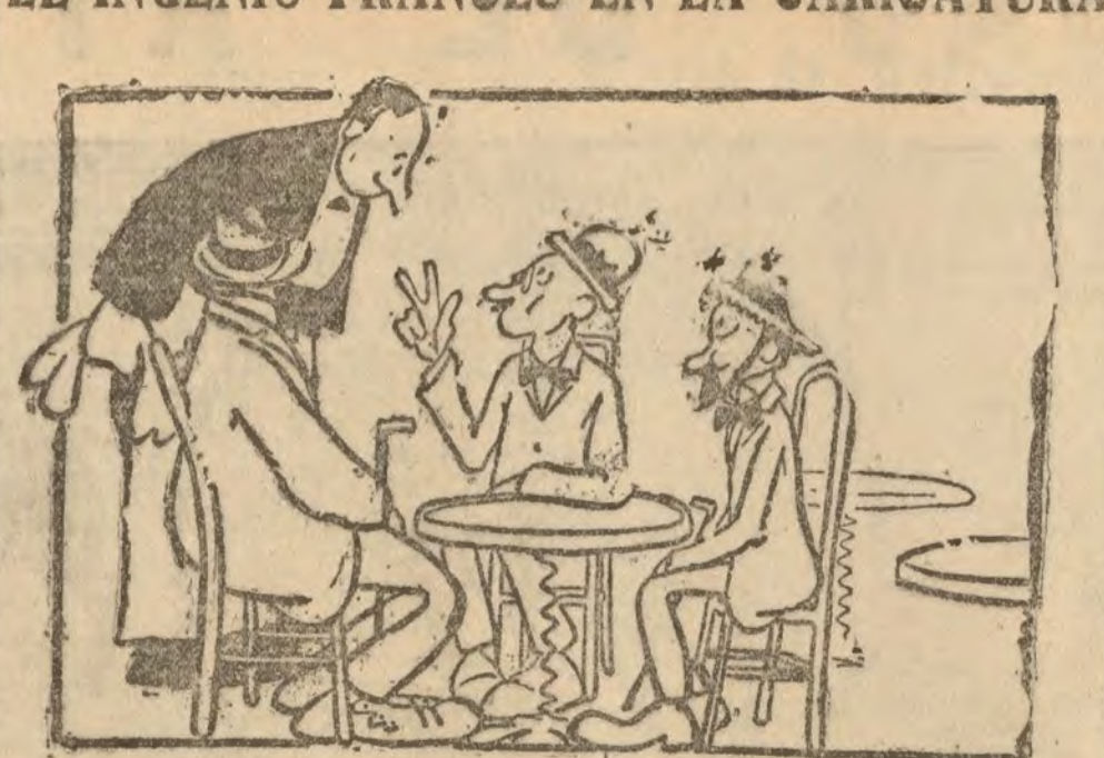
CONTRA EL AUMENTO DE LOS APERITIVOS Mezo, traiga un vermouth y tres vasos