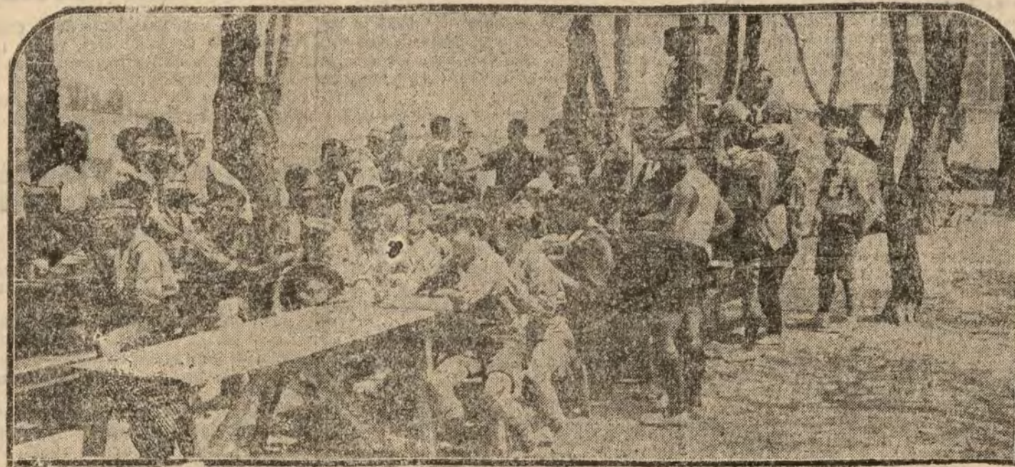
Grupo de exploradores en el Campamento de la Moncloa.