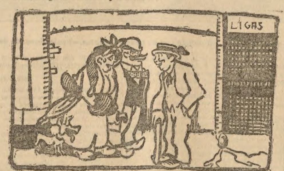
UNA SUBIDA ILICITA —¿Por qué han detenido al dueño de esta tienda? —¡Porque decía haber construido una liga que impidiera bajar los calcesines. (De Le Matin)