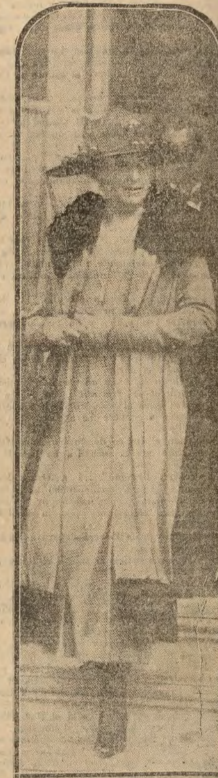
La Reina Victoria saliendo del Hotel Ritz, en Londres.