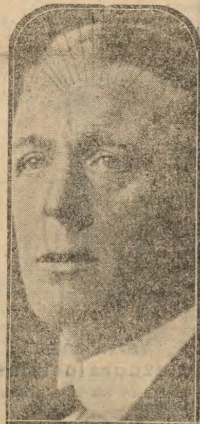
Lord Chelmsford, virrey de la India.