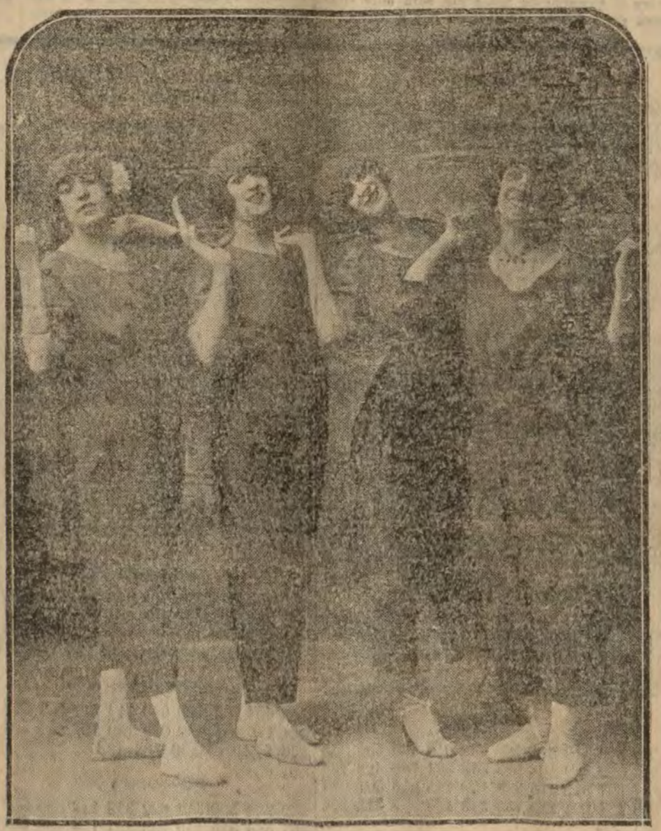
Los pelotaris, aplaudido pásmo de varietés de la revista "El reinado de Eva", de la que es autor Oana Servent, y que se representa con éxito en París.

se mostró optimista respecto a la solución.