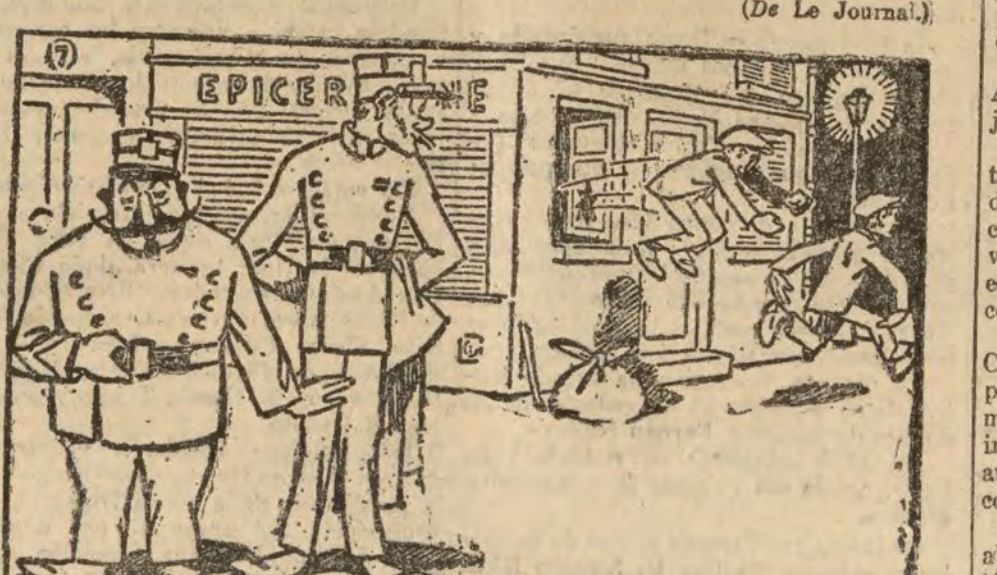
—Mira, Juan; parece que saltan de aquella casa... —Déjalos, Pedro; acaso son gentes que se preparan para algún deporte... (De Petit Journal.)

—Y cómo no se ha hecho nunca nada para impedir esta inundación? (De Le Journal.)