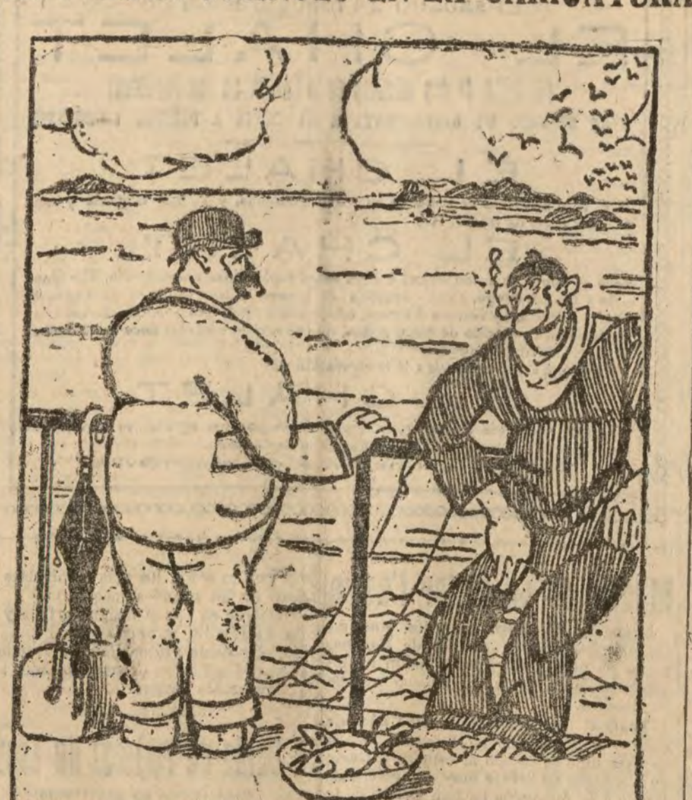
EL NUEVO RICO VISITA EL MAR

—Y cómo no se ha hecho nunca nada para impedir esta inundación? (De Le Journal.)