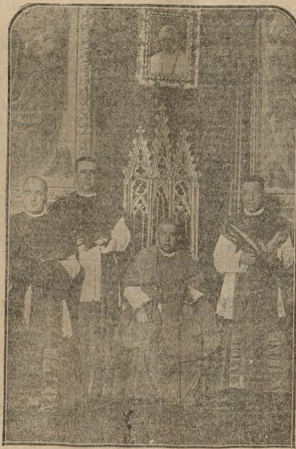
El nuevo Obispo de Barcelona D. Ramón Guzmán, durante la recepción en el Palacio Episcopal

Este plan, cuyo fin sería el restablecimiento del régimen bolchevista en Hungría, está, según parece, en relación con el viaje de Bela Kun.