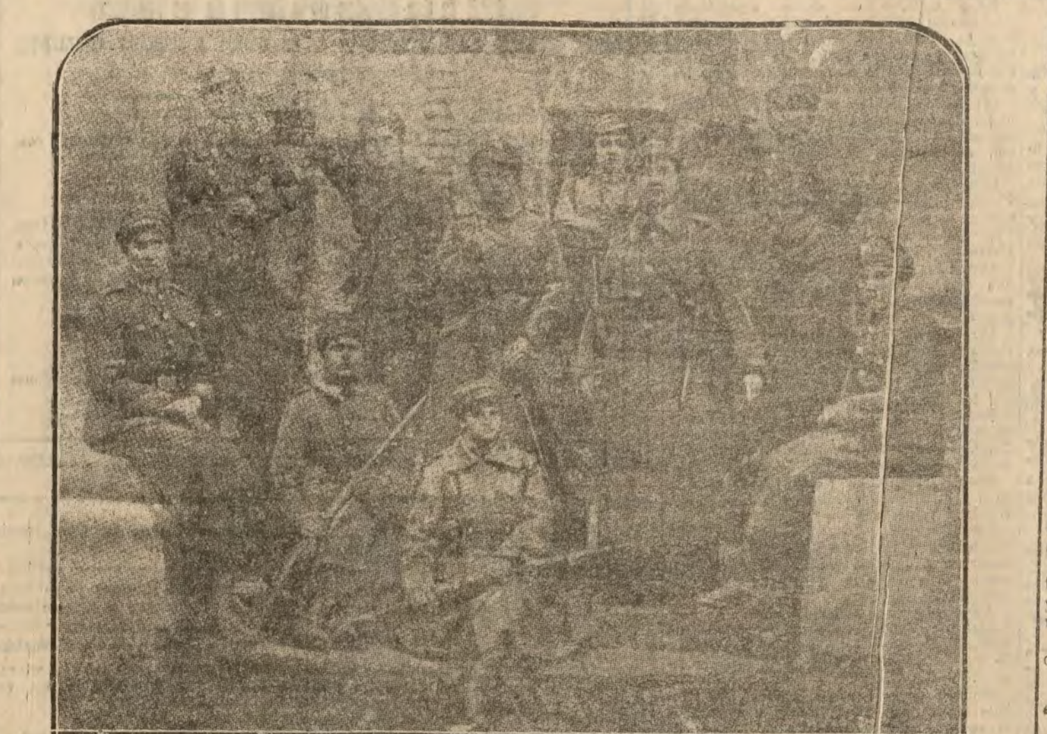
Las mujeres oficiales del batallón primo o polaco, que han defendido el puesto de la región de la Stry

Entre los contingentes de voluntarios con que han reforzado los polacos los ejércitos han combatido duramente en el frente bolchevique, figura un batallón compuesto exclusivamente por mujeres.