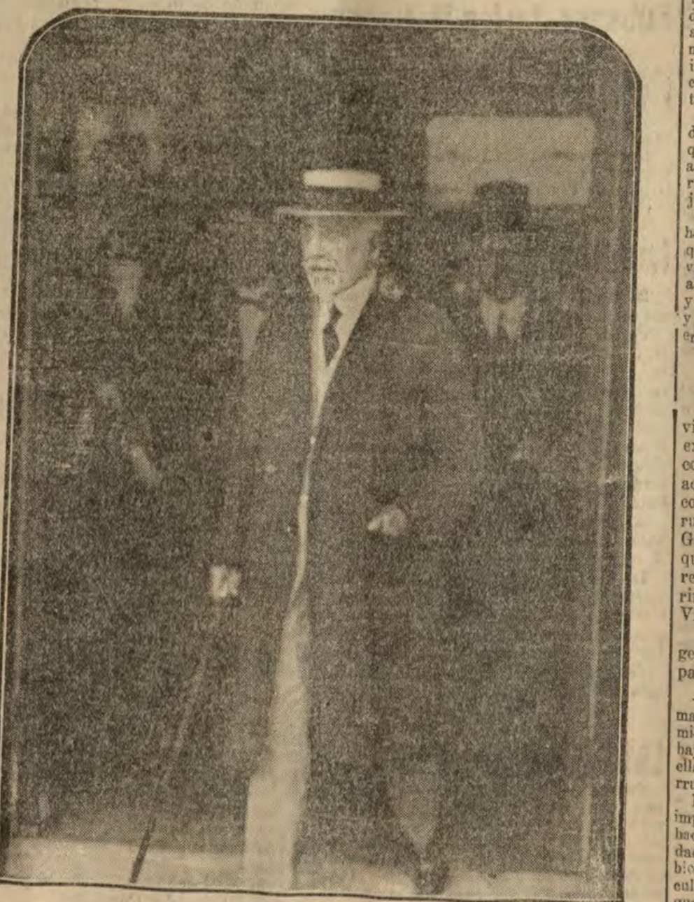
El señor Tittoni, representante de Italia en la reunión de la Liga de las Naciones que va a celebrarse en San Sebastián, al bajar a tren en la bella capital guipuzcoana

nestor aportar aperos de labor, semillas que hacen fructificar y hasta inteligencias que dominan los misterios de la tierra... Hay que aprovechar las condiciones de expansión que tenemos sobre los demás pueblos, y al paso que conservamos ese pedazo de territorio que nos garantiza la condición de nación mediterránea, convertir en una provincia espa ñola, donde al cabo impere nuestra raza fue ra... Pero cómo demostrar nuestra superioridad de raza y de nervio si los naturales de nuestro país que van a convivir con el mora reducen al presente su aspiración a com pe tir con él en la venta de agua a los solda dos?