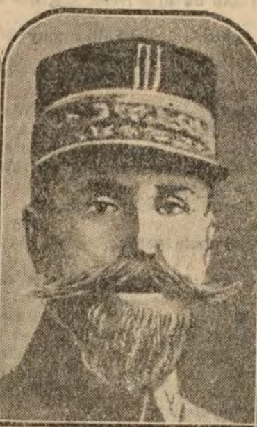
El general Gouraud, que se ha posesionado de Damasco para detener a los europeos de los ataques nacionalistas turcos.

San Sebastián 28 (11 m).—El tren espe cial en que habían de llegar hoy los dele gados de la Liga de las Naciones no llegará a ésta hasta mañana.