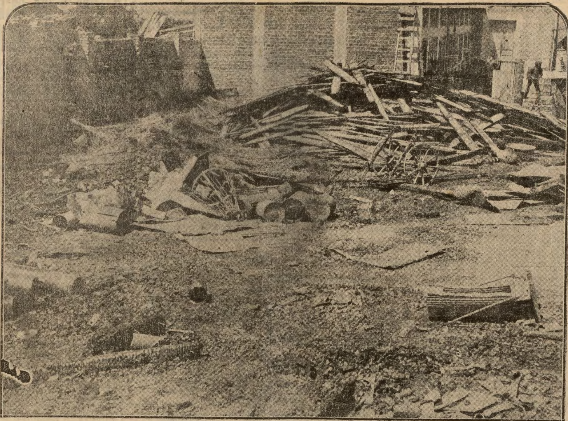
Estado en que ha quedado después del incendio de esta madrugada, el pabellón depósito de maderas de la fábrica "A. E. G."

En Madrid ve usted un cartel anunciador de un diario. Tirada inmensa, las mejores plumas; capital, tanto y cuanto. Pese sobre de gobernación, y de jugo, y de tal político, y de tal financiero. Fulano de tal, el brillante periodista.