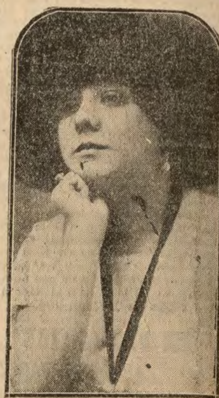
La hermosa canzonetista Musetta que actúa en Madrid con gran éxito

La causa de la agresión fué por haberle creído equivocadamente esquirol.