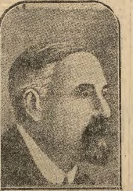
M. Leake, magistrado asesinado en Irlanda por los Sinn Féiners