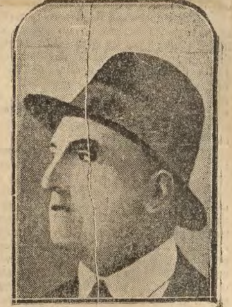
Ricardo Canudo, presidente de la Federación internacional de voluntarios extranjeros

Bueno, pues todo son tortas y pan pintado, en comparación de lo que sucede con las exportaciones. Se están otorgando permisos a gentuza, a verdadera gatuza, que luego los vende y se hincia de ganar dinero, sólo por que tiene amistad con algún personaje. Y está saliendo el aceite por los puertos, no en barcos, sino en flotas enteras, y se está quedando España sin más aceite que el de las manchas de los permisos de exportación.