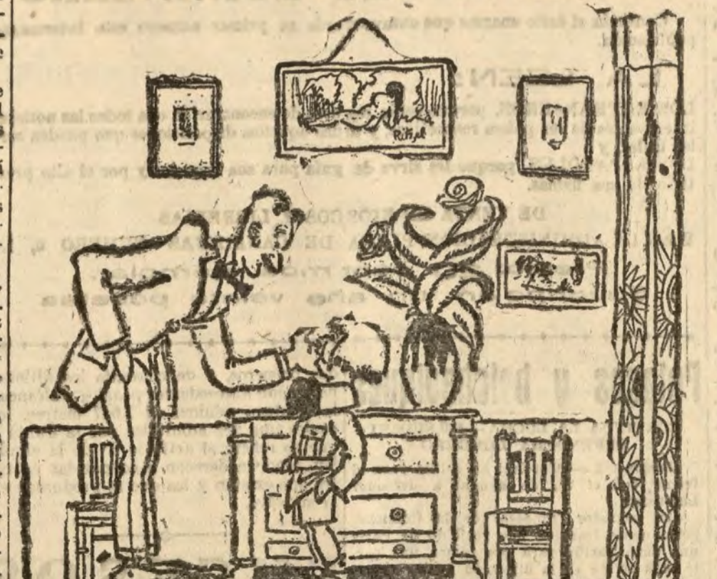
INGENUIDAD — ¿Estará nervioso, muy cansado? — ¿Por qué, rico? — Porque dice mamá que se pasa usted el día corriendo tras de mi hermana. (De Le Rira.)