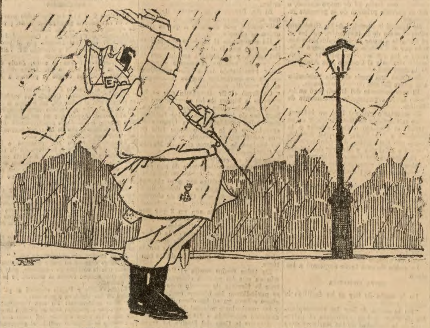
El ejemplo de los de arriba