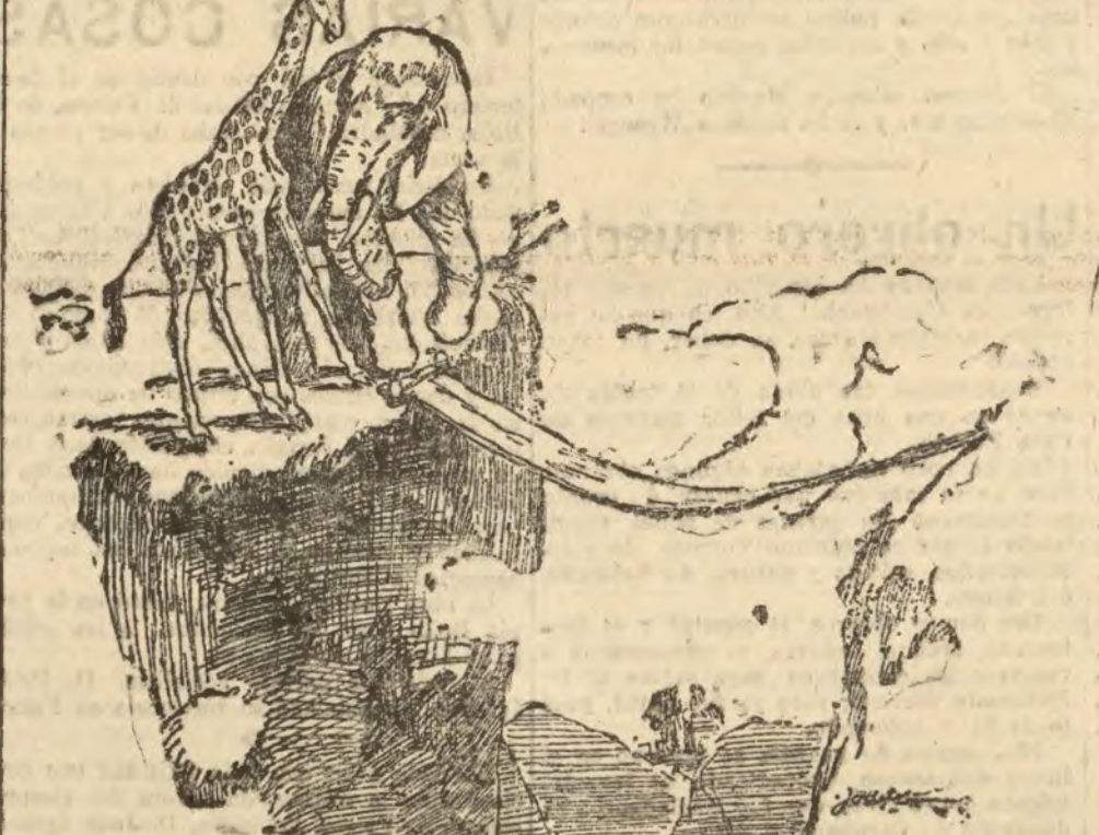
GALANTERIA EL ELEFANTE.—Pasad, querida amiga. LA JIRafa.—Después que usted, querido.