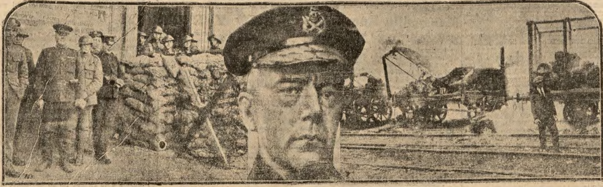
1. Soldados ingleses protegiendo la entrada del Palacio de Justicia defendida por barrio das, mientras se celebran las sesiones en Dublín. 2. Sr Nevil Macready, jefe de las fuerzas inglesas de ocupación en Irlanda. 3. Trenes incendiados por los "sinifeiners"

Han sido decomisados 30.000 kilos de trigo genero en pésimas condiciones. Víctimas de milagro, señores!