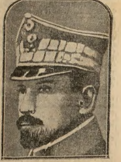
El general Haller, comandante en jefe del Ejército polaco del Norte

París 3.—Procedente de Moscú acaba de llegar a Helsingfors un convoy con 95 franceses. Entre ellos no hay ningún rehén ni personaje conocido.