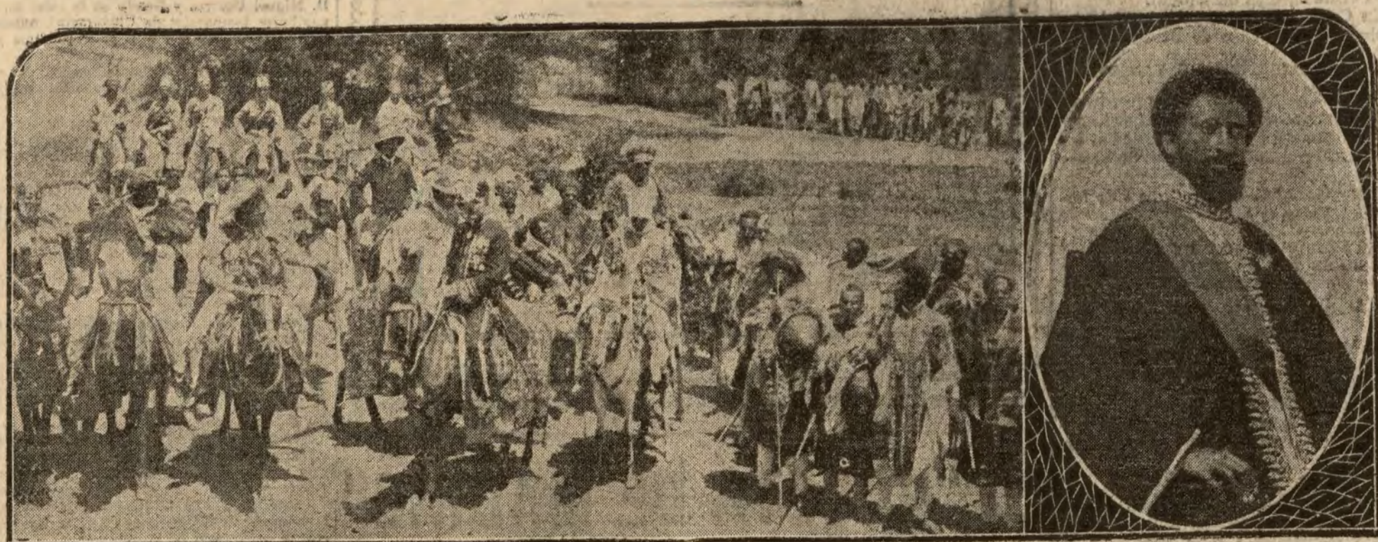
El ministro plenipotenciario de Italia en Etiopía, conde de Piacentini, dirigiéndose al Palacio Real para presentar sus credenciales a Adule-Abeba, Rey etíope, en medio de la pintoresca caravana de rituales que las costumbres abisinias imponen.—En el óvalo, el heredero de la corona etíope Ras Tafari

trito de Chamberí celebráronse 176 juicios, de los que han sido sobreseídos 12 y castigados 164, ascendiendo el importe de las multas impuestas a 1.260 pesetas.