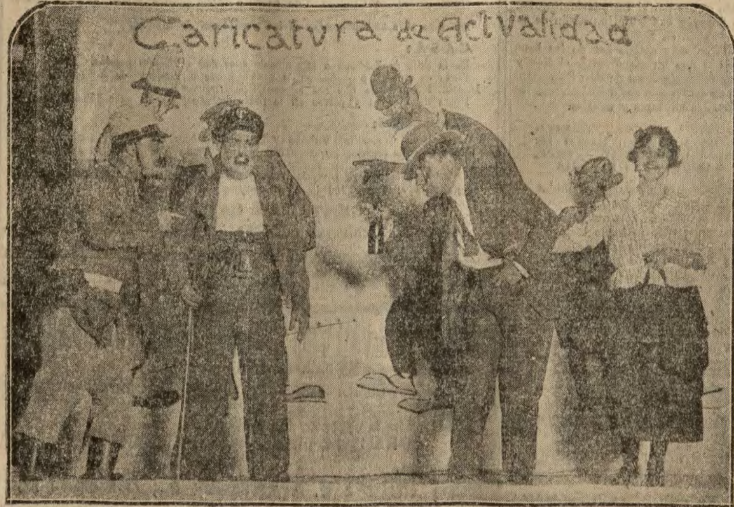
Una escena del juguete cómico "Buen humor", que avochá representaron varios conocidos dibujantes en la fiesta que su Asociación celebró en Parisiana.

París 3.—Dicen de Varsovia a la "Chicago Tribune" que las tropas rojas han atravesado la frontera de Besarabia. Rumania ha empezado a movilizar, según se ha amenazado, a los soviets, en un reciente ultimátum.