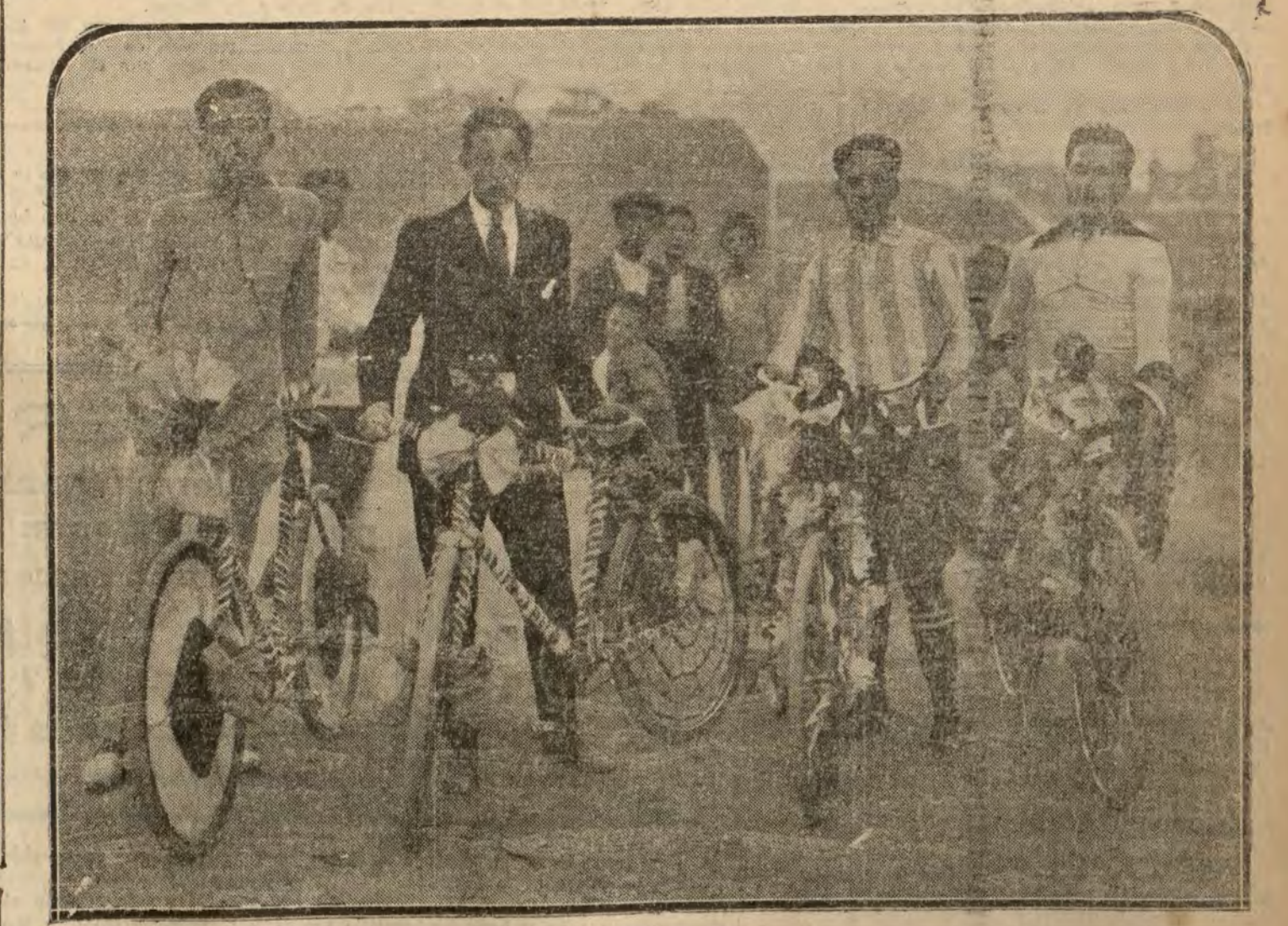
Grupo de ciclistas, que obtuvieron los primeros premios de las carreras celebradas ayer tarde en Bellas Vistas, con motivo de las fiestas de los Cuatro Caminos.