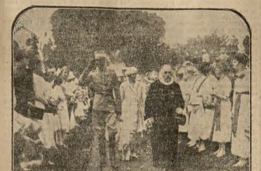
Los Reyes de Dinamarca, recorriendo los poblados cercanos a la capital, donde las mujeres, según las fiestas tradicionales, ofrecen regalos a los reyes.

En los círculos militares griegos est movimiento del enemigo no produce la menor inquietud, pues el ejército griego está dispuesto siempre a cualquier eventualidad.