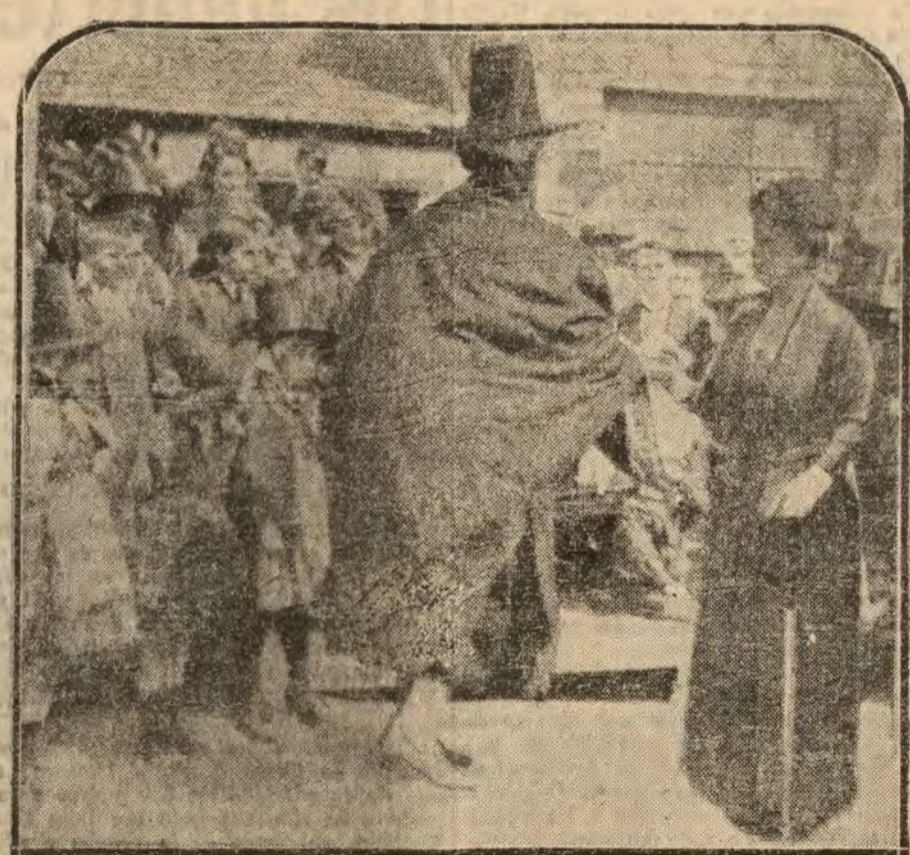
La Reina de Inglaterra, en su reciente visita al país de Gales, recibiendo a una delegación de mujeres, ataviadas a la usanza nacional.

Le Matin deja para el siguiente día la continuación de la interesante conversación transcrita, y en espera de ella que demos nosotros para continuar transcribiéndola a nuestros lectores.