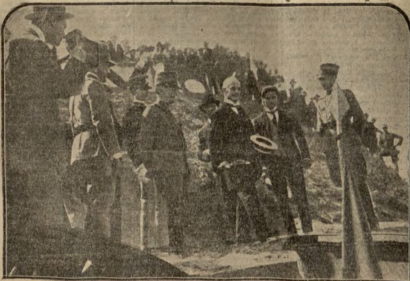
El Rey Víctor Manuel y el ministro de Obras Públicas, Perlo, arrojando las primeras palotadas de tierra con que se inician las labores para la construcción del nuevo puerto romano.