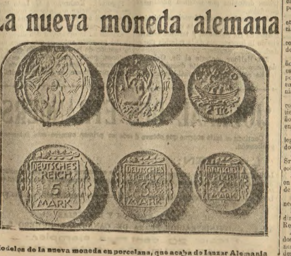
Modelos de la nueva moneda en porcelana, que acaba de lanzar Alemania