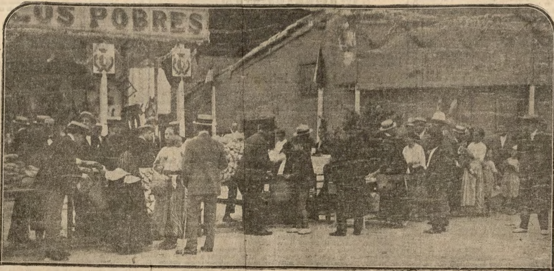
Los pobres durante el reparto de bonos, verificado ayer tarde, en la calle de Fray Cefirino González, por la Asociación Benéfica para el socorro de los pobres del distrito de la Inclusa.

Un día quiso el señor reservarse aquellos terrenos para cotos de regato y desahucio al pueblo entero. En balde gimieron las mujeres y lloraron los ojos y los fueros. En vano suplicaron todos. Sentenció un juez—al amparo del derecho checo, fué decretado.