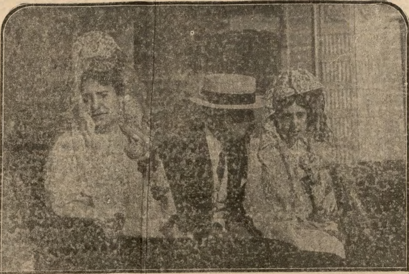
El señor Maestro Laborde y sus esposa y hermana política, momentos antes del atenta- do de que fueron víctimas