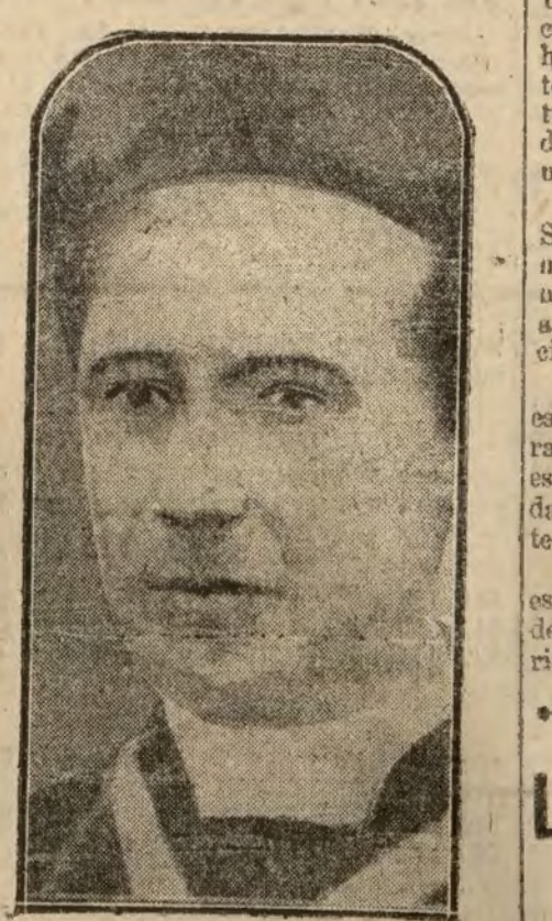
Monseñor Mannix, arzobispo irlandés a quien el Gobierno inglés impide desembarcar en Irlanda ante el temor de sus convincentes propagandas en defensa de la independencia de su país.

Recibimos reiteradas quejas de la Empresa del teatro Bretón, de Salamanca, acerca de las exigencias de que es objeto en lo referente al pago del impuesto del Timbre. Aplicase a dicha Empresa procedimientos verdaderamente vejatorios, que contrastan palpablemente con el régimen de favor imperante respecto de otros colosales salamanquinos. Esperamos que el señor ministro de Hacienda sea de esclarecer cuanto damos jamos indicados para que no prevalezcan ciertas maniobras ni ciertos favoritismos, que dejan muy malparado el concepto de la justicia y el buen nombre de la Administración pública, y se reparen los atropellos de que viene siendo víctima la Empresa del teatro Bretón, de Salamanca, a la que, en perjuicio de su honorabilidad personal y contribuyente, se persigue con rigores que la ley no quiere nunca, dañándola en sus intereses con beneficio de otros, que disfrutan al parecer un régimen excepcional de privilegio.