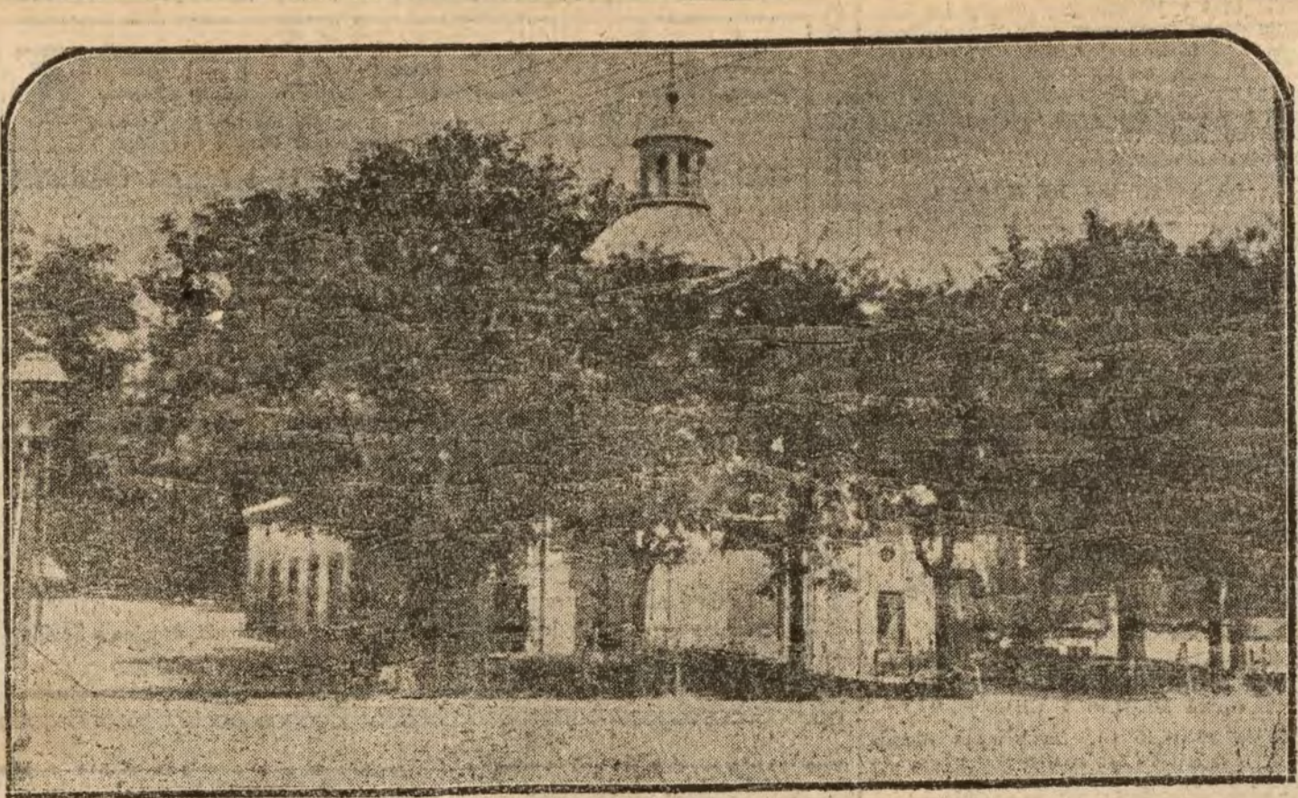
La ermita de San Antonio de la Florida, de la que definitivamente va a retirarse el culto, conforme a la iniciativa, teóricamente defendida por nuestro inviolable compañero Saint-Aubin, dejándola como museo de los célebres cuadros de Goya.

Recibimos reiteradas quejas de la Empresa del teatro Bretón, de Salamanca, acerca de las exigencias de que es objeto en lo referente al pago del impuesto del Timbre. Aplicase a dicha Empresa procedimientos verdaderamente vejatorios, que contrastan palpablemente con el régimen de favor imperante respecto de otros colosales salamanquinos. Esperamos que el señor ministro de Hacienda sea de esclarecer cuanto damos jamos indicados para que no prevalezcan ciertas maniobras ni ciertos favoritismos, que dejan muy malparado el concepto de la justicia y el buen nombre de la Administración pública, y se reparen los atropellos de que viene siendo víctima la Empresa del teatro Bretón, de Salamanca, a la que, en perjuicio de su honorabilidad personal y contribuyente, se persigue con rigores que la ley no quiere nunca, dañándola en sus intereses con beneficio de otros, que disfrutan al parecer un régimen excepcional de privilegio.