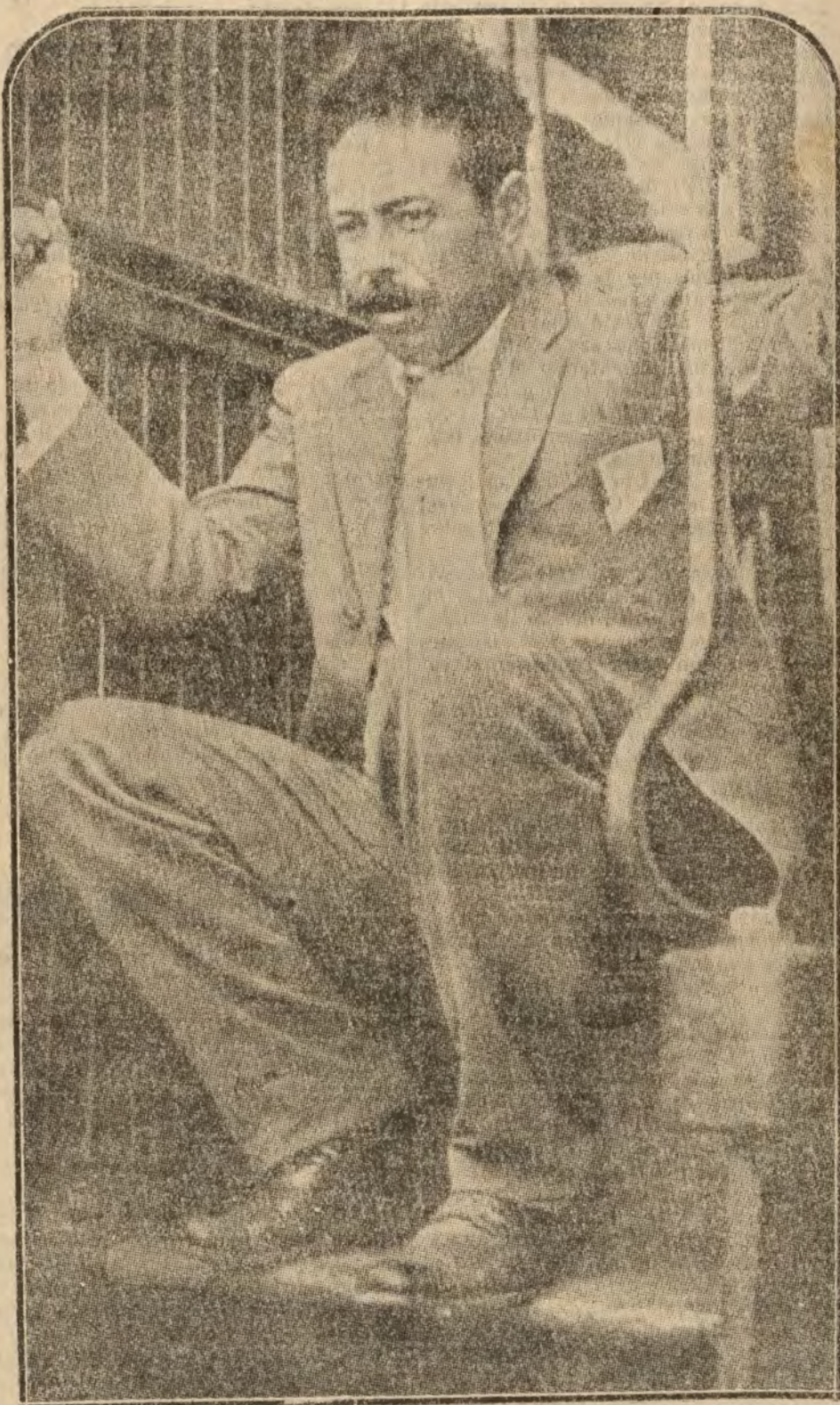
Pancho Villa, el famoso mejicano, entre ladrón y político, que se ha sometido al Gobierno de su país, siendo amnistiado, y que proyecta dedicarse a la cría de ganado.