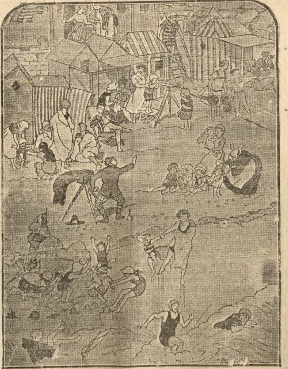
Los placeres de la playa.