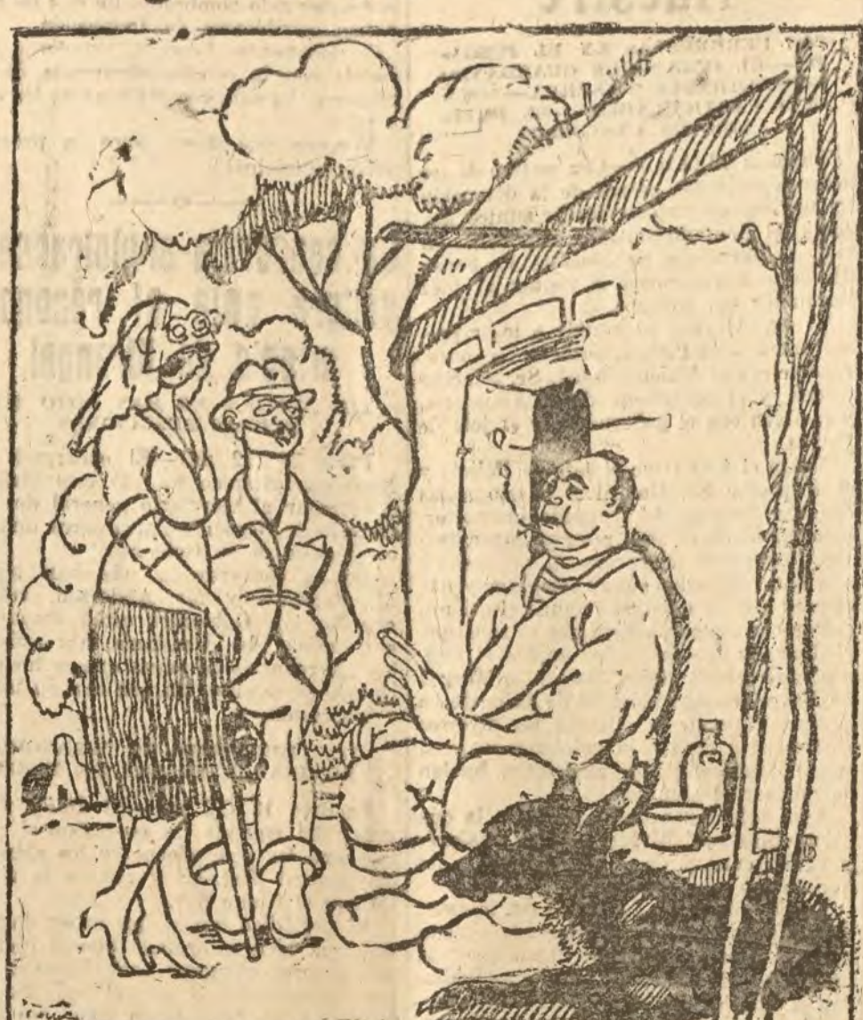
—Al precio que está el trigo la señora tiene que ser muy rica para ponerse tanta harina en la cara.