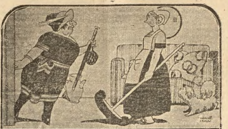
—¿Eh? ¿qué esa queridísima amiga mía?—No, señor, la señora a h'call'o.—Pues oye: lo que cuatro cueros más si te vienes a corv' a mi casa.