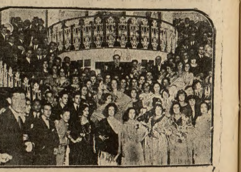
Grupo de concurrentes a la verbena del Circolo Mercantil, celebrada anoche en "La Perla"