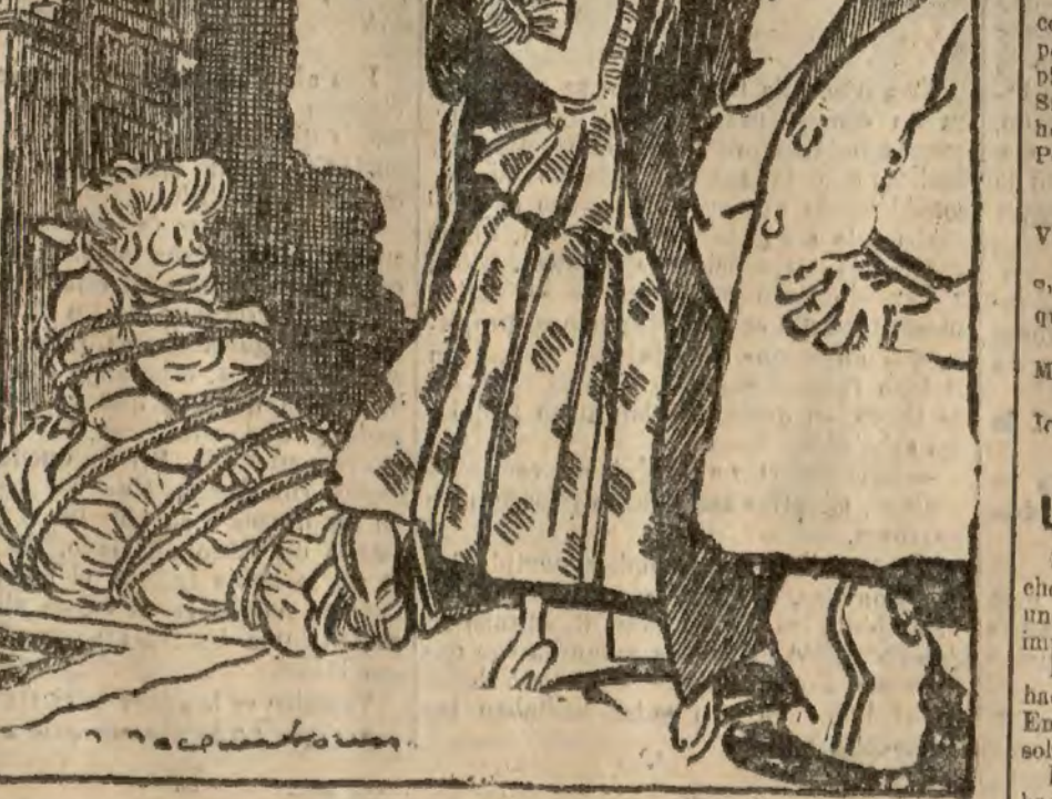
—Han venido los ladrones y se han llevado las joyas de la señora. —¿Qué se lo va a hacer? ¡Alabado sea Dios! Así va a ser un poco de lo que intervienen las fuerzas de Seguridad, que