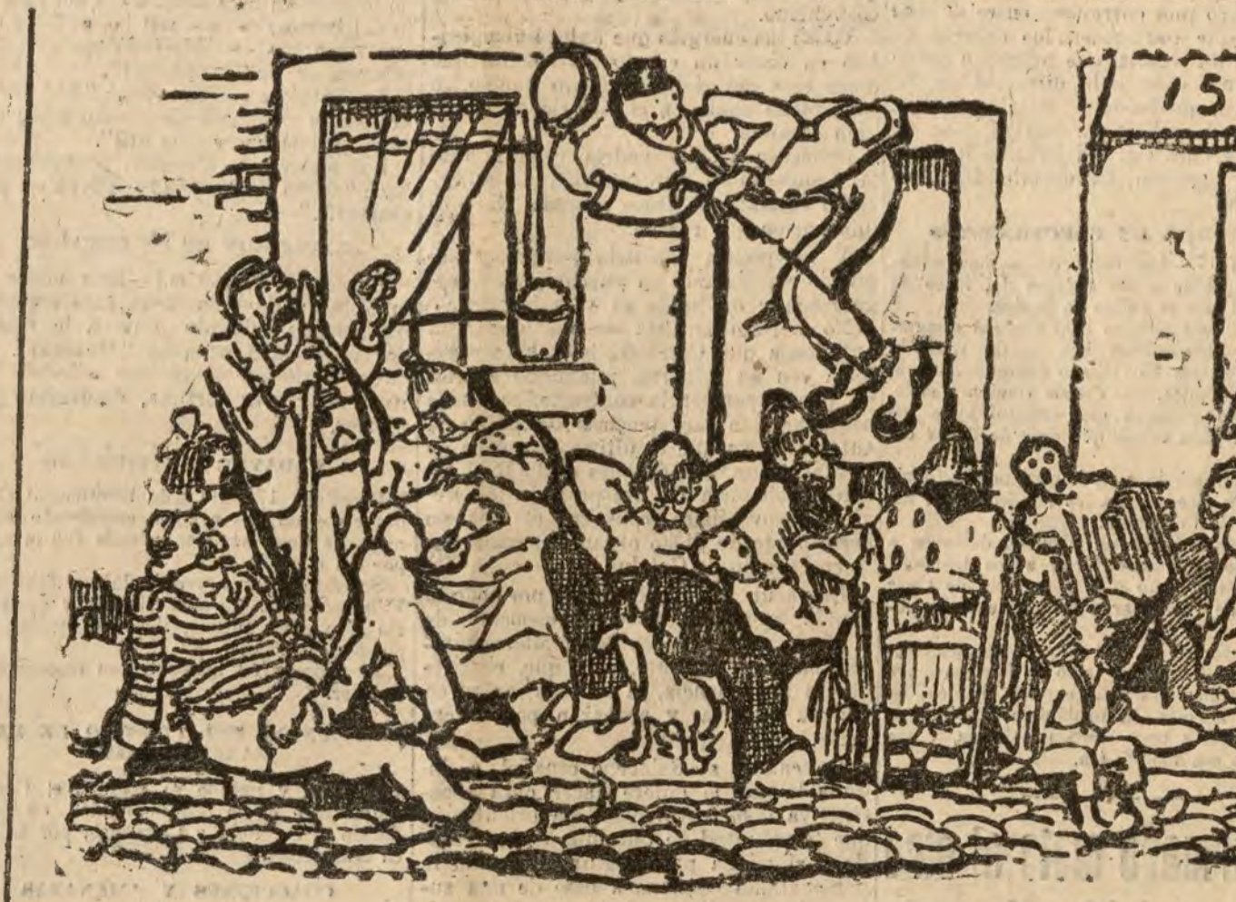
— ¡Ustedes me dispensarán que pase por delante! ...