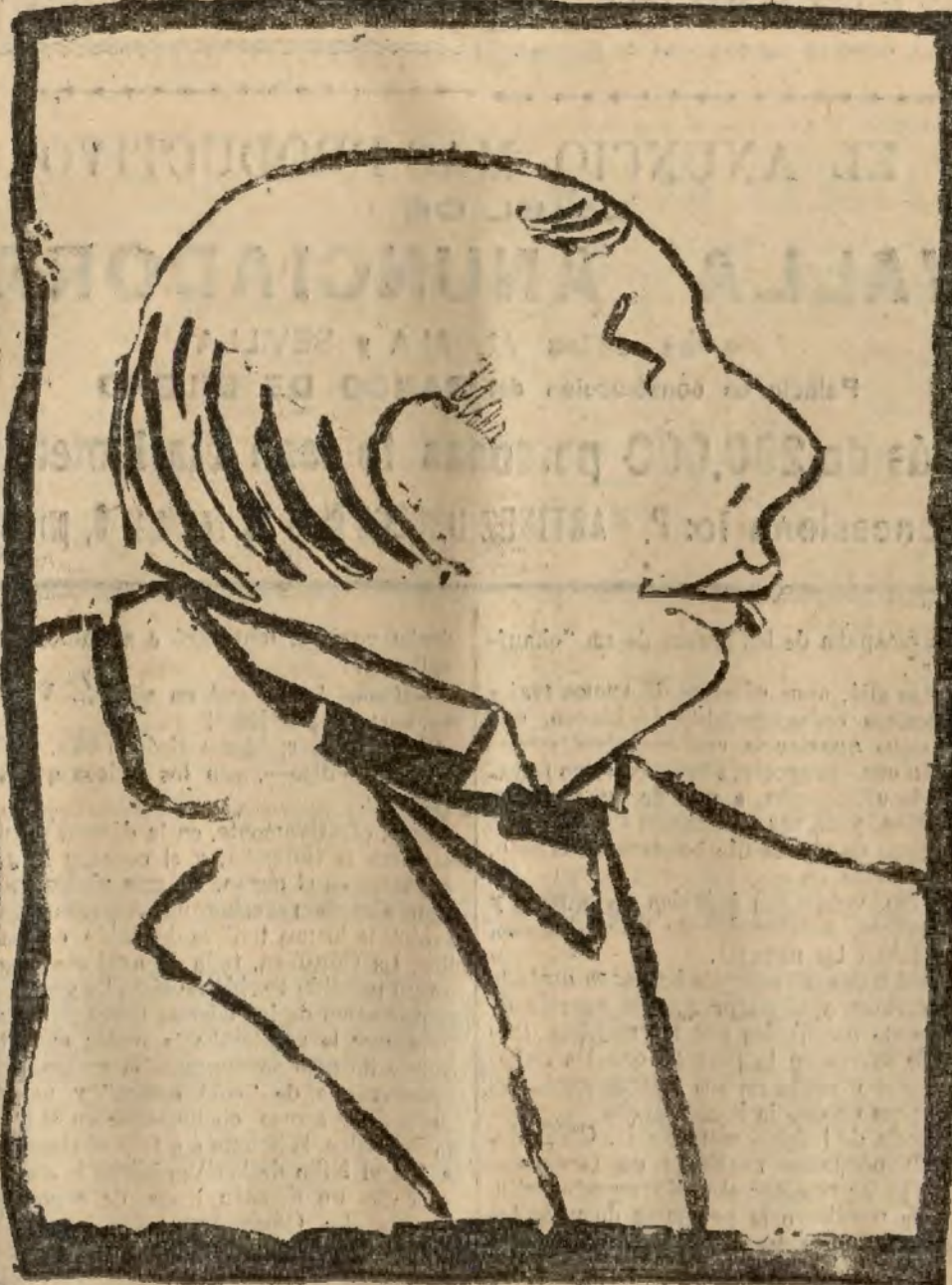
ANTOINETTE. Apunte por Sacha Guit'y.

Conservatorios, aplicados hasta ahora tan solo a la formación de actores?