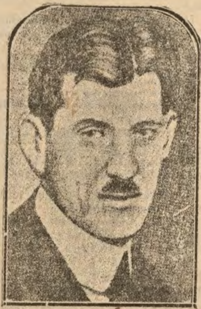
El general Sikonski, comandante del Ejercito polo de Bug, que según los comunicados oficiales acata de ordenar la retirada de dicho punto para reforzar la línea del frente.

Más vale así. Por lo menos os permite vivir alegres y confiados, sin temor a la otra crisis, a la verdadera, a la grande, a la crisis total e intensamente renovadora que, en definitiva, os aplastará.