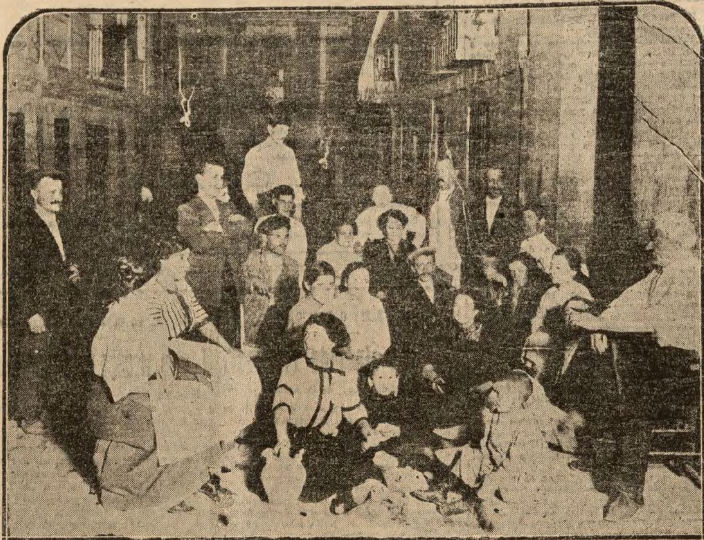
Una tertulia al aire libre.