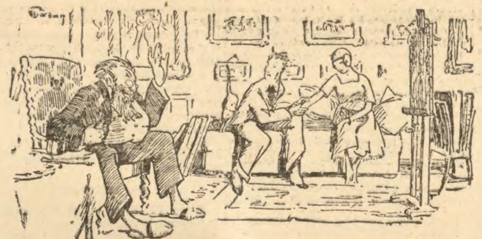
EL MAESTRO CASA A SU HIJA

—Y dígame dónde ha salido usted ahora? —¿A usted que le importa? ¿Acaso le pregunto de dónde ha salido usted?