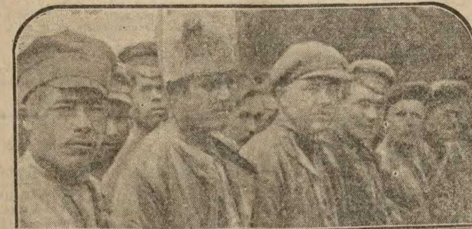
Tipos del Ejército rojo de los soviets de Rusia, prisioneros de los polacos.

Inmediatamente se reanudará el trabajo en todos los oficios.