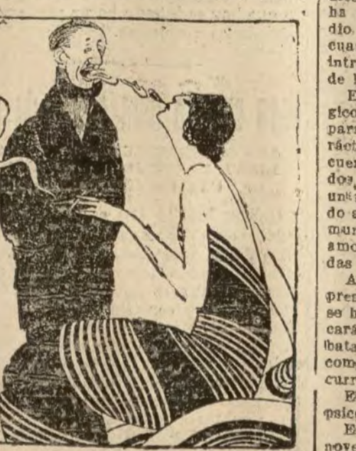
El coloso de las resurrecciones.