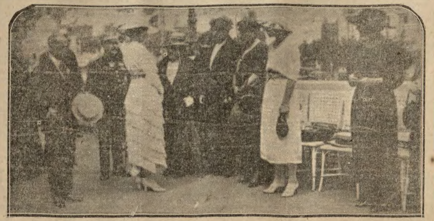
La Reina doña Victoria en el soto de la inauguración de la tómbola de la Cruz Roja, instalada en el Casino de Santander.