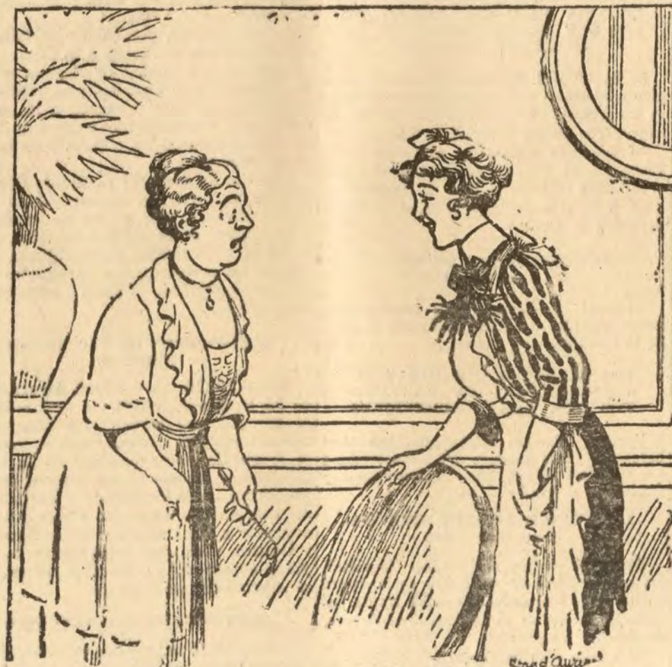
LA ESCASEZ DE CRADAS

—Tú no me has querido reconocer... pero yo te reconozco. ¡Papá!... ¡Papá!