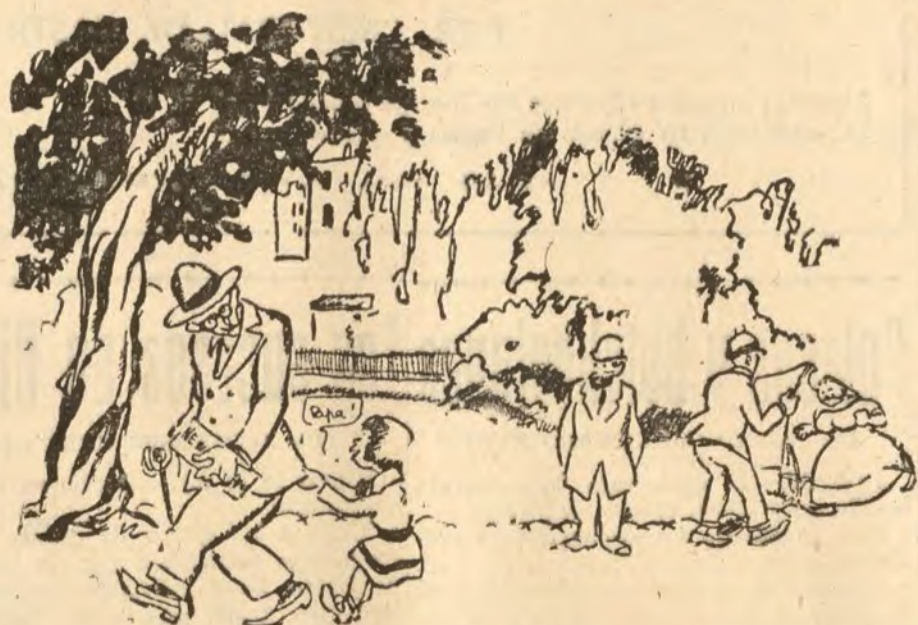
LOS AMERICANOS EN PARIS

—Tú no me has querido reconocer... pero yo te reconozco. ¡Papá!... ¡Papá!