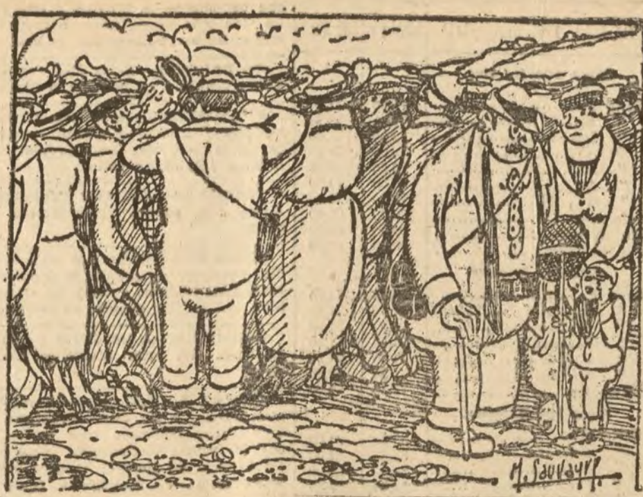
LAS PLAYAS DE MODA

Antes de tomar el tren compraremos tarjetas postales para ver cómo es el mar.