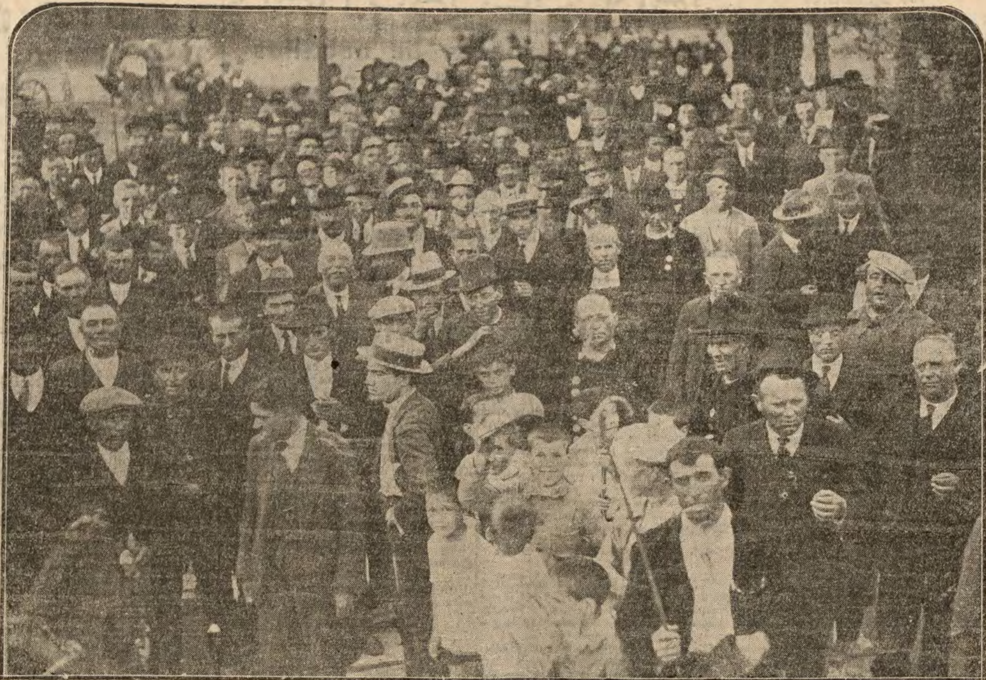
Los comisionados trigueros de Sala rancia al dirigirse ayer a la Presidencia para visitar al señor Dato

El gobernador civil dijo a los periodistas que ayer tuvo audiencia, según a sus palabras declararon en huelga los tripulantes del vapor "Kavisk", anclado en este puerto. Inmediatamente tomó las medidas oportunas y oportunamente se vio que las condiciones eran en un todo favorables.