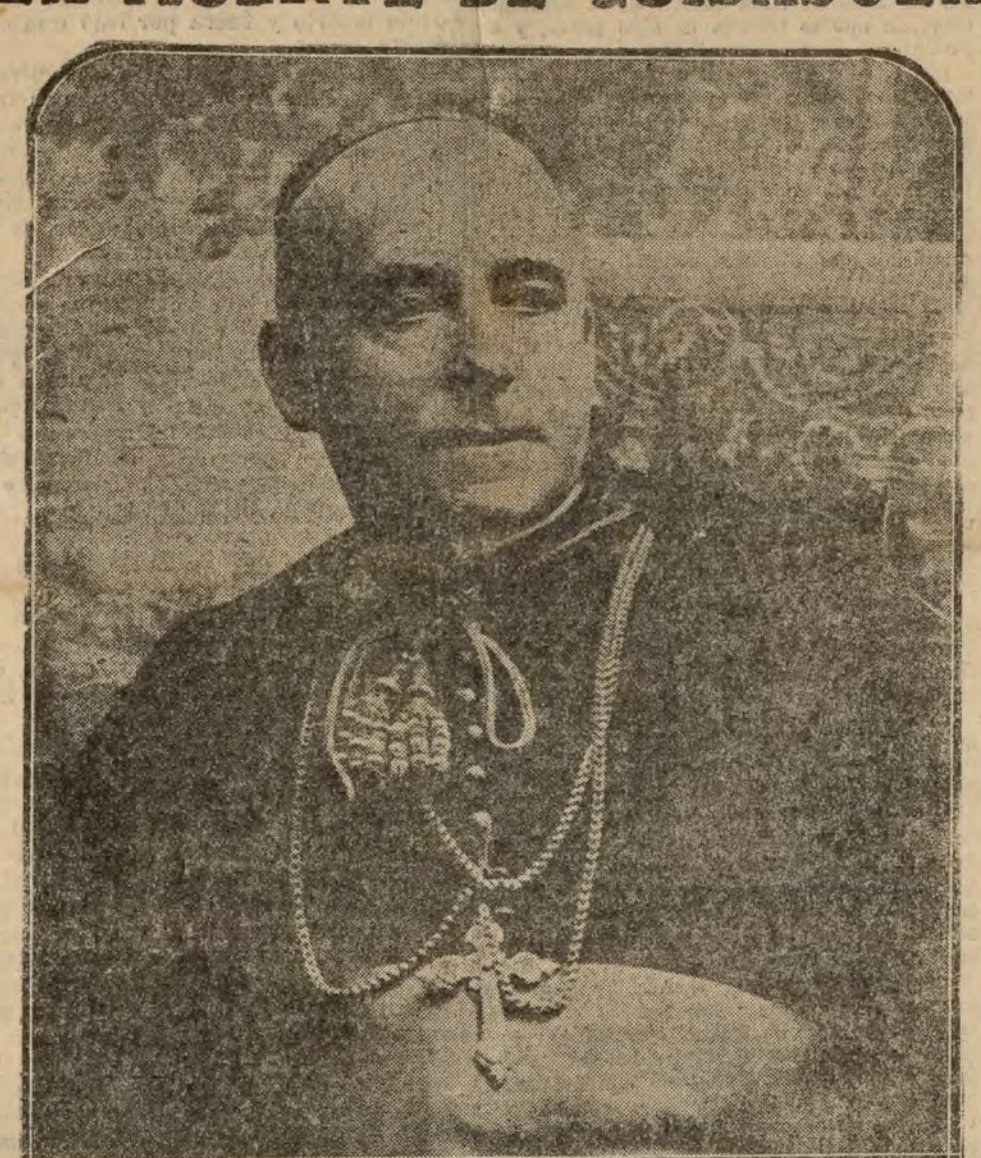
Don Victoriano Guisasaola, arzobispo de Toledo, fallecido en Madrid esta madrugada.

Esta pasada madrugada, en la Comisaría general de la Santa Cruzada, donde estaba siendo atendido desde que vino a Madrid, ha fallecido el cardenal Guisasaola.