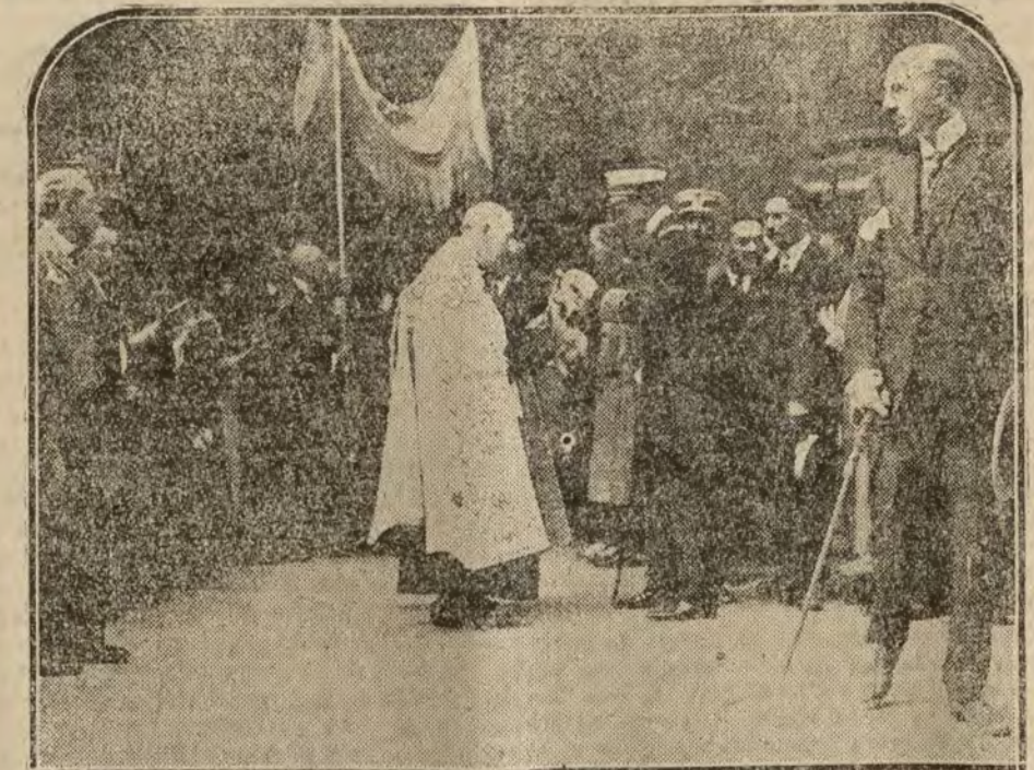
Los Reyes saliendo del Santuario de Begoña, bajo palio, durante su estancia en Bilbao.