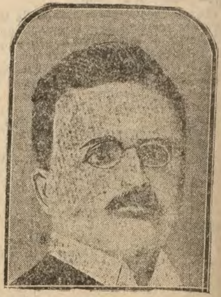
M. Labriola, ministro del Trabajo, del Gobierno italiano, que actúa cerca de los sindicalistas revolucionarios de Turin, como concertador de un convenio entre el Gobierno y el proletariado.