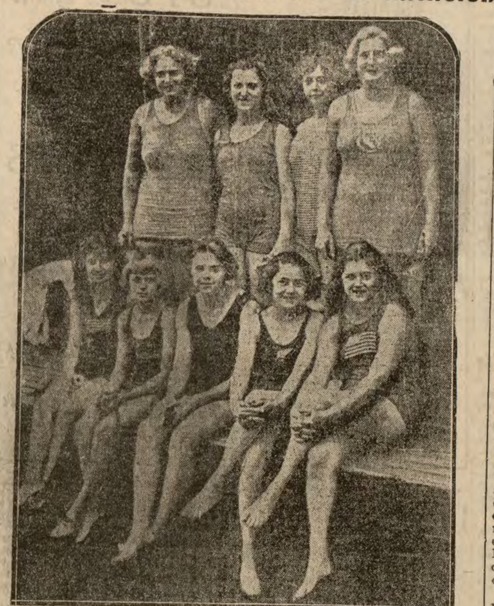
Las nadadoras norteamericanas que tomarán parte en el concurso que se celebrará en la Isla de los Cien; forman parte de este equipo los campeones del mundo Norman Ross y Kohonamoku.