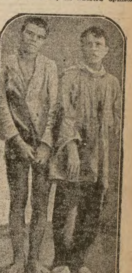
Dos ocupantes de la celda número 7, en la Cárcel Modelo, durante el invierno de 1906