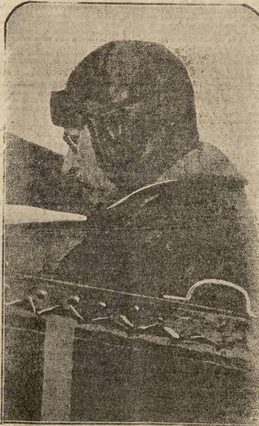
El Rey Alberto de Bélgica, a bordo del biplano francés en el que ha realizado un extenso vuelo a lo largo de la costa francesa.

Esta es la divisa de los no abstencionistas o "humados", si hemos de calificarlos a la manera americana.