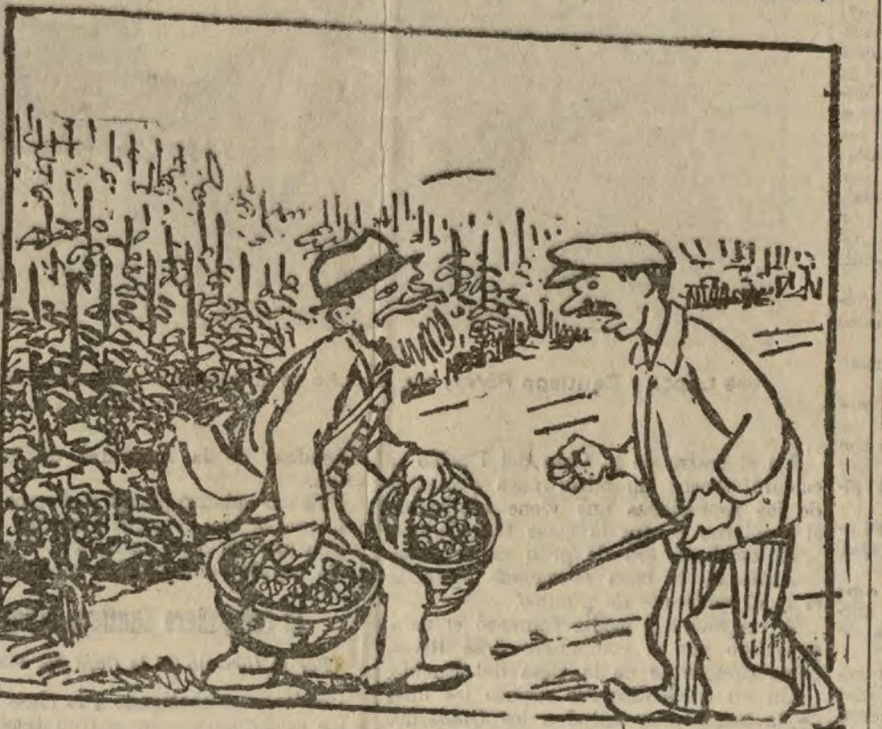
— Su familia trata de incapacitarle; no hace más que locuras; no se priva de nada; ayer se comió dos raciones de langostinos (De Le Journal).