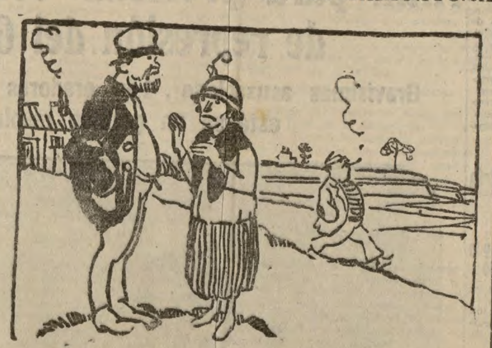
— Su familia trata de incapacitarle; no hace más que locuras; no se priva de nada; ayer se comió dos raciones de langostinos (De Le Journal).