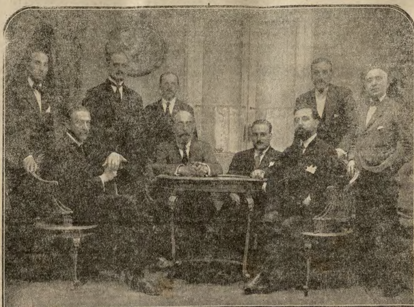
Profesores y representantes de las Escuelas de Náutica, que han asistido a la Asamblea que se está celebrando en Madrid.