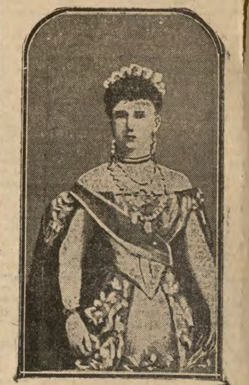
La gran duquesa Wladimir de Rusia, que acaba de fallecer en Francia

Hace algunos años, un anticuario de Barcelona descubrió el cuadro en un granero del convento y lo compró para uno de sus clientes que deseaba tener un retrato de Santa Teresa; pero cuando se le mostró en Londres, se notó que había dos pinturas superpuestas y se quitó con mucho cuidado la primera. Entonces fue cuando se vio la obra de Velázquez.