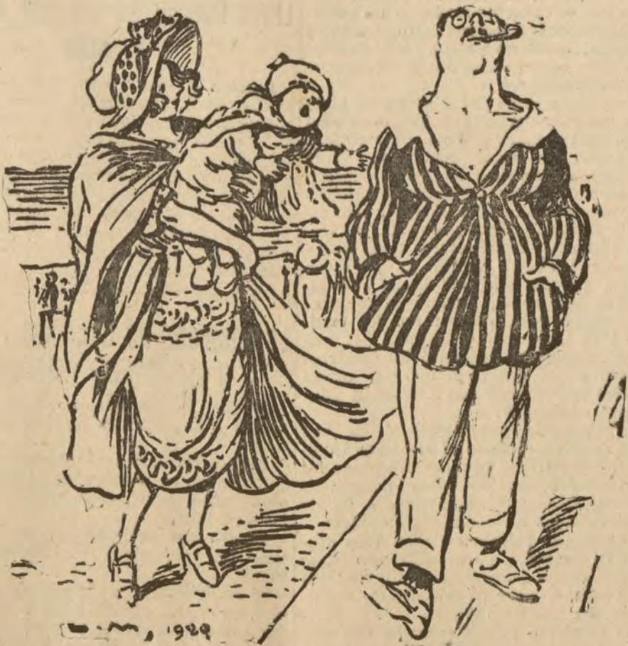
INCONVENIENTES DE CIERTAS MODAS EL PEQUEÑO, equivocándose.—Amal (De Petit Journal.)