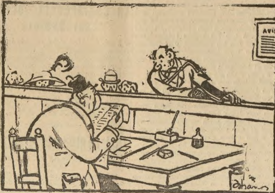
DULZURAS ADMINISTRATIVAS EL DEL PUBLICO.—Caballero, ¿se ha fijado usted en que llevo tres horas aquí? EL EMPLEADO.—¿Y qué? ¿Vaya una razón! ¿No llevo yo diez y ocho años? (De Le Matin.)