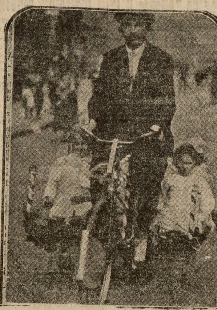
Cómo resuelven los obreros londinenses el problema del coche familiar, adosando dos cestos de mimbre a los lados de su bicicleta, transportando de esta forma a sus pequeños.