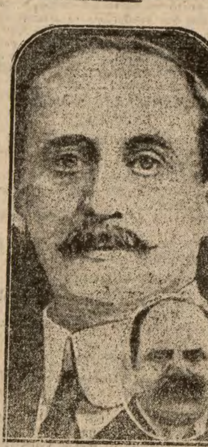
Lord Hardinge, de Penhurst, ex Virrey de Irlanda y actual subsecretario permanente del Ministerio de Estado inglés, a quien Inglaterra enviará el próximo noviembre como embajador en París.—En el óvalo: Lord Derby, actual representante inglés, que será sustituido