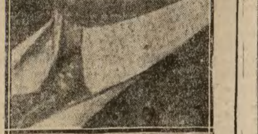
Mr. Gary, el rey americano del acero