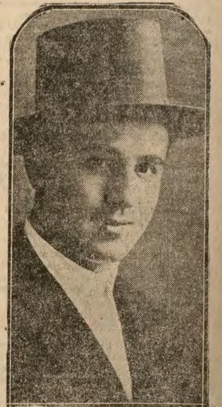
El valiente diestro Emilio Mendez, que el día 19 toma la alternativa en la Plaza de Madrid.