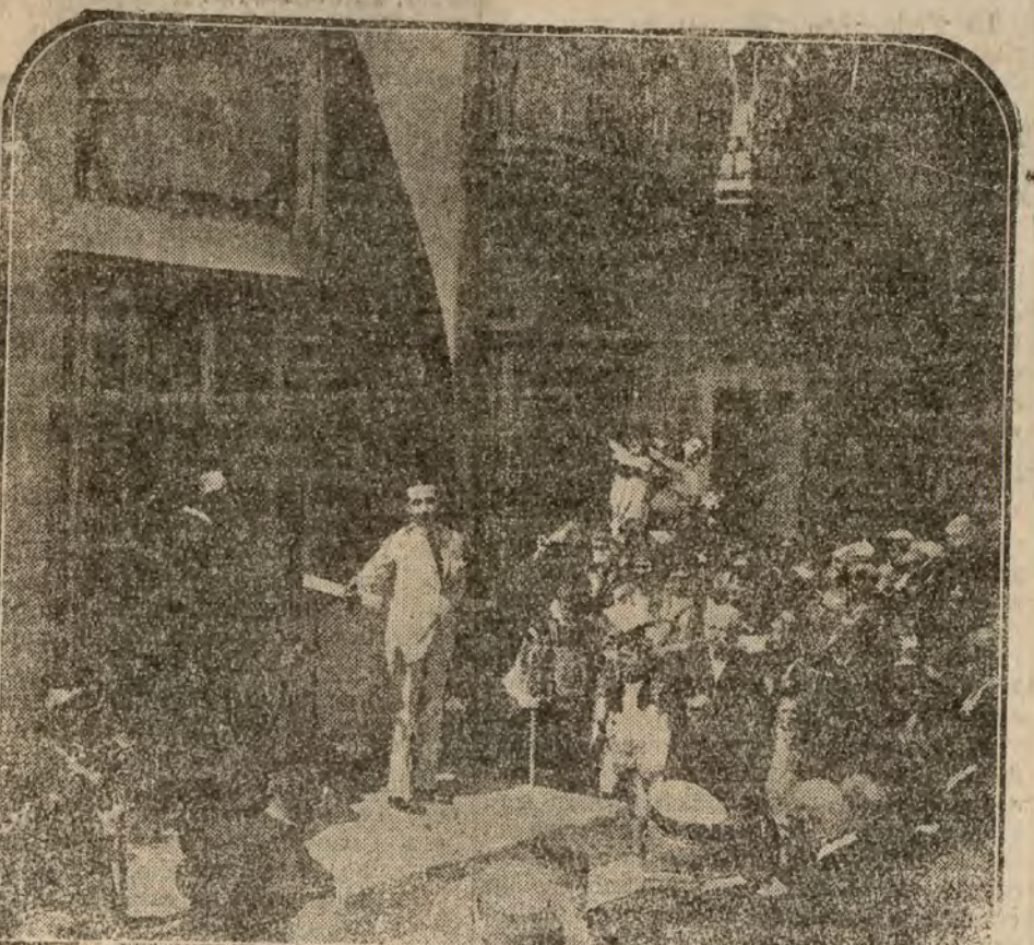
1 El alcalde del Puerto de Santa María, descubriendo la lápida en honor de Muñoz Seca.—2 El gracioso autor, conmovido, da las gracias a su pueblo natal

La semana pasada comenzaron a llegar a Madrid las primeras nuevas. Nadie las creía; todo el mundo afirmaba que muerta la gran crisis conservadora, y su poder añadir una palabra más al martirio del alcalde de Cork, los periodistas habían inventado, como una continuación de la inevitable serpiente de mar, el homenaje del Puerto de Santa María a su preclaro hijo D. Pedro Muñoz Seca.