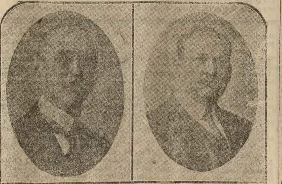
Don Jorge Meléndez, presidente de la República de El Salvador.