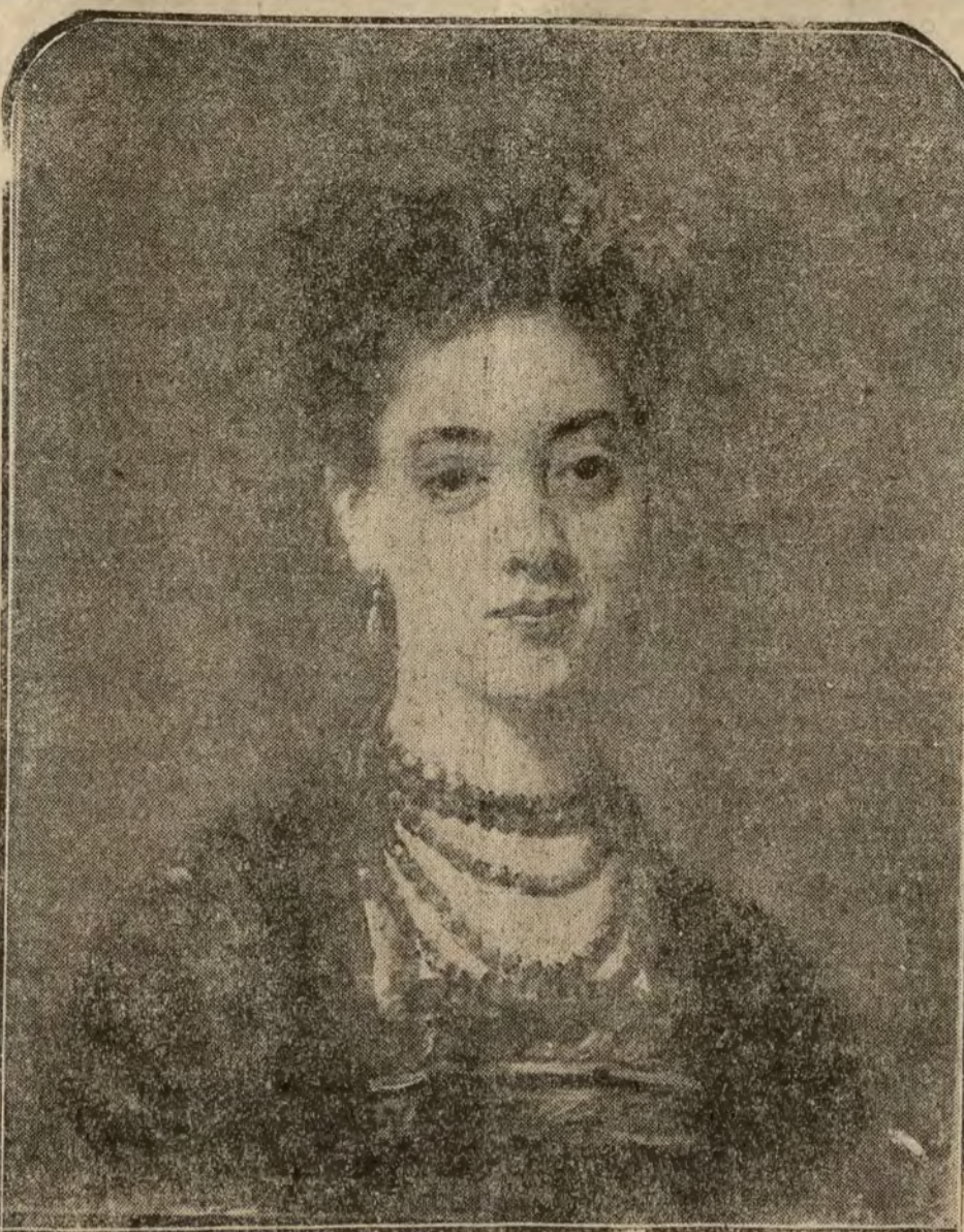
Retrato de la hija del célebre compositor Gaztambide, por Jaime de Madrazo.

Pero no es extraño: el Gobierno sólo se conserva y ha de mirar por los que tienen la sartén por el mango. ¡Al freír será el reír!