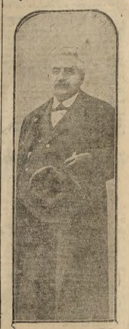
M. Millerand, jefe del Gobierno cuya candidatura gana terreno