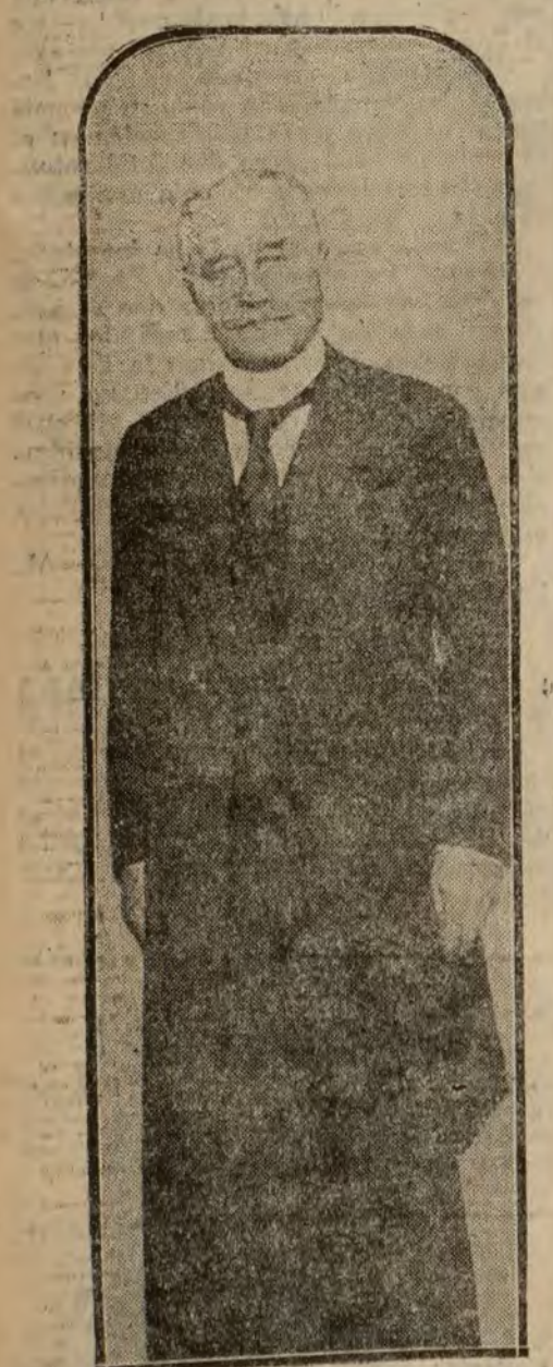
M. Deschanel, cuya fugaz presidencia ha llegado al ocaso

dos y de los que nos amenazan en el caso de no consolidarse el cambio de conducta que se inicia en estos momentos.