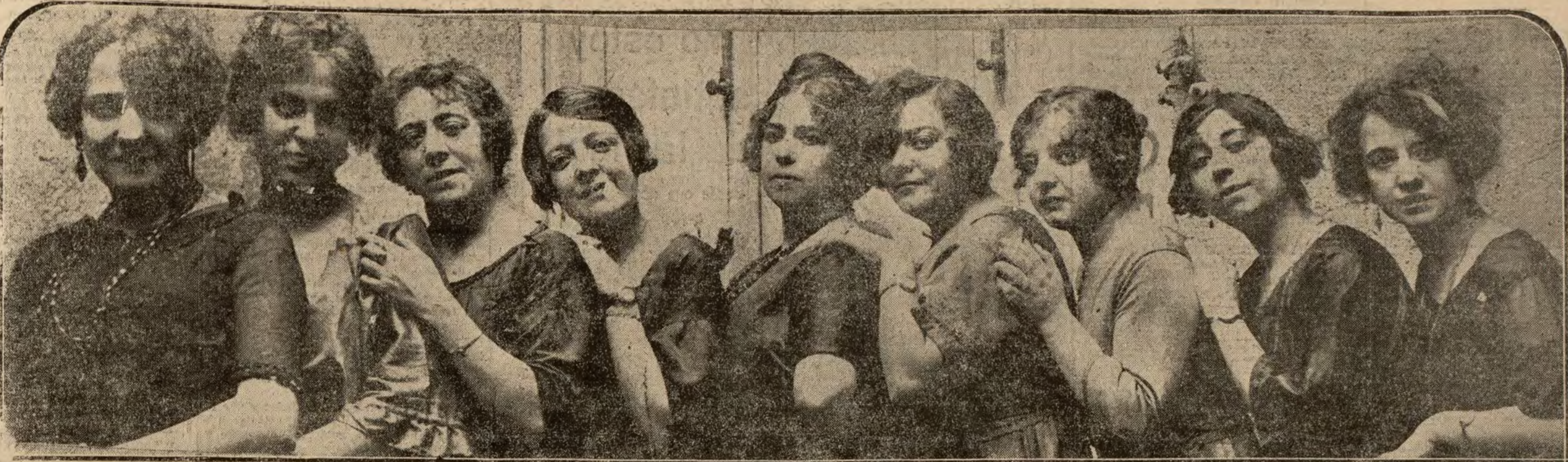
LAS COMPAÑIAS TEATRALES.—Las tiple del teatro Cervantes, que ha inaugurado ayer la temporada invernal