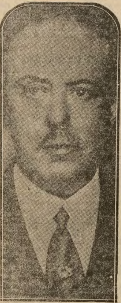
El marques de Amposta, nuevo embajador de España en la República Argentina

No es nuevo tampoco para ustedes—continué diciendo el Sr. Dato—que se han hecho algunos intentos de concentración conservadora para ver la manera de continuar la obra de estas Cortes con una mayoría efectiva. Pero tales intentos, con los cuales se perseguía que el Gobierno dispusiera de una mayoría, se han frac-