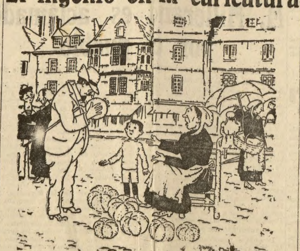
— ¡Pero este melón huele a goma! — ¡Ya lo creo! ¡Si ha cogido usted el balón del niño! (De Le Rire.)