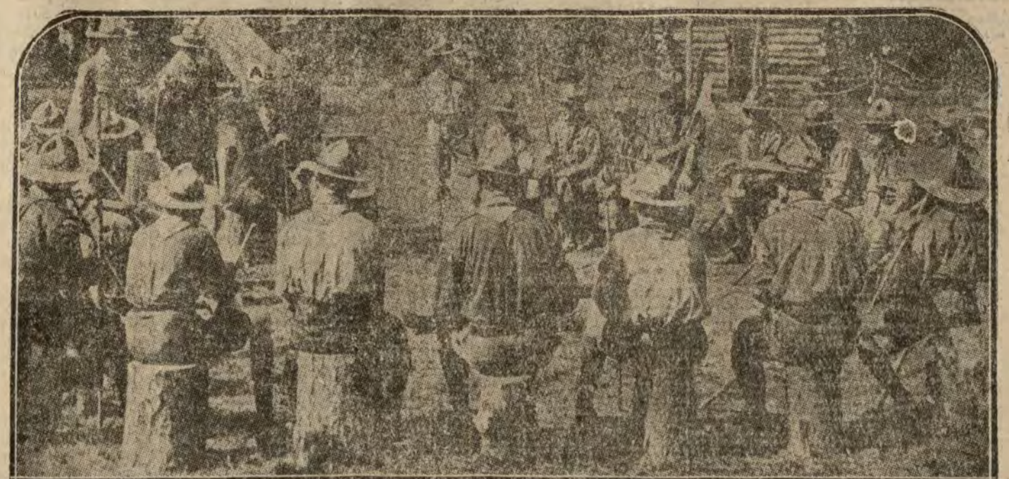
Durante su reciente visita al Canadá, el duque de Connaught (A) asiste al curso de una Universidad de Boy Ayuntamiento de Madrid