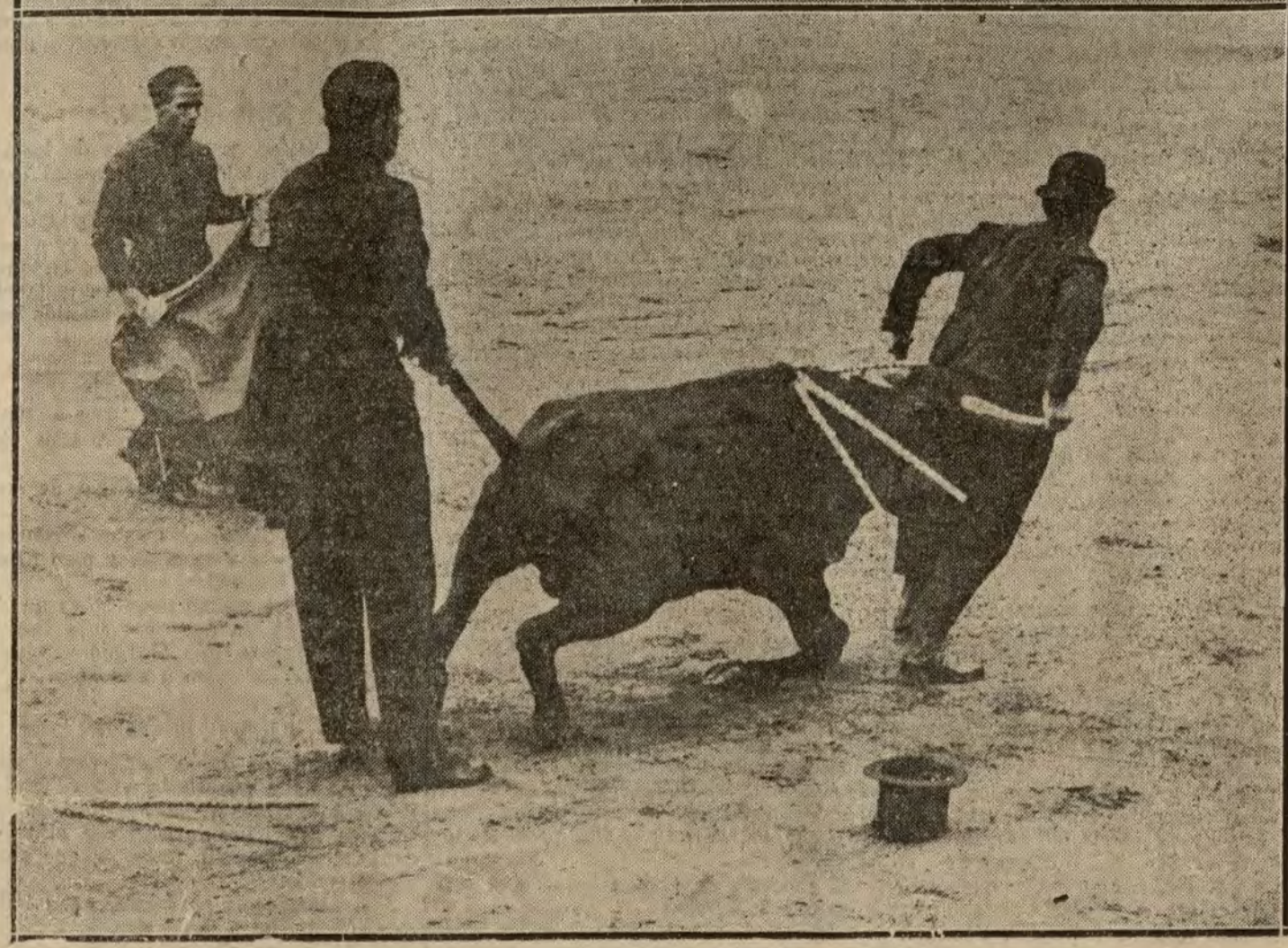
Meia, en un par de vaquerías. Cogida de Meia por su primer tiro. Un momento de la parte bufa