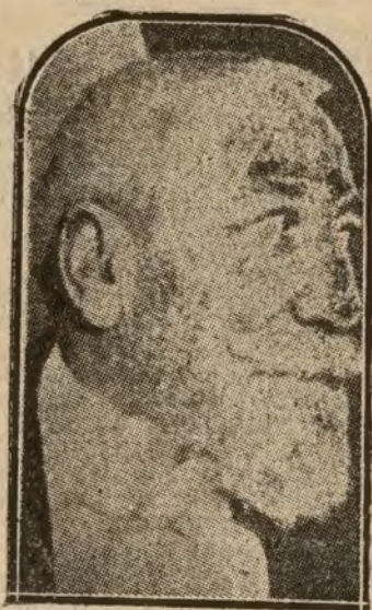
El famoso escritor francés Anatole France, cuyo estado de salud inspira grandes inquietudes

Ahora, con la del niño degollado, la mayoría de los periódicos han rivalizado en tirarse planchas. Sus informaciones parecían acordeones de prosa. El primer día, casi cerrado el acordeón; el segundo, más estirado, y así sucesivamente, hasta cubrir planas y planas. Es excesivo, y hace que paguen justos por pecadores. Conviene que mediten sobre esto los directores de periódicos.