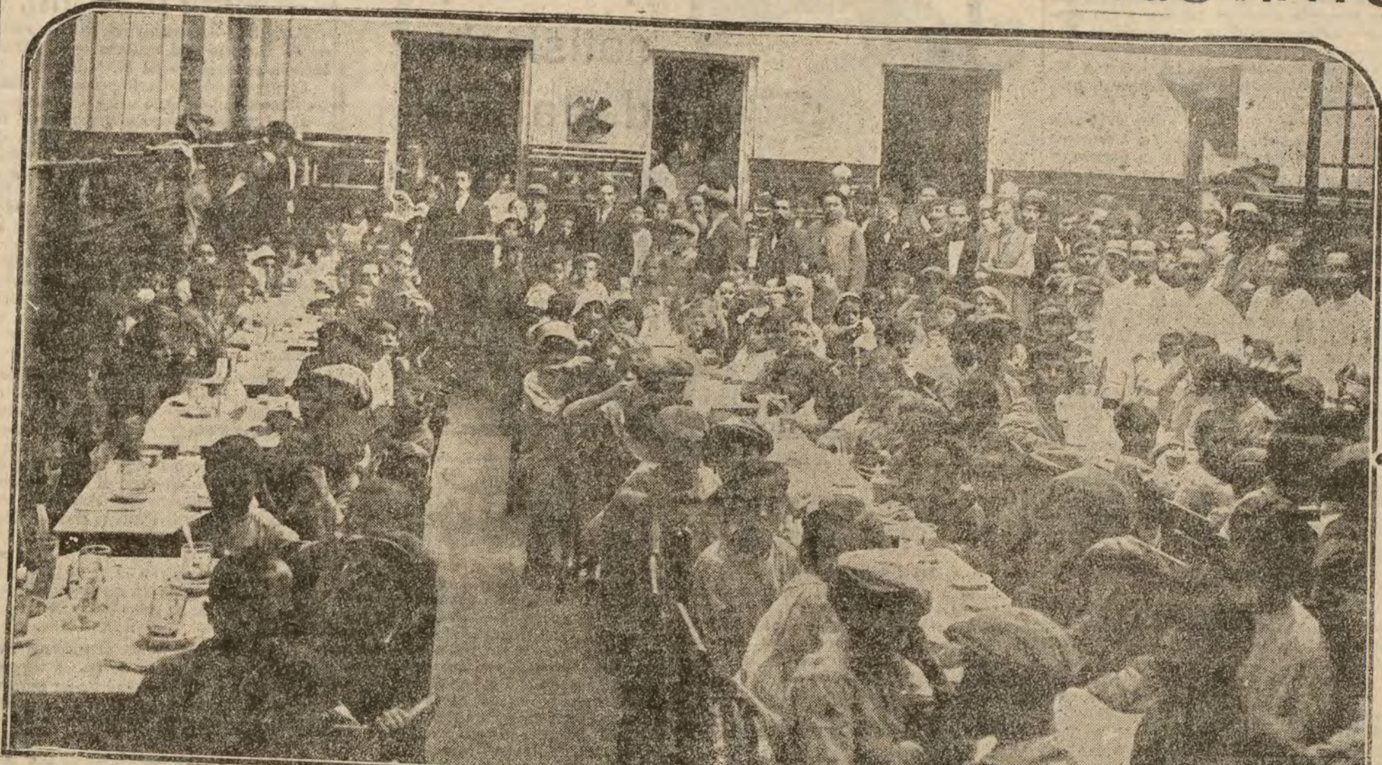
Los 229 niños de Riotinto, desayunando en el café de la Casa del Pueblo