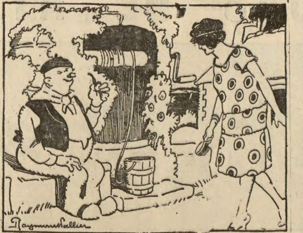
HIGIENE CAMPESTRE —¿Me da usted un tazón de agua, tío Roque? —Es para beber o para lavarse, señorita? (De Le Rire.)