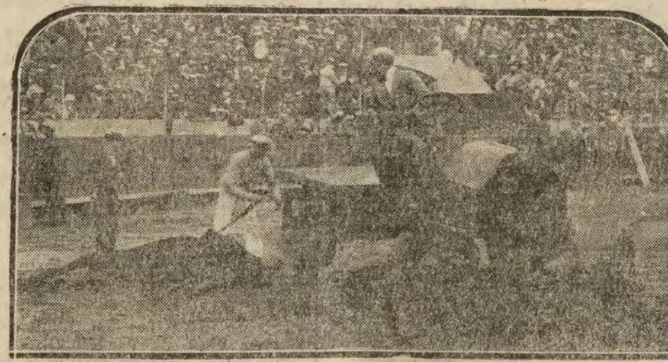
DE LA HUELGA DE CARRETEROS EN BARCELONA.—Camión automóvil haciendo el servicio de arrastre de la Plaza de Toros.

El "camelot" no había perdido nada, y se ahorcó el trabajo de la venta.