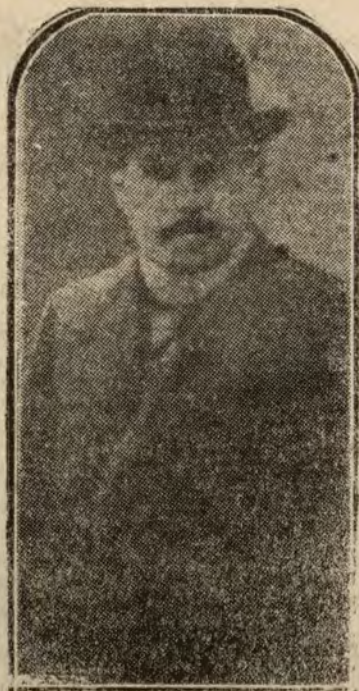
El doctor Von Kahr, presidente del Consejo de Ministros de Baviera, a quien se acusa de favorecer la formación de organizaciones militares secretas que se extenderán a Alemania y Austria.

Esperamos que a su funcionamiento preceda una seria organización y una publicidad grande, para que todos los vecinos puedan aprovecharse de esta mejora.