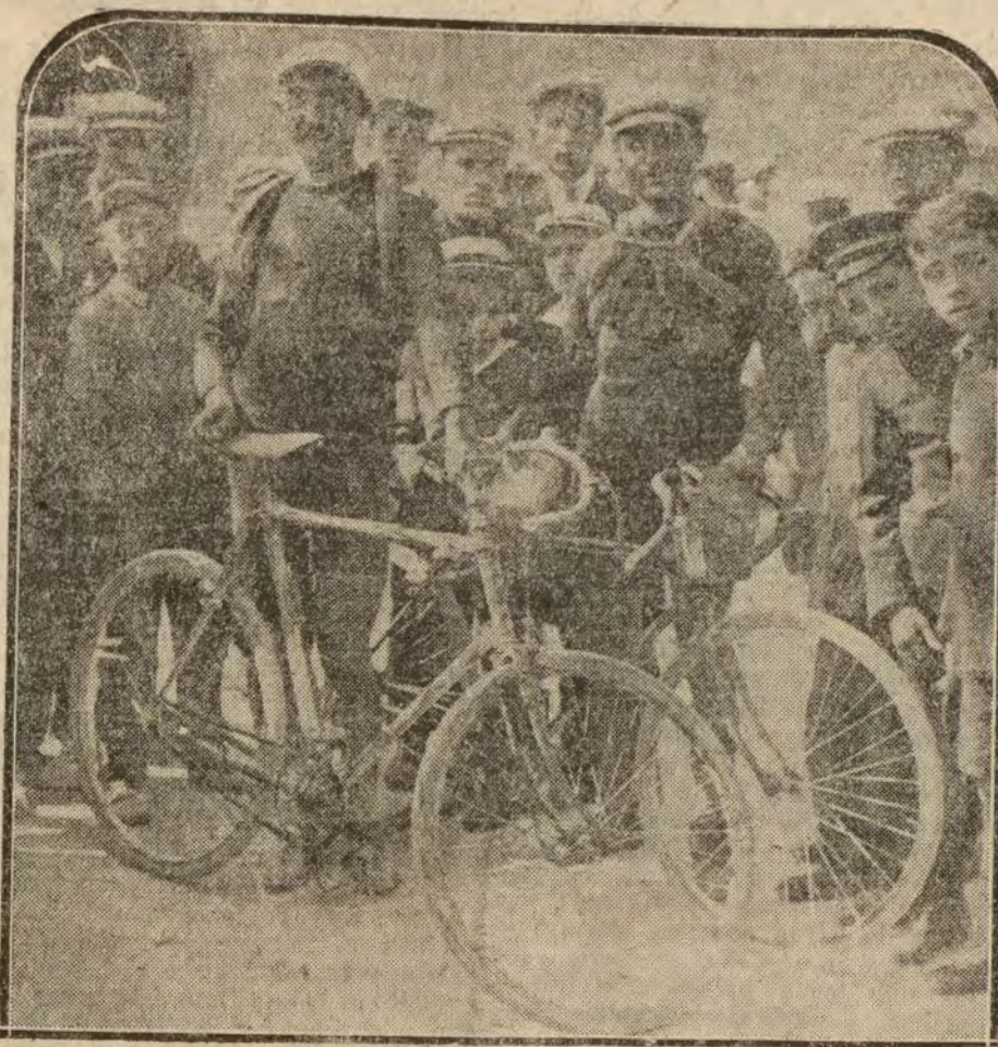
Los célebres corredores franceses Pelleker y Nat, ganadores del primero y segundo premios en la carrera de 614 kilómetros, realizada en tres horas.