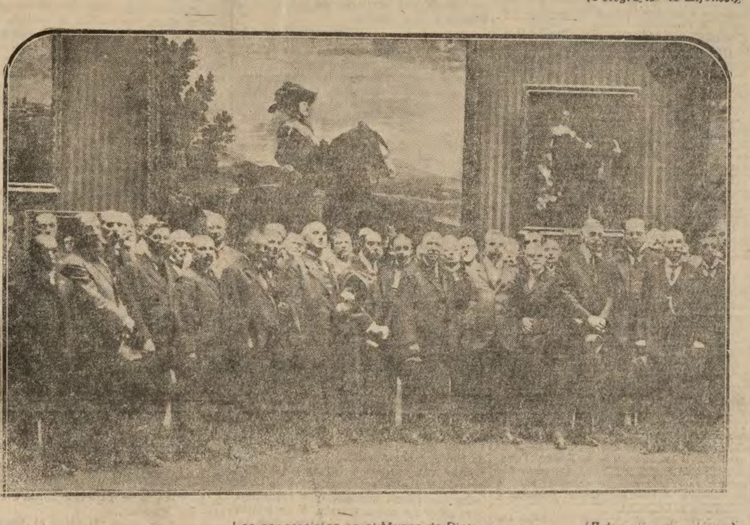
Los congresistas en el Museo de Pinturas