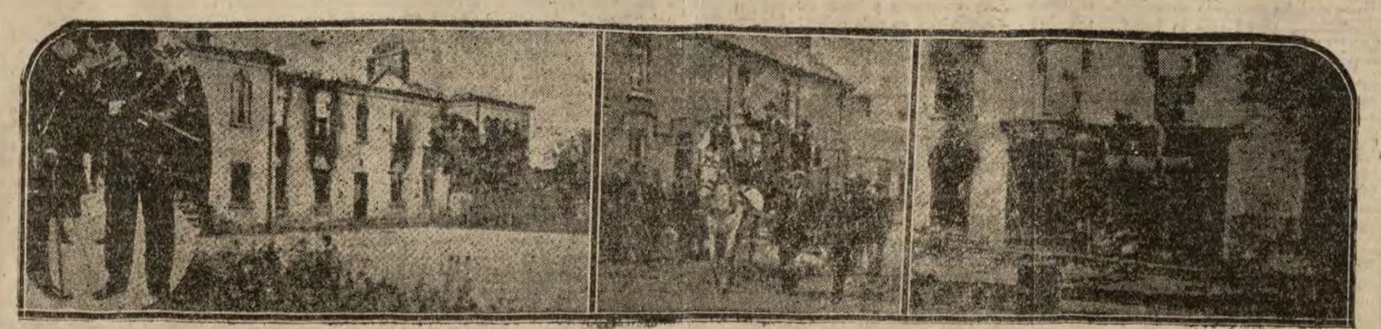
1 M. Hamar Greenwood, secretario de Irlanda, inspeccionando las armas de los soldados de Dublin. — 2 Los cuarteles de la Policía de Trim, incendiados por los sinfeiners. — 3 Los habitantes de Trim, abandonando la ciudad enarbolando la bandera del sinfein. — 4 Casas de los sinfeiners de Trim, incendiadas por la Policía en revancha de las destrucciones de los irlandeses