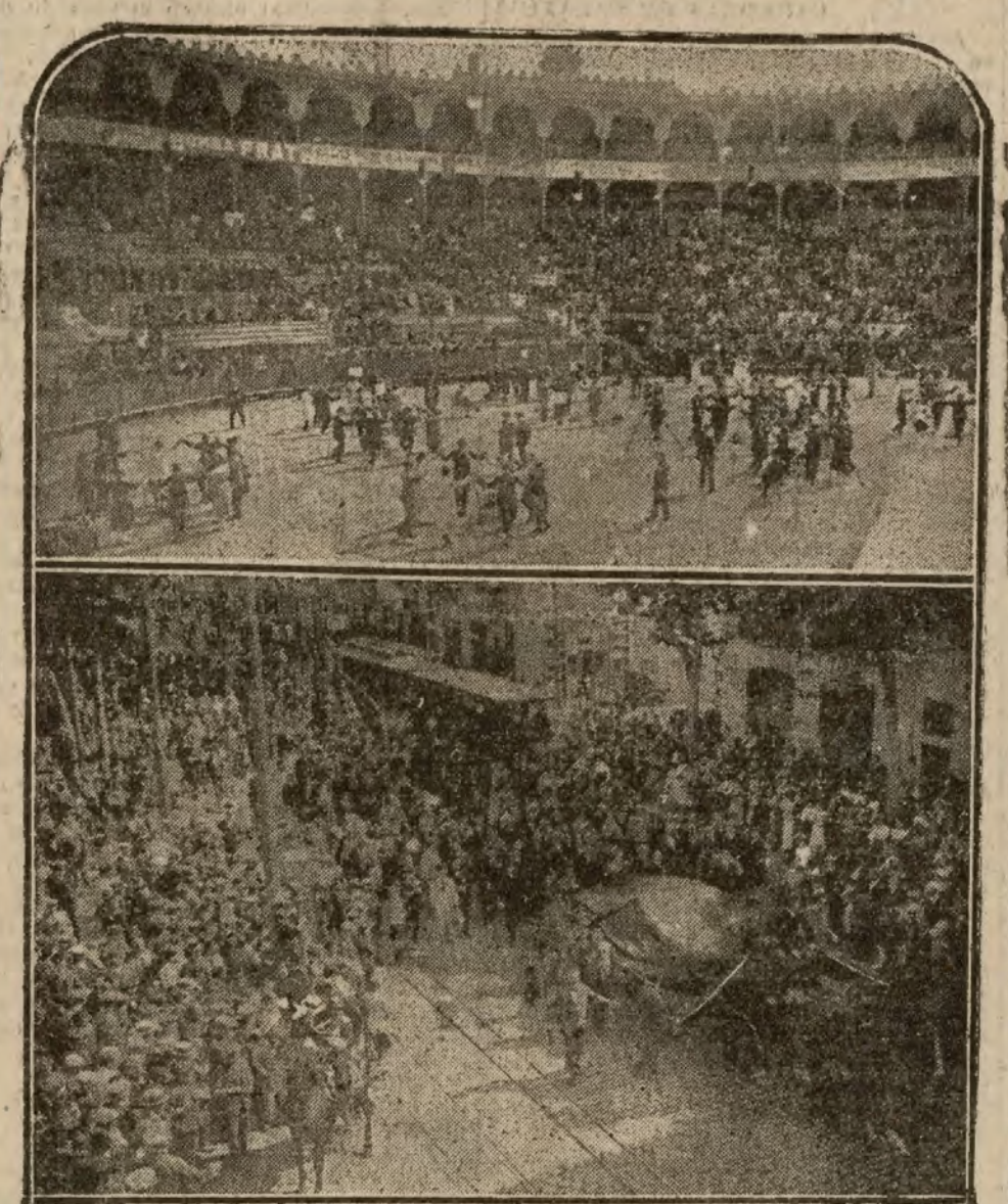
1 Concurso de sardanas celebrado en la Plaza de Toros de las Arenas para recaudar fondos destinados a la erección del monumento a Guimerá. — 2 Entrega de la bandera catalana regalada por suscripción popular a la tenencia de alcaldía del séptimo distrito