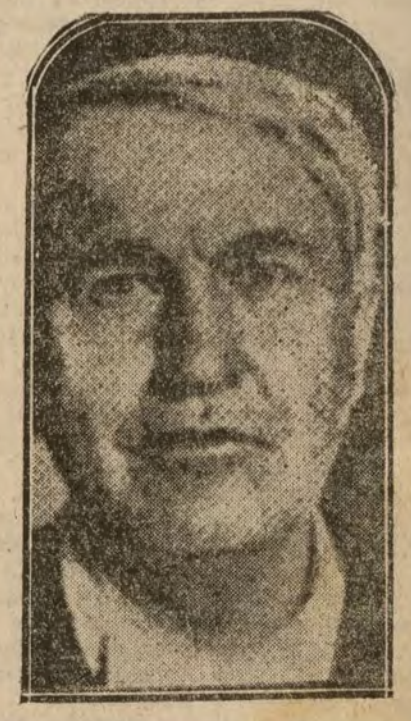
Thomas Edison, el célebre inventor que ha conmovido la opinión con el anuncio de un invento que permitiría comunicarse con el espíritu de los muertos

Berlín 6.—La "Gaceta de Voss" anuncia que la votación consultiva sobre la cuestión de la adhesión a la Tercera Internacional de Moscú ha dado los siguientes resultados entre los independientes: 15.500 votos se han emitido en favor y 13.600 en contra de la aceptación de las 21 condiciones bolcheviques. La participación en el escrutinio ha sido muy débil en el conjunto del gran Berlín. En algunos barrios ha alcanzado un 25 por 100. CUMPLIMIENTO DEL TRATADO DE VERSALLIES Berlín 6.—Con motivo de la disolución de las formaciones de Aviación y de Artillería, el general von Seeckt publica un orden del día, en la cual dice: "El mundo entero recuerda la técnica alemana, cuando los obreros las obras enemigas y cuando la artillería pesada bombardeó el campo atrinchado de París. La Aviación y la Artillería han prestado innumerales servicios, y tenemos la esperanza de resucitarlos."