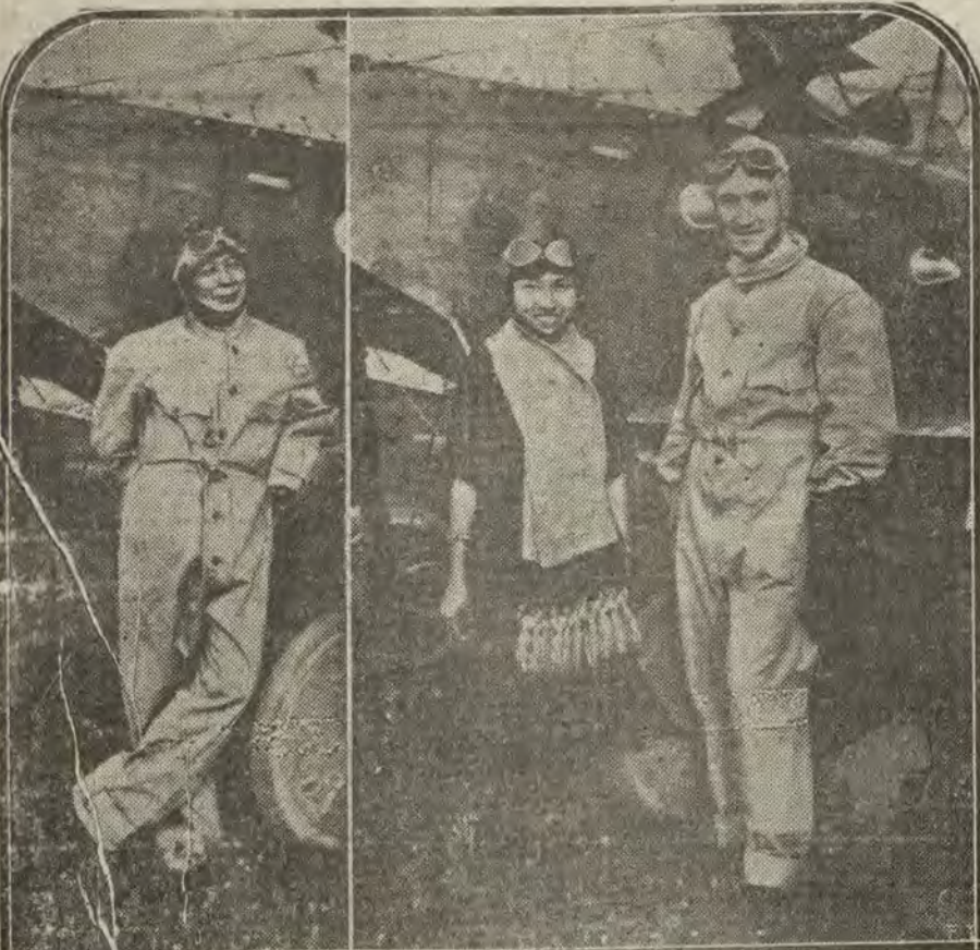
ITALIA.—Una misión italiana, que actualmente recorre Italia, ha querido experimentar las emociones de la aviación. El príncipe Parachatra del Kampyepetch y la princesa emprendieron el vuelo en el aparato pilotado por Cacteguone, mostrándose encantados de su peregrinación por las regiones aéreas.