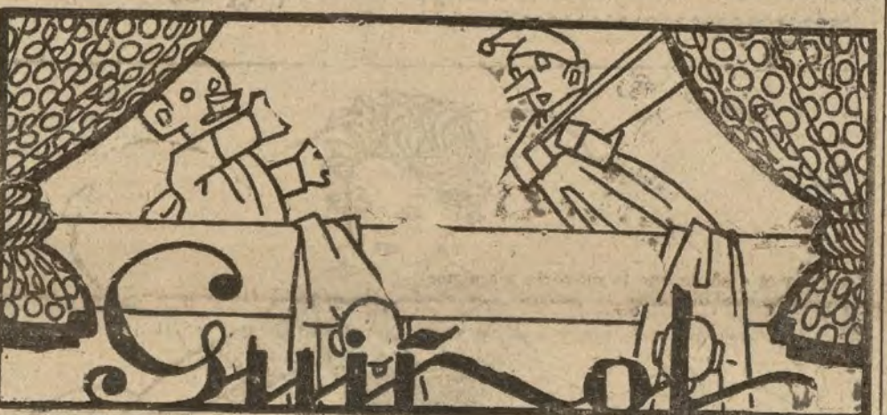
CRISTOBITA.—Hoy, 13, el santo de Dato.

Ha recibido el bautismo la hija de los duques de Hornachuelos, apadrinada por la marquesa de Fontalba y su hijo; la recién nacida, recibió el nombre de Almudena.