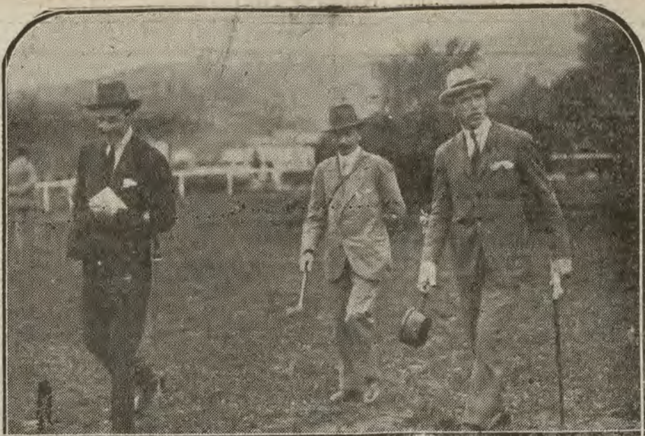
SAN SEBASTIAN.—El Rey paseando por el Hipódromo, la visita que hizo anteayer durante su estancia en la capital Guipuzcoana.