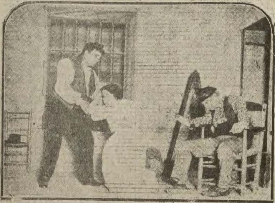
MADRID.—Una escena del drama "Pedro Fierro", que esta noche se representa la compañía de Enrique Borrás en el Teatro del Centro.