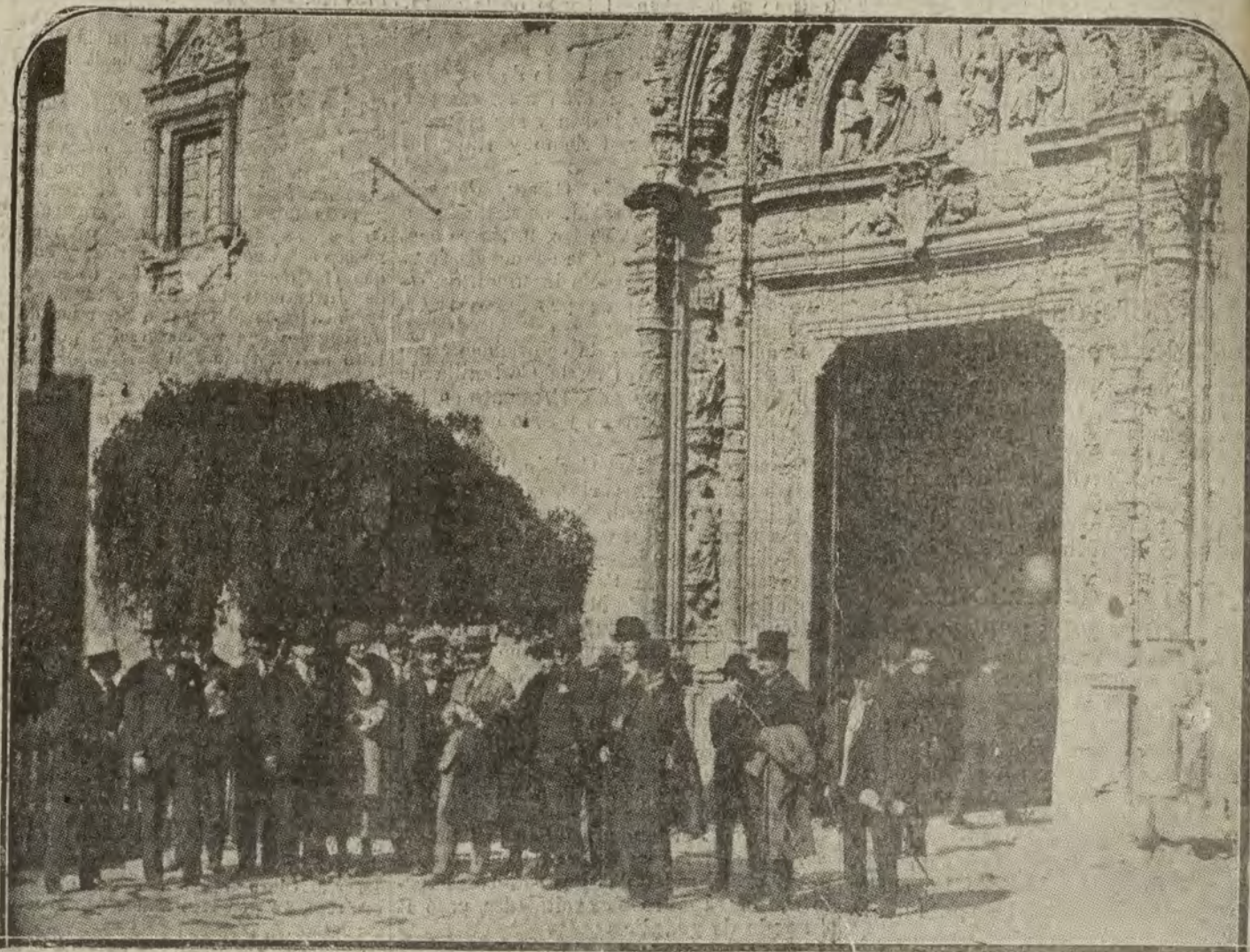
TOLEDO.—Los delegados del Congreso Roctar, que ayer visitaron la ciudad imperial, a la puerta de la Iglesia de Santa María la Blanca.