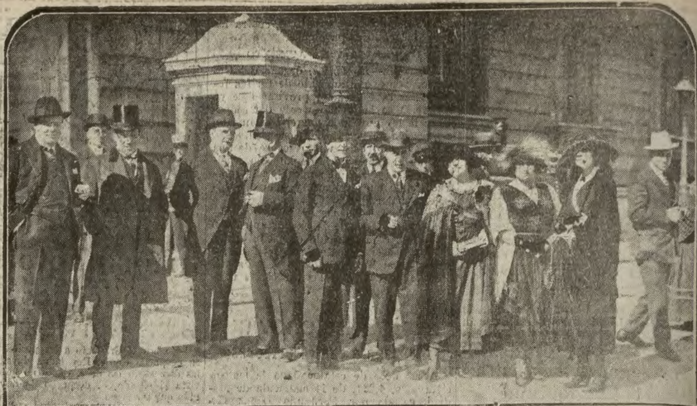
MADRID.—Comisión del Sindicato de Actores, al salir de Palacio de visitar a S. M. el Rey para invitarle a la función que van a celebrar en el Teatro del Centro, a beneficio de los niños de Riotinto.

El Centro de contratación de fincas rústicas y urbanas, Leguizos, 27, entre otros, participa a los propietarios que, entre otras condiciones, tienen a disposición para su colocación inmediata, las siguientes partidas: 200.000 pesetas para primera hipoteca; 30.000 para id. id.; 60.000 para segunda, y 10.000 para id. id. Horas, de 5 a 8.