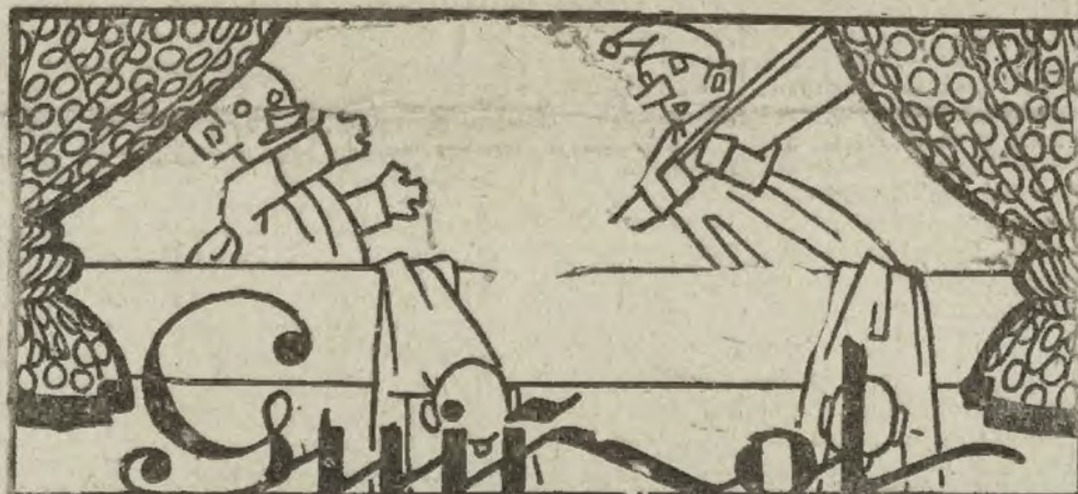
CRISTOBITA.—¿Has visto? Tienes juventud. CURRILLO.—Sí, sí... Lo que le falta es otra cosa.