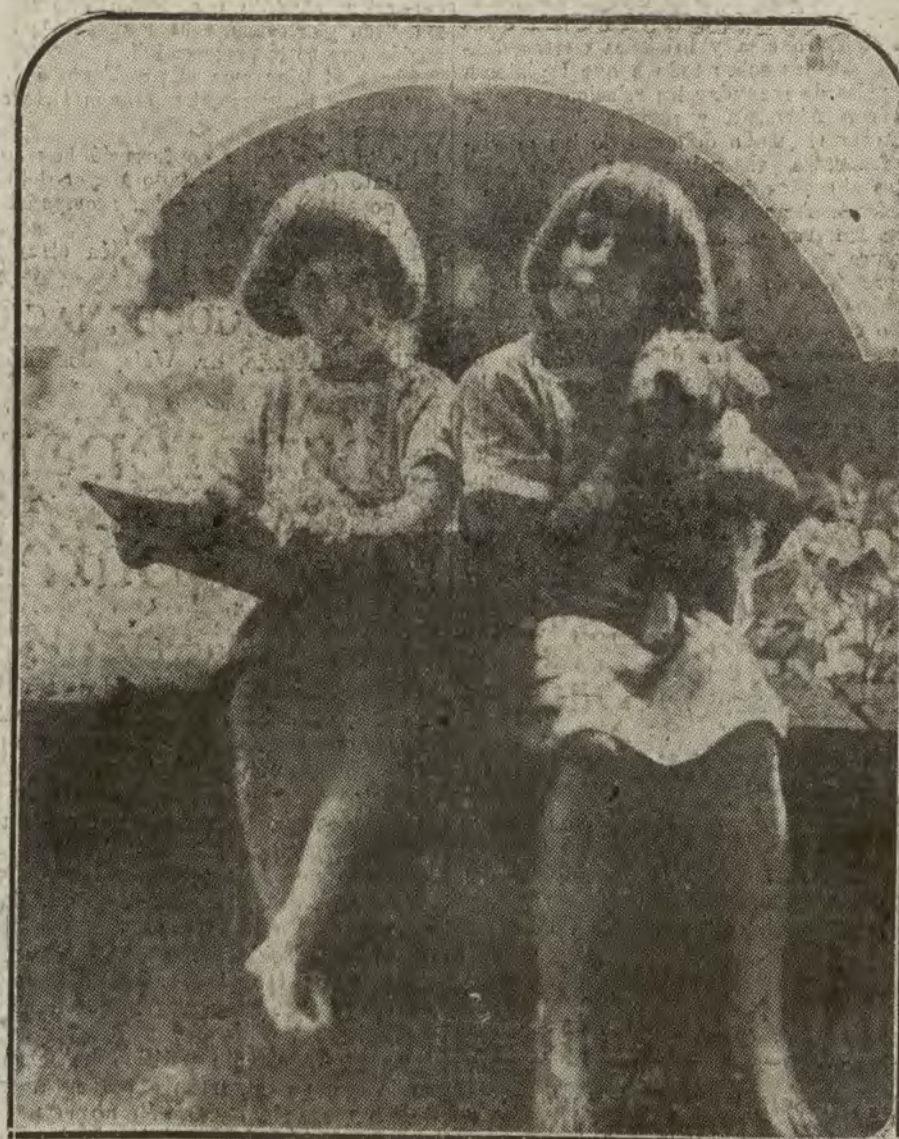
INGLATERRA.—Miguel y Nodia, los hijos del príncipe Miguel de Braganza que, acompañando a sus padres en el destierro, residen en Southampton

ESTUDIANTE en el último año de Derecho, joven, culto, desea colocarse en bufete o cargo análogo para terminar sus estudios. Razón en esta Redacción.