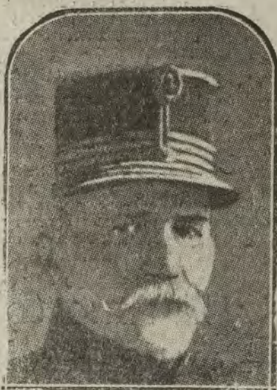
BELGICA.—El general Leman, defensor heroico de la plaza de Lieja, que acaba de fallecer en Bruselas.