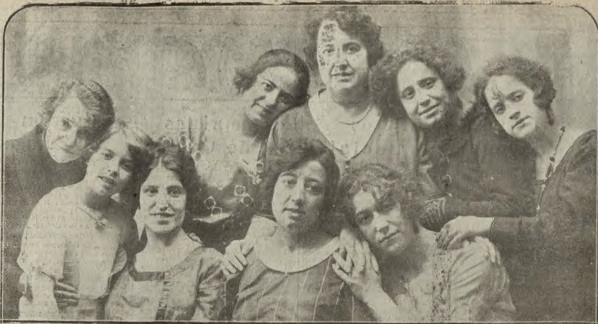
MADRID.—Las lindas muchachitas de "La Farandula", que realizan en el referido cuadro artístico una labor envidiable, reveladora de sus grandes condiciones para la escena