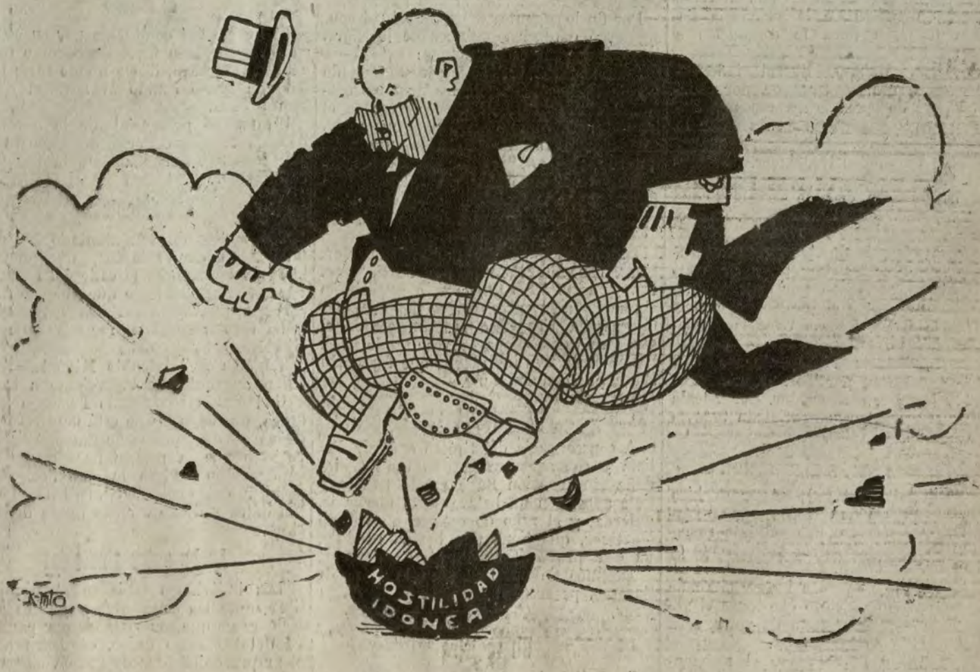
PARA DIPUTADOS A CORTES

—¿Por qué les llaman a ustedes la clase media? —Sencillamente, porque entre unos y otros nos parten ustedes por la mitad.