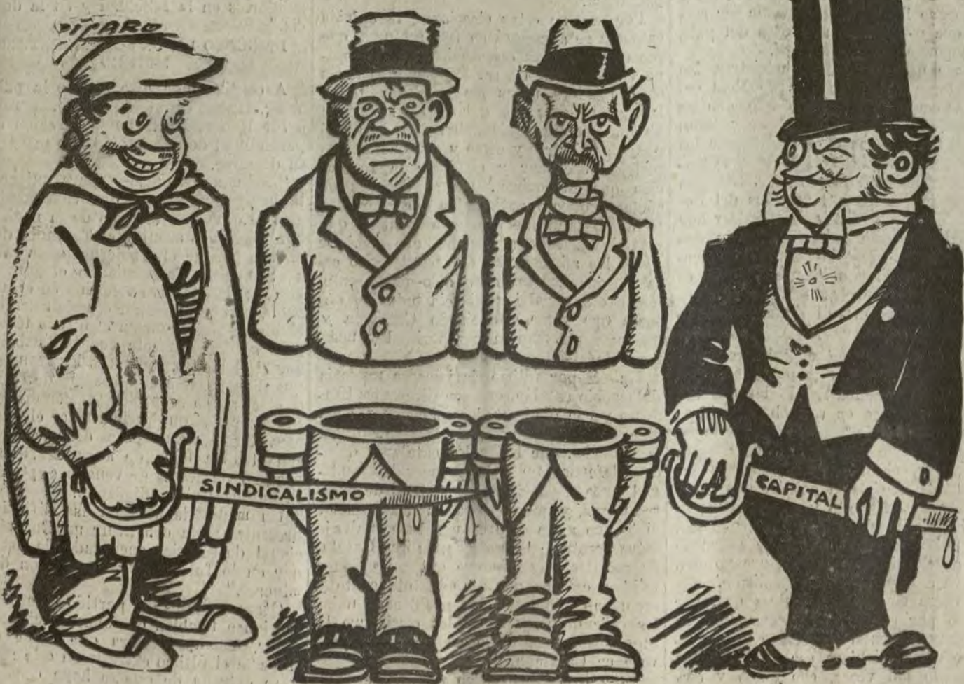
LAS CLASES SOCIALES

—¿Por qué les llaman a ustedes la clase media? —Sencillamente, porque entre unos y otros nos parten ustedes por la mitad.