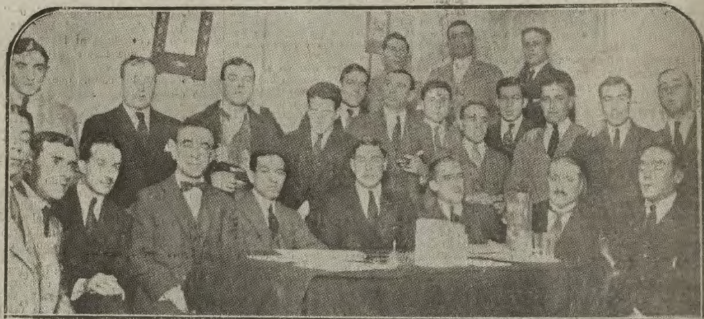
MADRID.—El torero Juan Belmonte, tomando posesión del cargo de presidente de la Asociación de Toreros