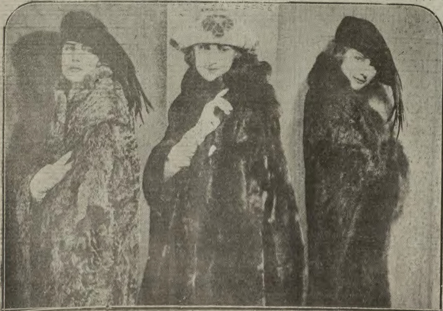
PARIS.—En los albores otoñales hacen su aparición en las carreras de Longchamps los primeros modelos de abrigos invernales y de pieles suntuosas.