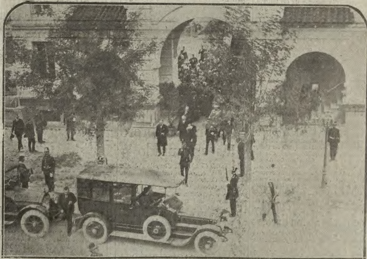
MADRID.—Los Reyes al salir ayer tarde de inaugurar el grupo de casas baratas "Reina Victoria", de la Cooperativa del ministerio de la Guerra.