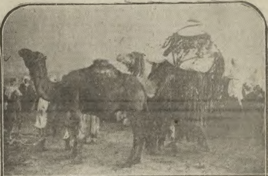
MELILLA.—Camello enjaezado a usanza moruna para transportar a una novia

Todos debéis pasear por entre sus 1.500 Stands