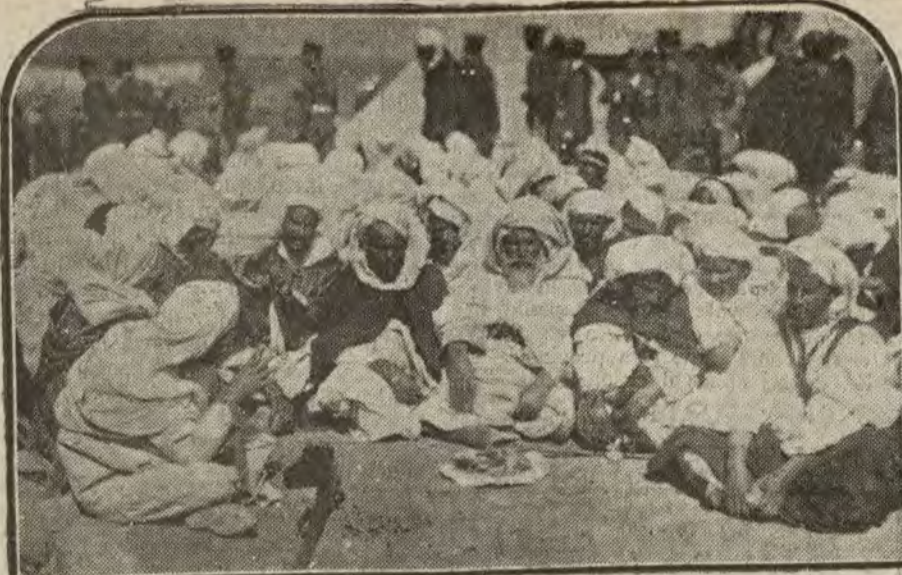
MELILLA.—Jefes de kabila, sentados delante de la tienda del coman- dante general en los postes del morabo de Sidi Ali Hasani

Concesionario: P. MARTINEZ OROZCO Plaza de Canalejas 6, primero