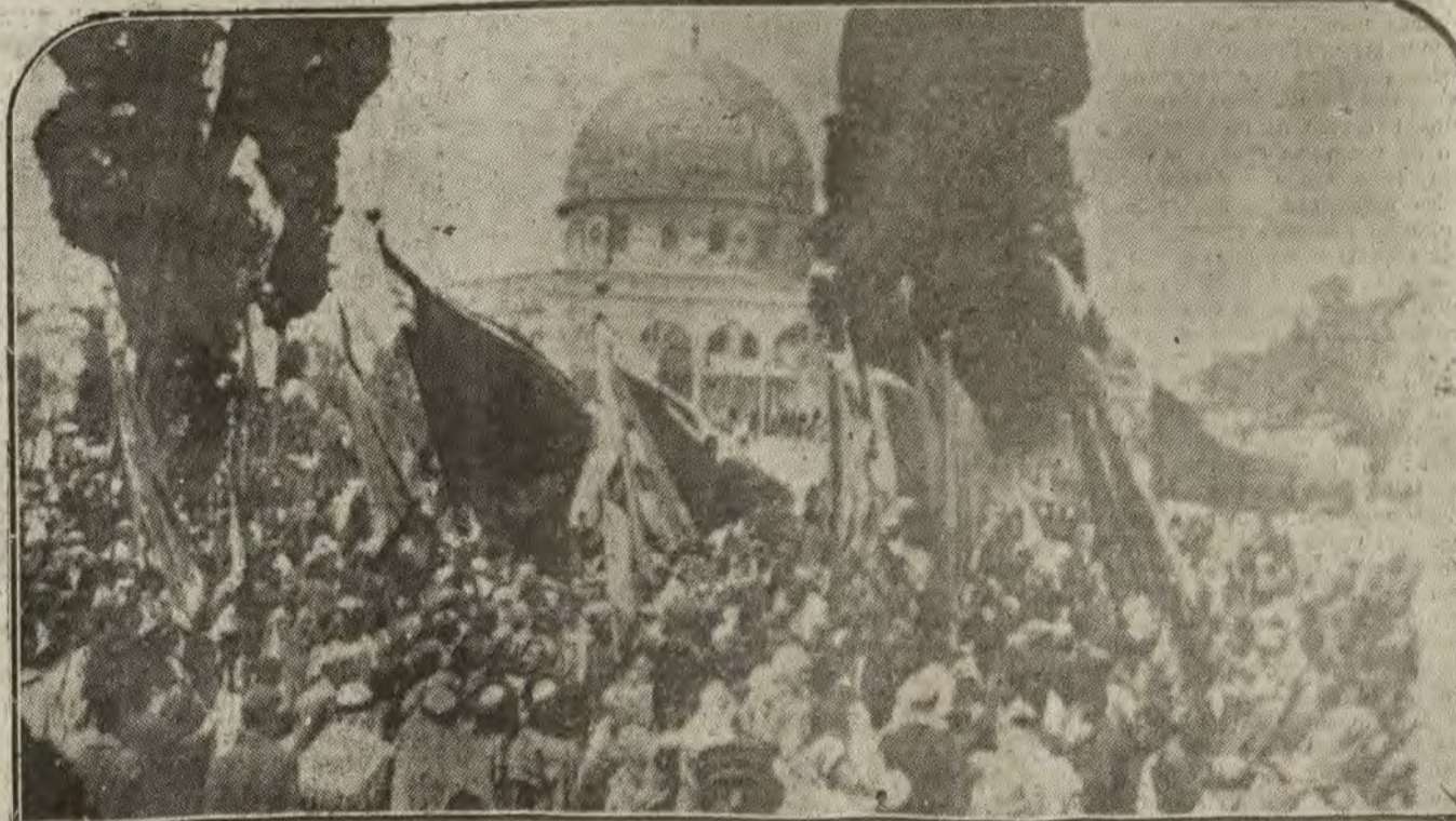
ARABIA.—Pueblos del Líbano celebrando en manifestación pública, con sus banderas, ante la tumba de sus heroes, la proclamación de autonomía a favor del Gran Líbano, por Inglaterra.

LA CASA MAS SURTIDA Y ECONOMICA EN GABANES CAMISERIA SANCHO. BORTALEZ A. 9