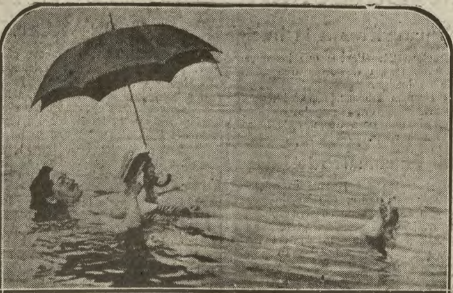
NUEVA YORK.—Una curiosa aplicación hidro-helio-terapia. Baños de mar y sol combinados, procedimiento del doctor Main, que el paciente hace más tolerable protegiendo su cabeza del sol y leyendo gratamen- te en la hora del baño