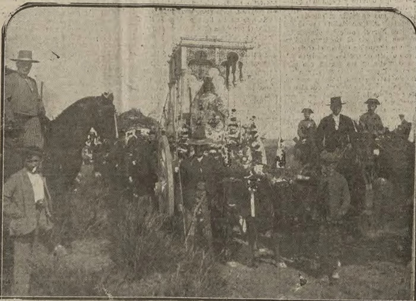
SEVILLA.—Llegada de Nuestra Señora de los Reyes al Cortijo de Cuarto, durante la Romería de Valmas, celebrada en los pasados días.