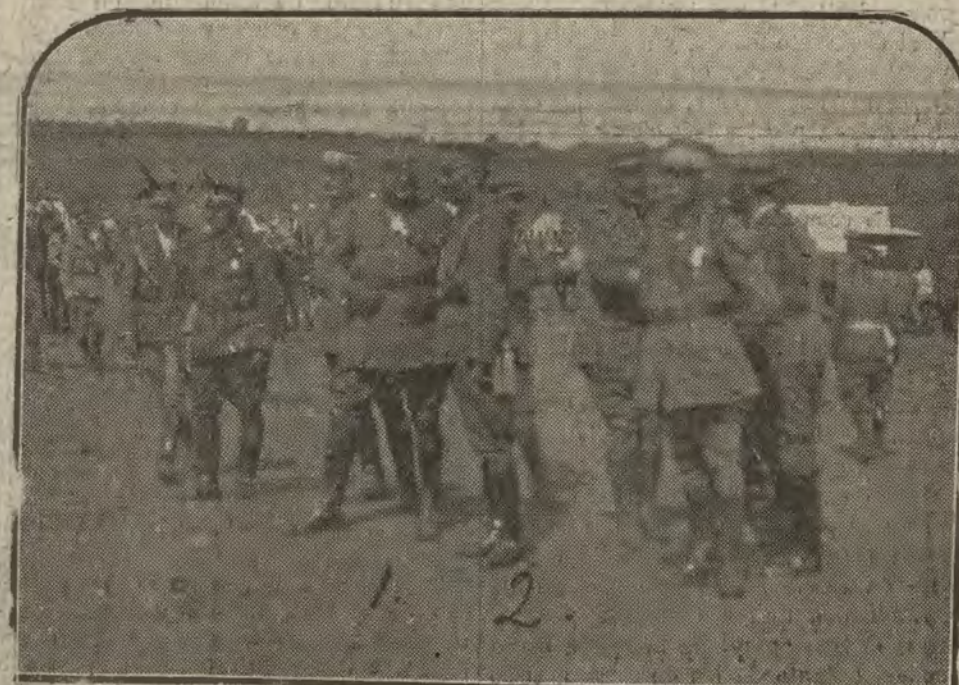
MARRUECOS.—El general francés Poeymirau (1) y el comandante general de Larachie, Sr. Barriera (2) contemplando desde el campamento español de Teffer las últimas posiciones ocupadas.