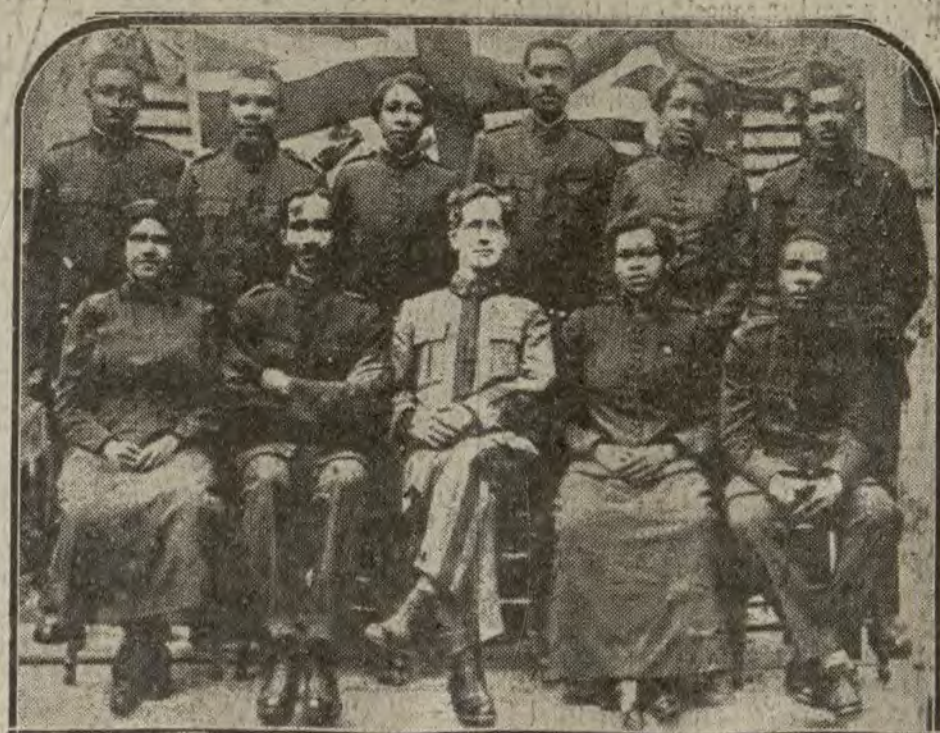
AFRICA.—El comité de investigación creado en Jamaica, bajo la presidencia del coronel del ejército inglés Horskin, para la investigación de las reclamaciones de los indígenas.

IZQUIERDAS y derechos están de acuerdo en que los preservativos que vende "La Mascota" son inmejorables. GATO 4.—Gratias a todos.