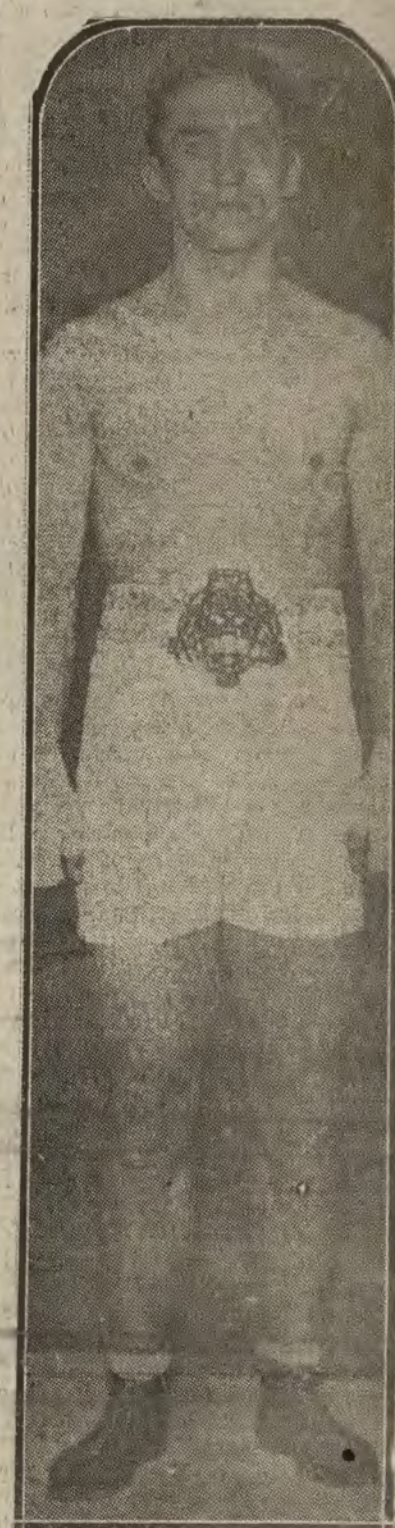
NUEVA YORK.—Georges Carpentier, celebre boxeador francés, que ha ganado en Norteamérica el campeonato del mundo.