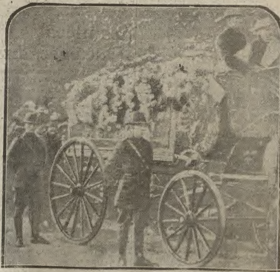
IRLANDA.—El féretro, escoltado por los voluntarios irlandeses y seguido de una enorme multitud.