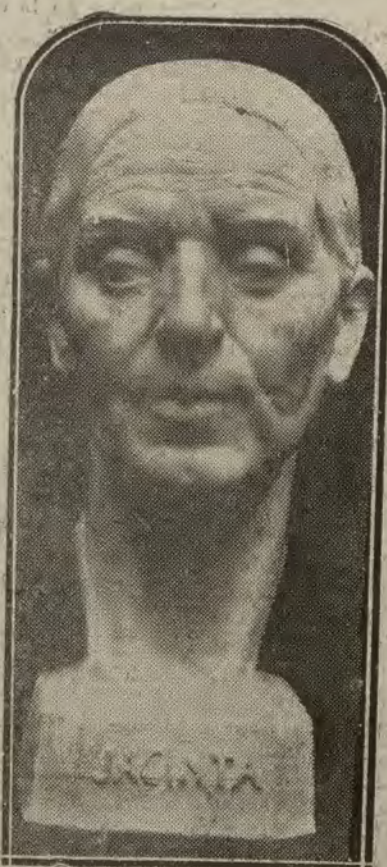
MADRID.—En el salón de Otoño. «Adolescente» y «Jacinta», dos obras notables del joven escultor Ignacio López Gómez, que han sido muy elogiadas por la crítica.