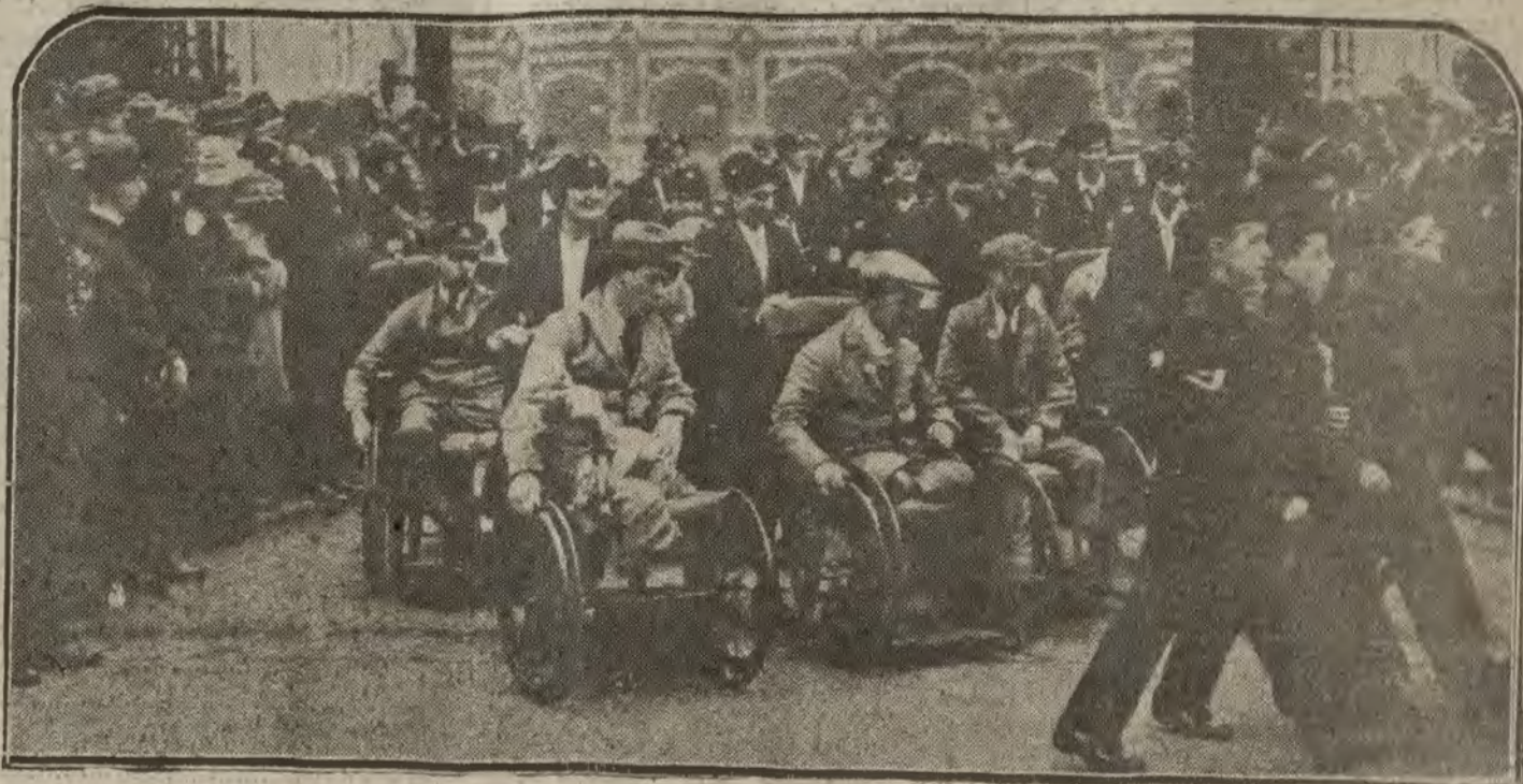
LONDRES.—Una manifestación de mutilados de la guerra, dirigiéndose a Westminster

TELEGRAFOS Academia "Canal de Rueda". Jefe Palacio Comunicaciones, LUNA, 22.