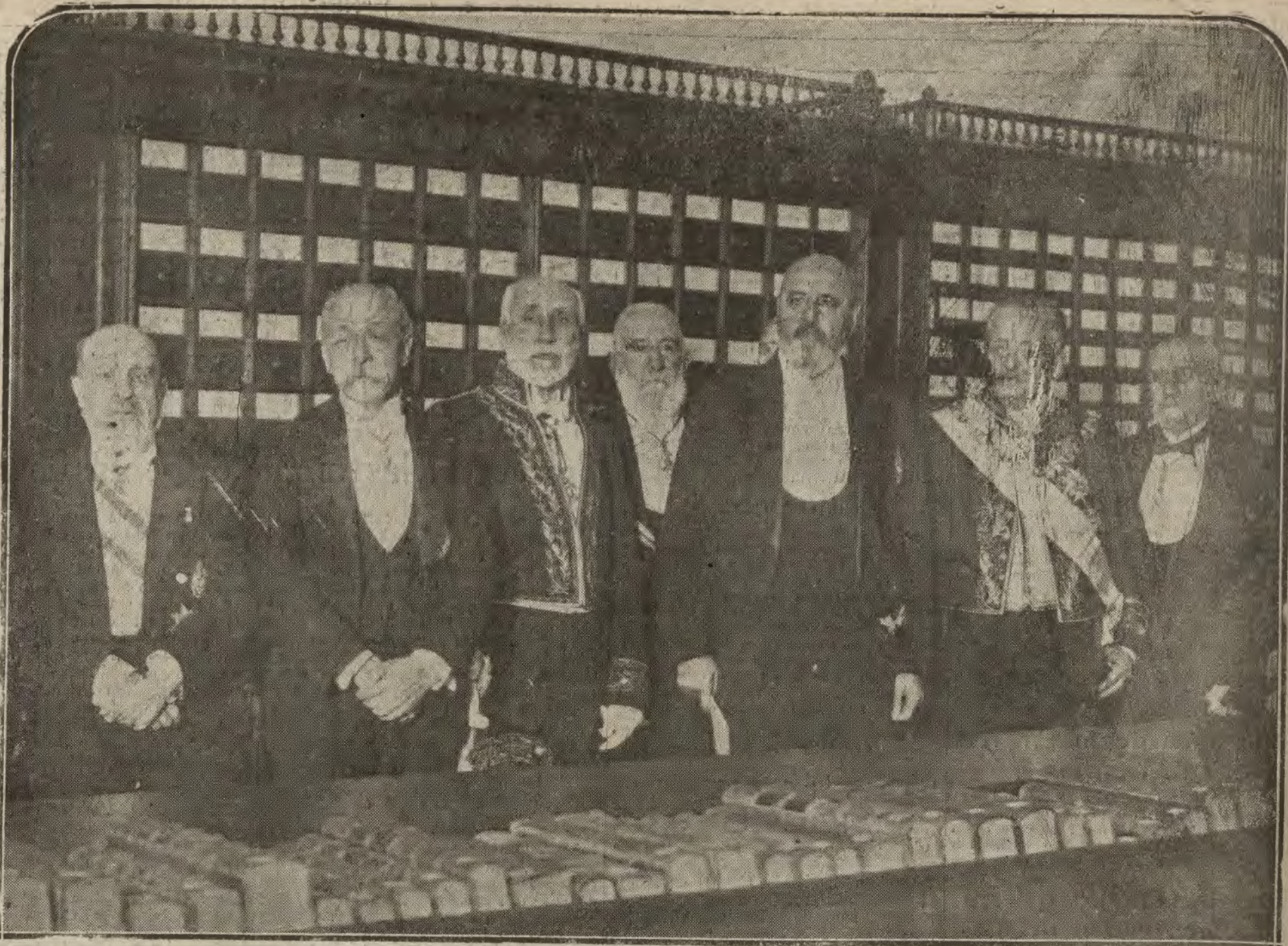
MADRID.—El ilustre ingeniero D. Leonardo Torres Quevedo, después de su recepción verificada ayer en la Academia de la Lengua.