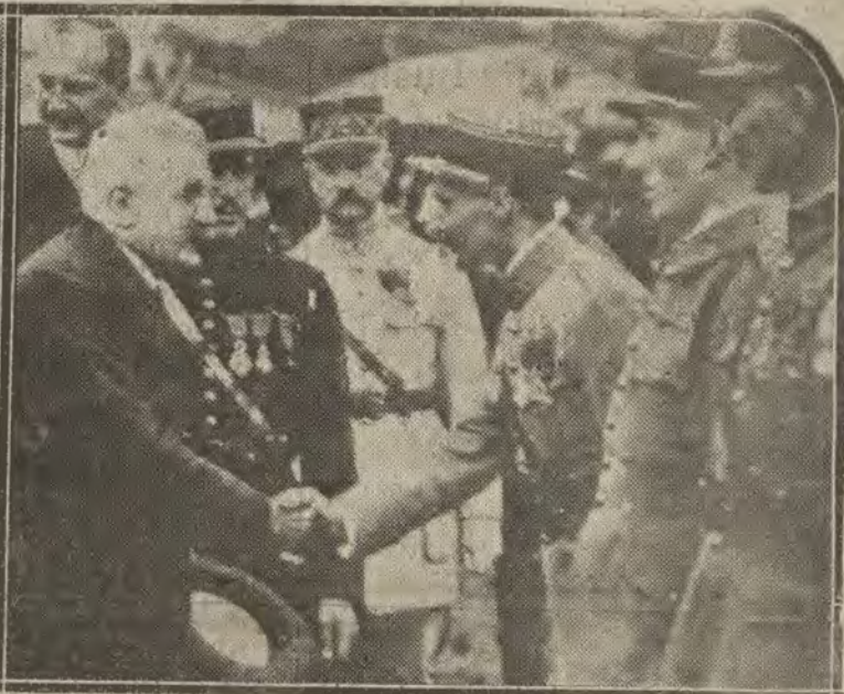
PARIS.—1 Los cien aeroplanos que Francia dedicará a la aviación comercial, reunidos en el Aerodromo Buc.—2 El Presidente de la República saludando a los pilotos militares encargados de esta organización.