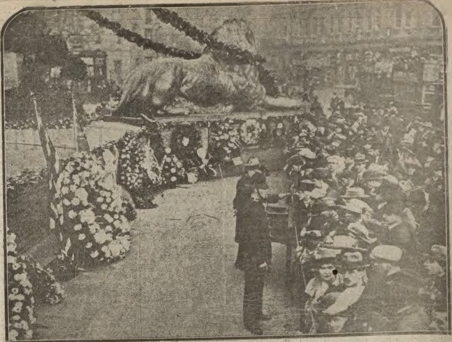
LONDRES.—La conmemoración de la batalla de Trafalgar en Nelson Square.