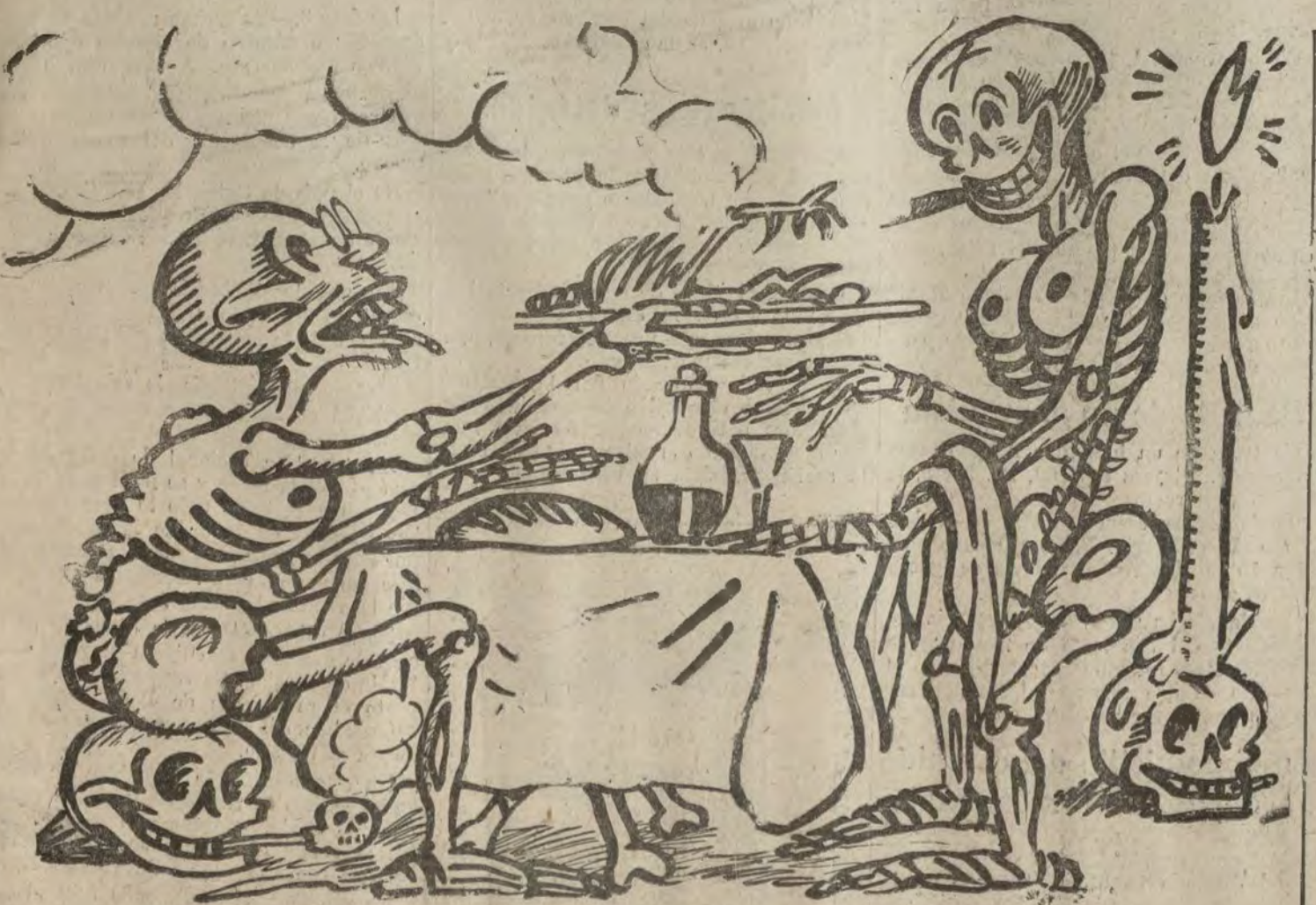
PLATO DEL DIA

—Roma, torpe. No ves que en esta carne todo son huesos.