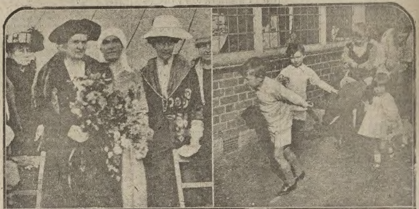
LONDRES.—1 La inauguración del Colegio especial creado por Inglaterra para los huérfanos de militares muertos en la guerra europea.—2 Un aspecto del jardín destinado a los pequeños.