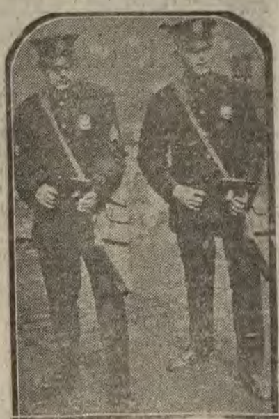
NUEVA YORK.—El nuevo armamento policiaco; los policamens americanos se hallan provistos de unas pistolas con cargadpnes especiales que pueden disparar mil quinientos tiros por minuto.

LA JAPONESA Preservativos San Cristóbal, 2, esquina a Mayor Regalo de postales.