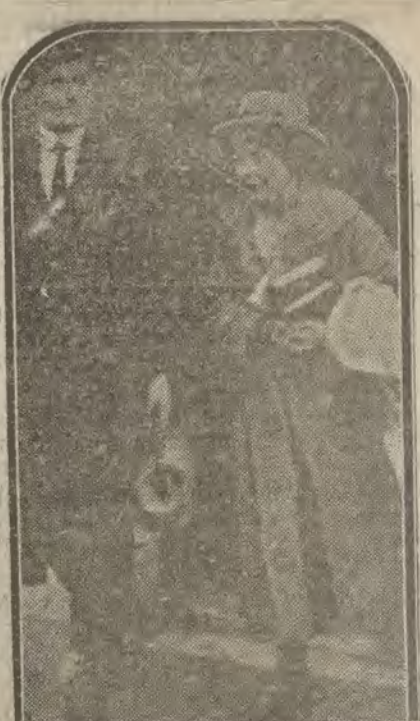
LONDRES.—Miss Sylvia Pankurst, detenida por la Policía inglesa a su salida de la estación, acusada de realizar propaganda comunista.