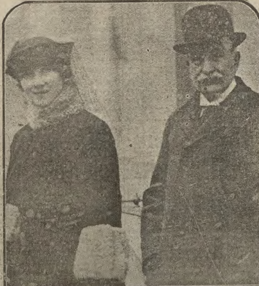
RUMANIA.—El ministro de Estado Také Jonescu, enviado a Inglaterra como representante de su país, antes de salir para Londres en compañía de su esposa.