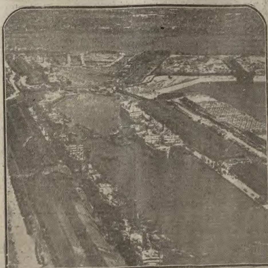
LONDRES.—Los grandes Docks del Rey Alberto que acaban de ser ampliados en grande extensión.

LA JAPONESA Preservativos San Cristóbal, 2, esquina a Mayor Regalo de postales.