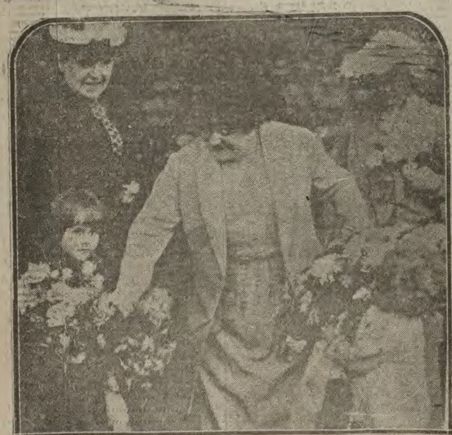
NUEVA YORK.—La cantante E. Tetranini, es objeto de una entusiasta despedida al abandonar la capital norteamericana donde ha dado una serie de conciertos.