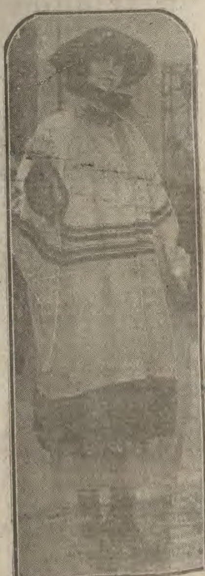
PARIS.—Las modas de Oran. Una elegante y cómoda salida de mañana.