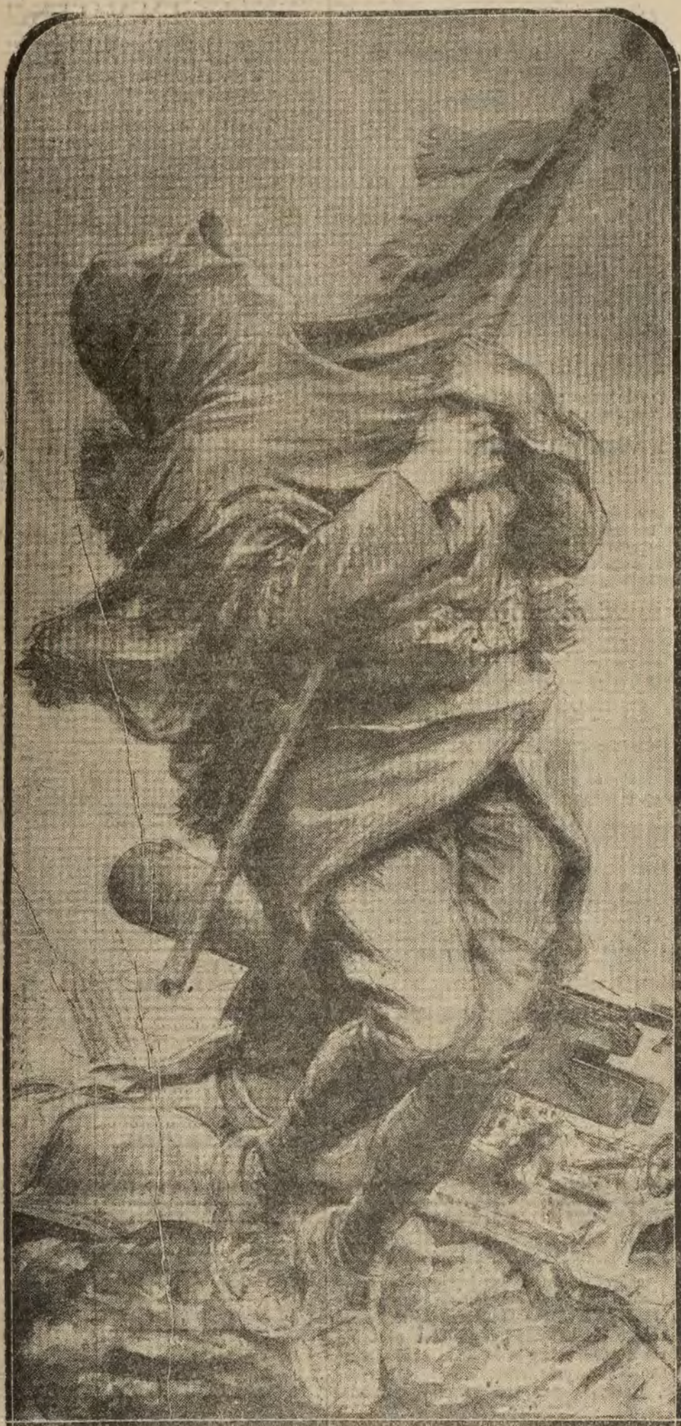
PARIS.—El monumento al soldado anónimo, por Sabatier. Las líneas de la faz desconocida que cubren los pliegues de la bandera evocarán en todos los franceses que dieron un dedo a la Patria el rostro del ser querido y este bello, y sencillo monumento anónimo será la evocación constante de todos los sacrificios.