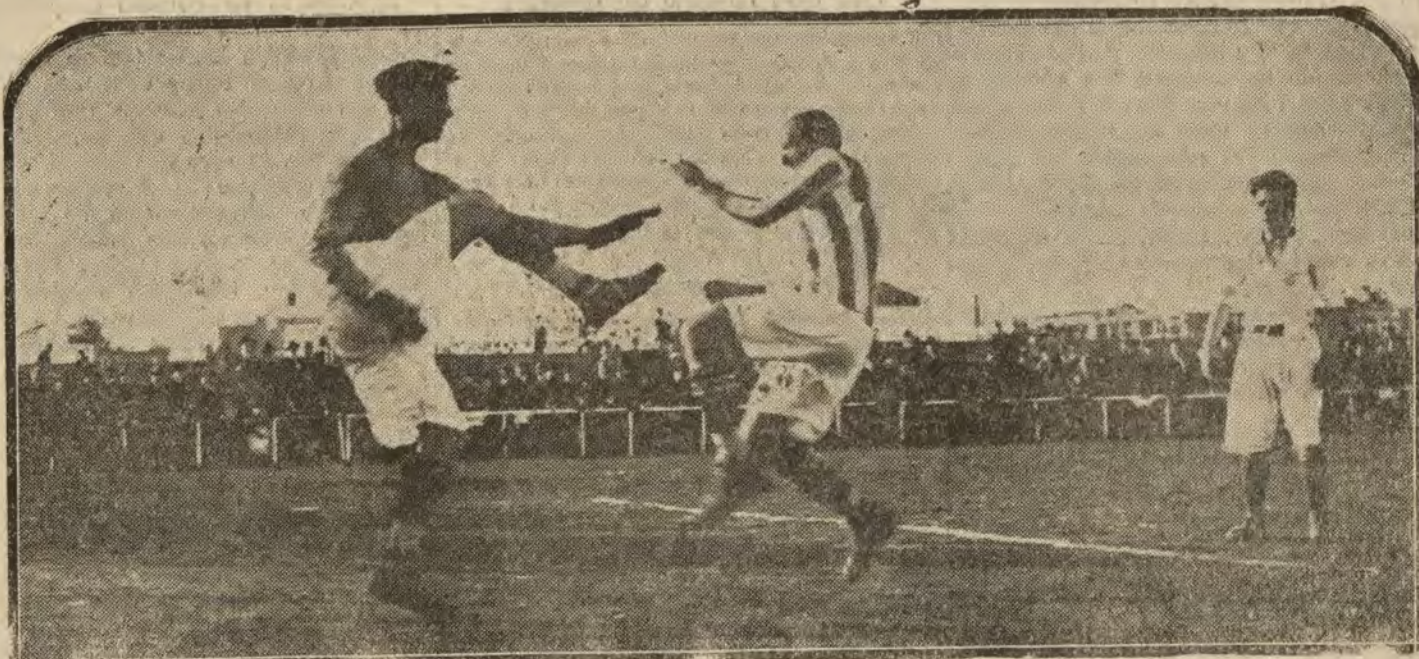
SEVILLA.—Un momento interesante del partido de «foot-ball», jugado por los equipos Sevilla F. C. y Real Betis Balompé.