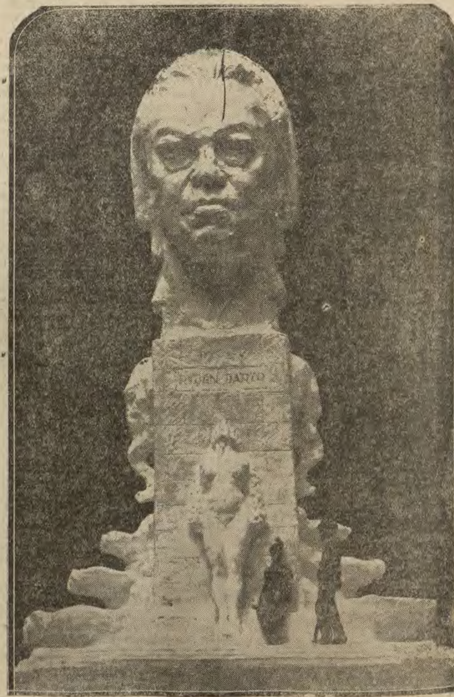
MADRID.—Proyecto de monumento a Rubén Darío, original del ilustre escultor señor Lozano.

NO LO OLVIDE 5 PRECIOSAS POSTALES 60 CENTIMOS