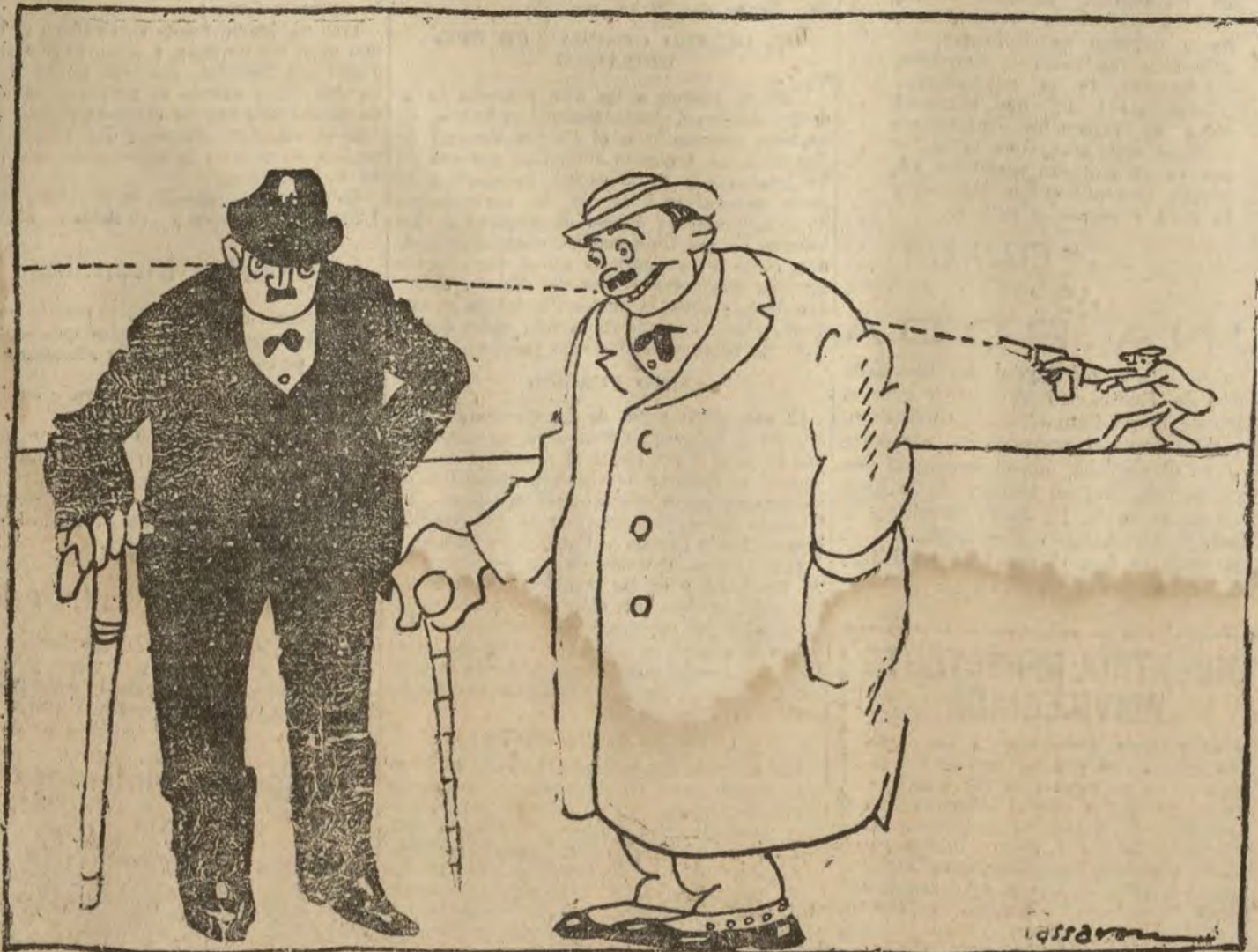
EL PROYECTO DE DEFENSA DE BARCELONA

—Tú vas a ver; en cuanto que se aplique el proyecto no va a quedar jirte con cabeza