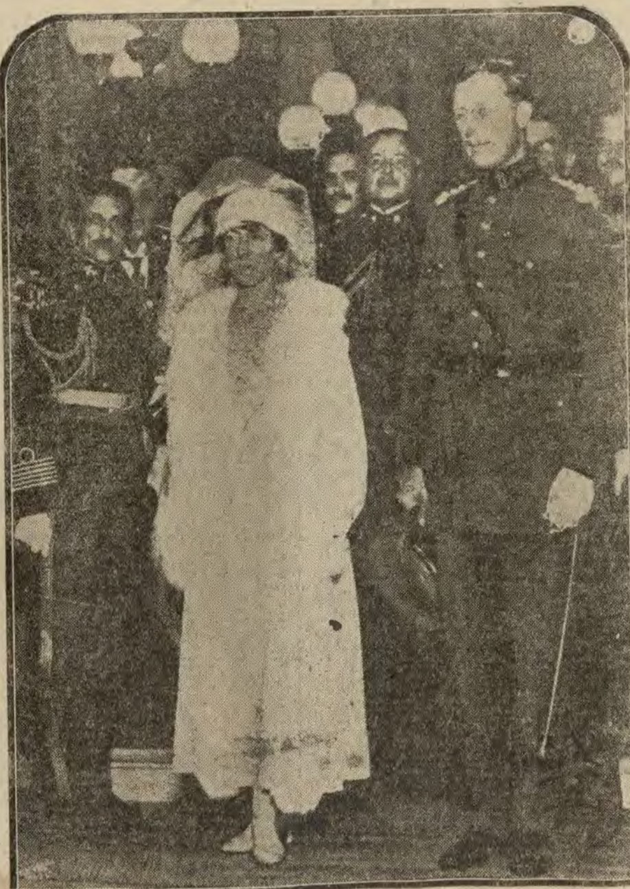
BRASIL.—Los Reyes de Bélgica a su llegada a Rio Janeiro, donde fueron recibidos por el Presidente Epitaco Pessoa.

HIPON o FOTOGRAFO TELÉFONO 2609 FUENCARRAL, MADRID