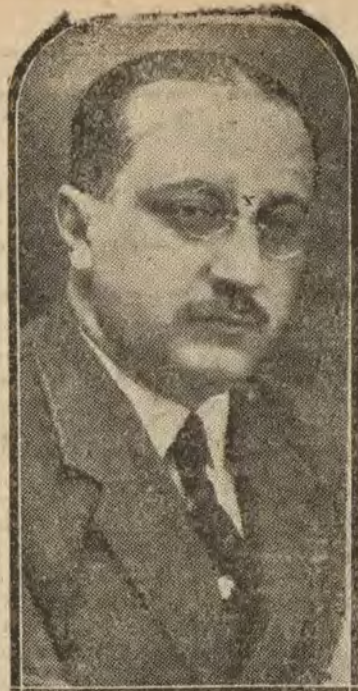
MADRID.—José Francés, distinguido escritor autor de la novela «La mujer de nadie», que está obteniendo un éxito resonante.