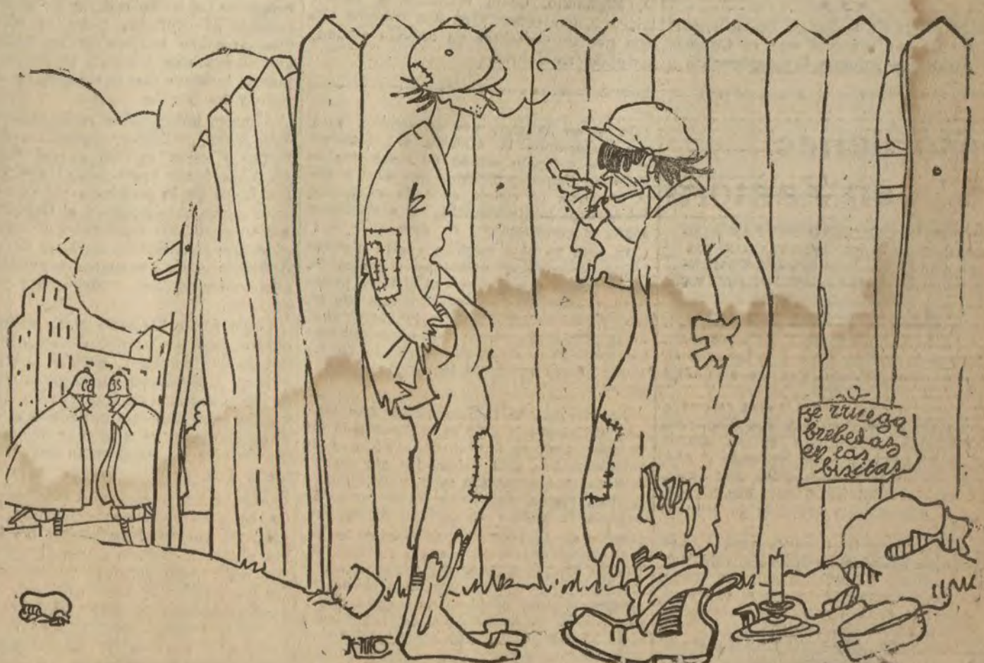
LOS GUARDIAS DE SEGURIDAD

—Tú vas a ver; en cuanto que se aplique el proyecto no va a quedar jirte con cabeza