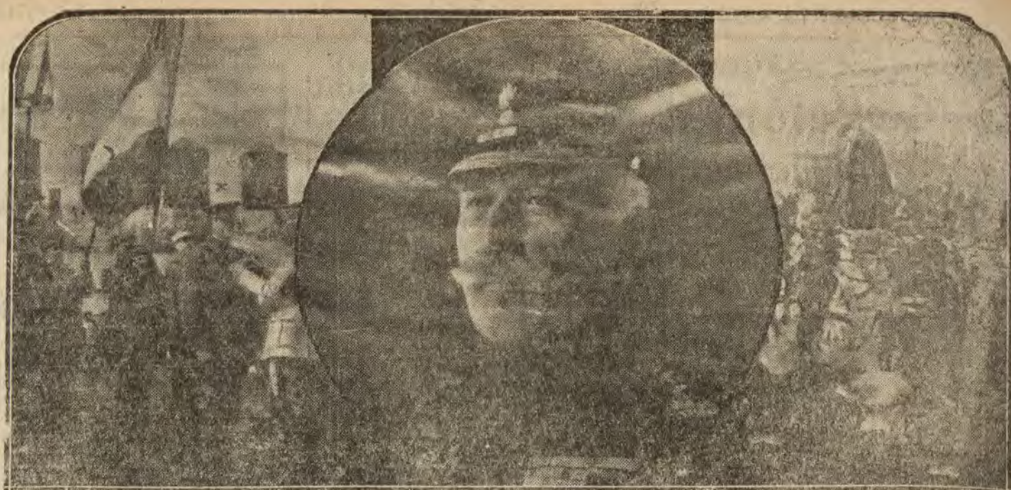
INGLATERRA.—La agitación nacionalista en la India.—1 El comandante general de las fuerzas inglesas en Bombay, condecorando a los oficiales.—2 El duque de Connaught, que ha visitado recientemente las principales capitales de la India inglesa.—3 La requisa de armas en Bombay.