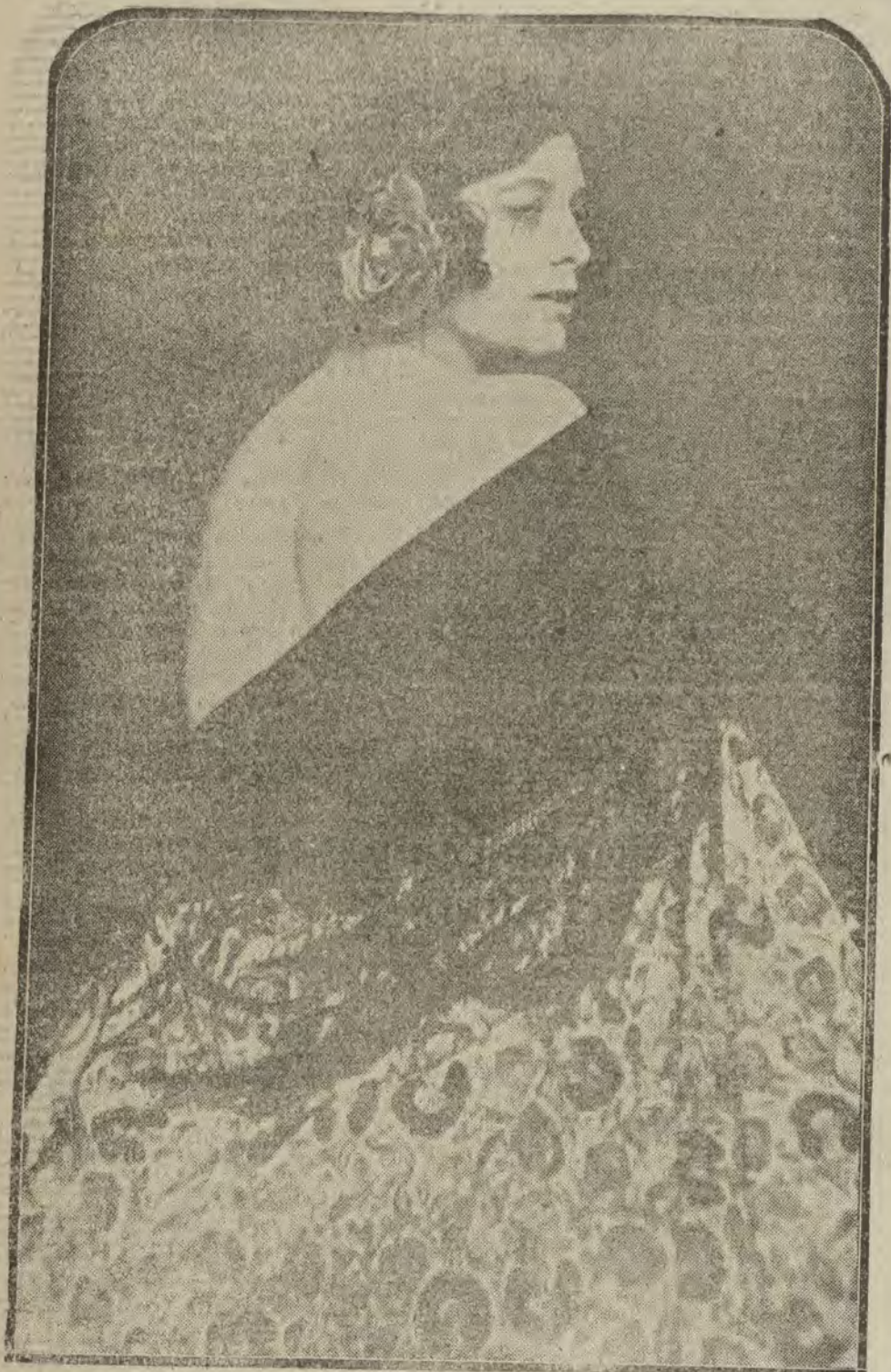
PARIS.—Rosita, célebre bailarina española, que ha conquistado a Europa con sus notables bailes ibéricos.

TEATRO DE LA ZARZUELA SEGUNDO BAILE DE MASCARAS MAÑANA SABADO, DIA 13