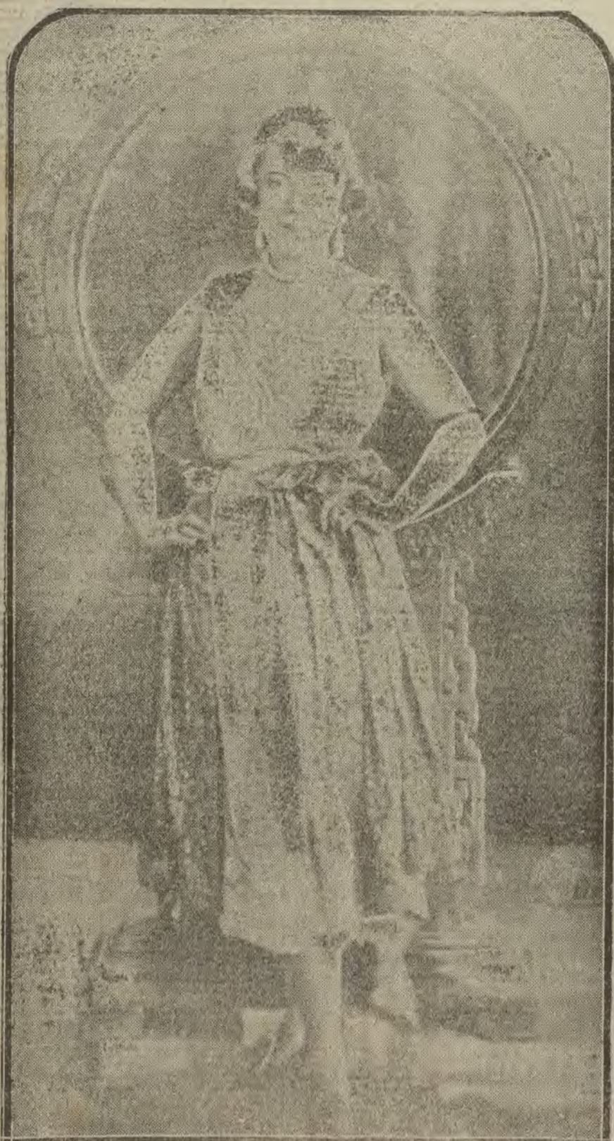
NUEVA YORK.—Mlle. Spinsky, gran actriz cómica del teatro francés, que realiza una tournée por Europa y visitará España el próximo invierno.

TEATRO DE LA ZARZUELA SEGUNDO BAILE DE MASCARAS MAÑANA SABADO, DIA 13