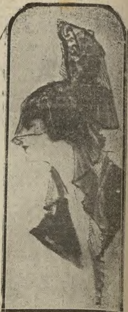
PARIS.—La moda española. Los sombreros de invierno adoptan en muchos modelos la forma de la mantilla española.