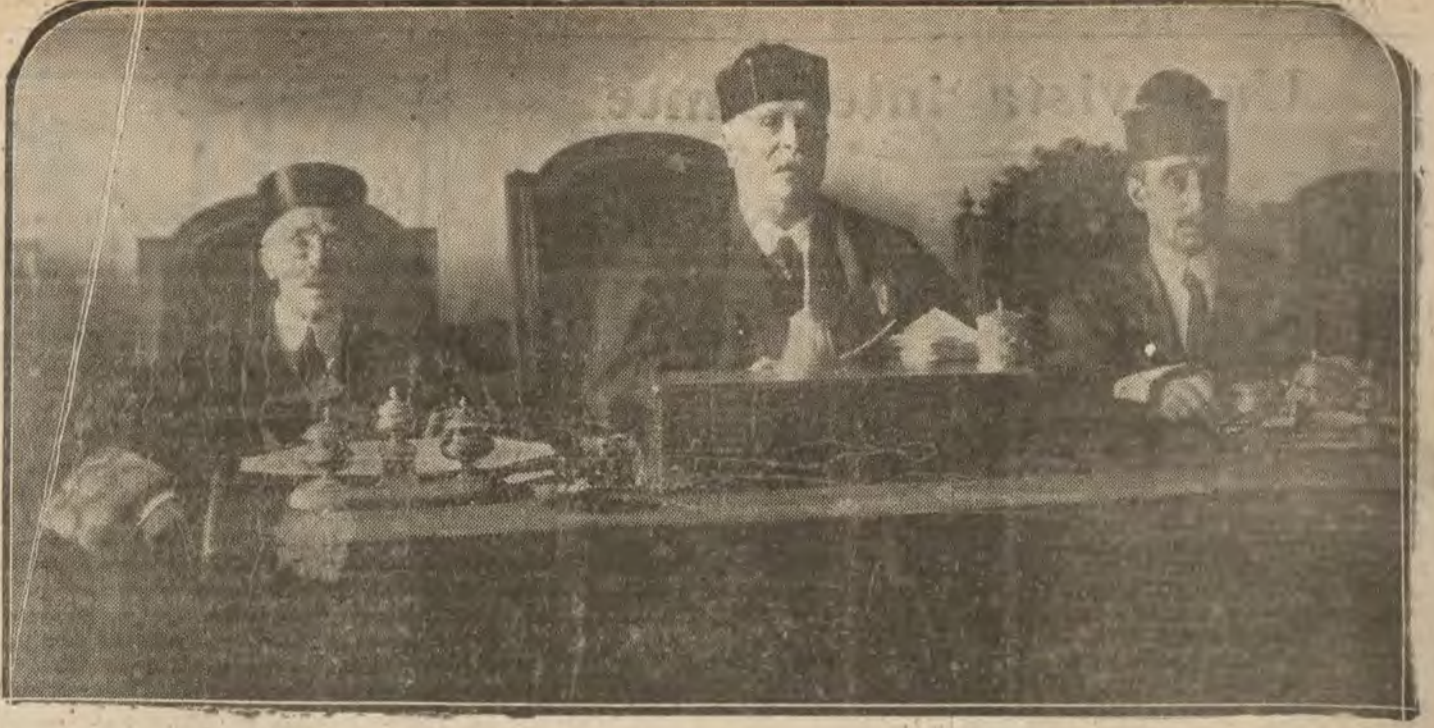
MADRID.—Del robo del Museo. La presidencia del Tribunal.

PRESERVATIVOS de señoras y caballeros "Hungers". Libros postales. Catálogo gratis NEVERRIP, TETUAN, 42. Los mejores preservativos LA JAPONESA: SAN CRISTOBAL, 2 (esquina a Mayor, frente Tournié)