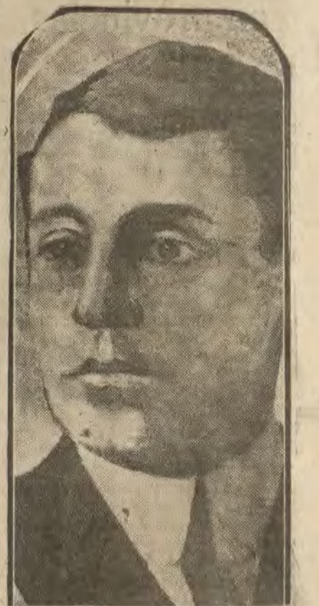
CHILE.—D. Arturo Alessandri, nuevo presidente de la república

Certificados penales en veinticuatro horas; 5 pesetas incluidos todos los gastos. Certificados última voluntad, 6 pesetas. Al hacer el pedido remitase importe por Giro Postal. HUMELLADERO, 2. PRAL. MADRID