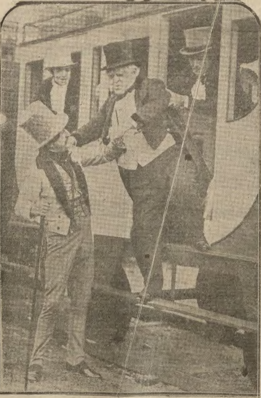
ITALIA.—Película curiosa. Una de las escenas de la película «Historia de los medios de locomoción».

Vendemos para todos los puntos de España Solicítense catálogos, que enviaremos gratis, dirigiéndose a ODEON, Preciados, 1. MADRID