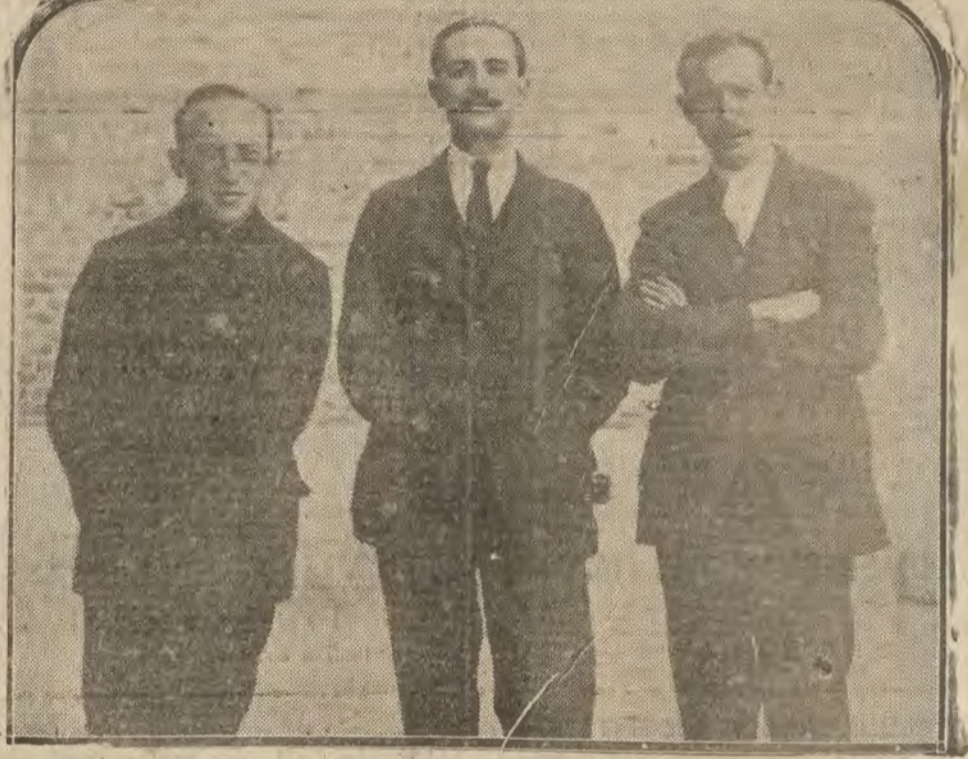
MADRID.—Del robo del Museo. Tres de los procesados en la cárcel.