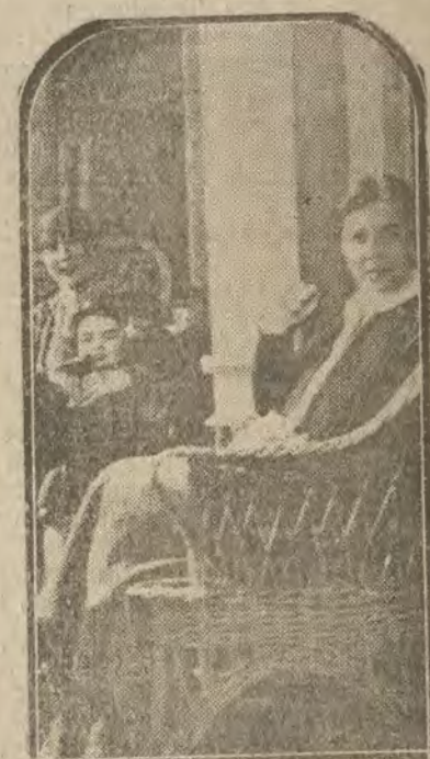
LONDRES.—Una escuela de «nurses» inglesas. Algunas de las futuras guías y educadoras de los «bambys».