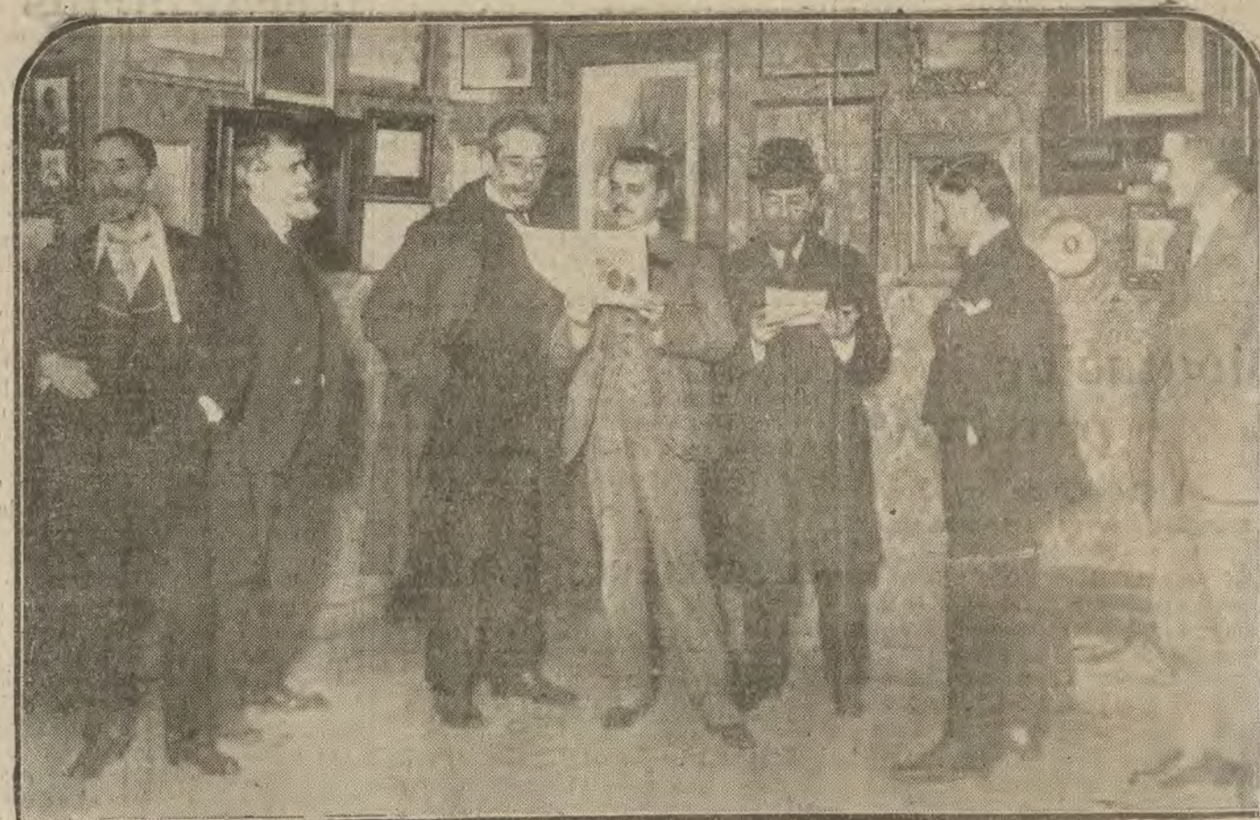
MADRID.—Aspecto de la Exposición de dibujos íntimos, inaugurada ayer en el salón permanente del Círculo de Bellas Artes.