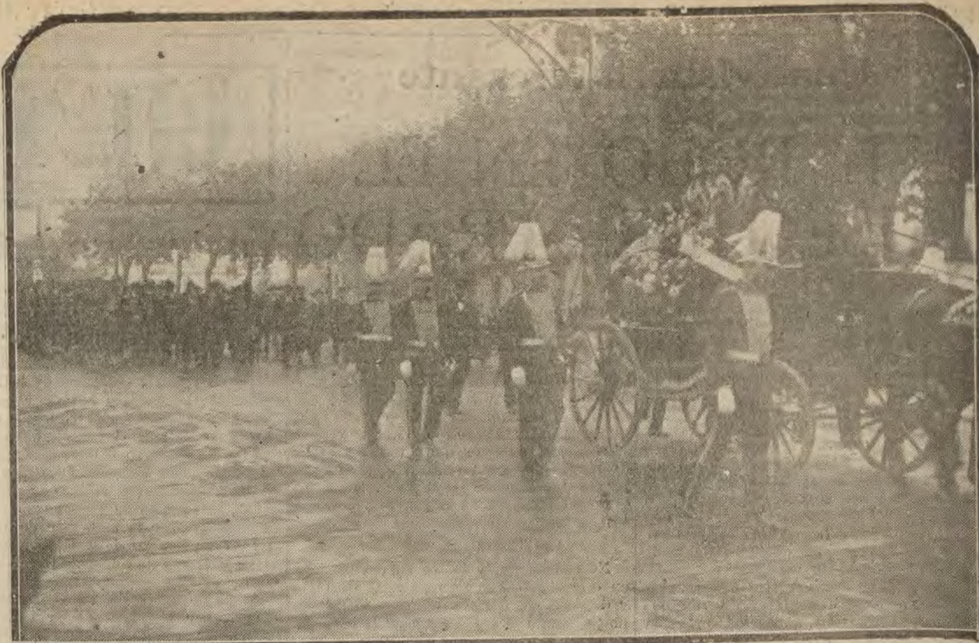
BARCELONA.—El entierro del ilustre literato Pompeyo Gener, a su paso por el paseo de Gracia.