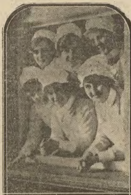
CONSTANTINOPLA.—En gradas rusas, procedentes de las más elevadas clases sociales, que lograron salvar su persona e intereses, y permanecer alejadas del bolcheviquismo.