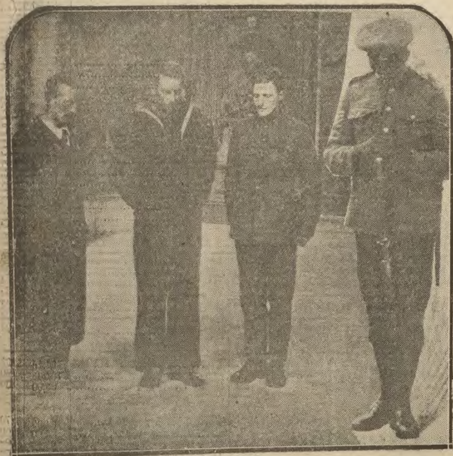
LONDRES.—Dos minutos de silencio en honor a los muertos. Detalle de esta piadosa conmemoración en Londres, el aniversario del armisticio. A la izquierda, grupo de turistas que visitaban una iglesia. A la derecha, soldado de guardia en el real palacio.