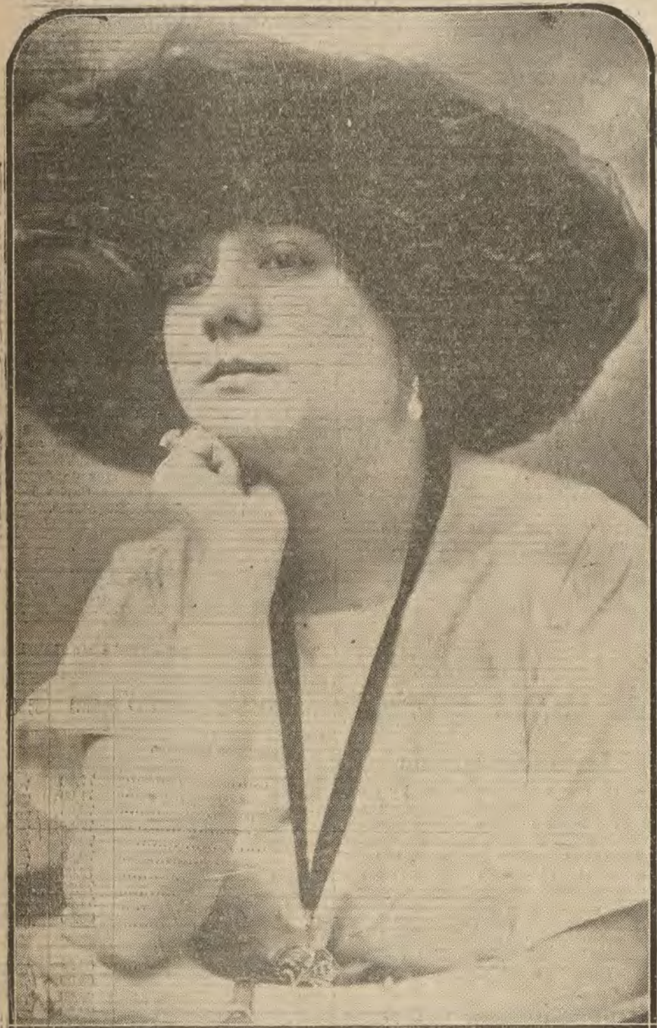
MADRID.—La celebrada y bella coupletista «Musseta», que le obtiene grandes éxitos.