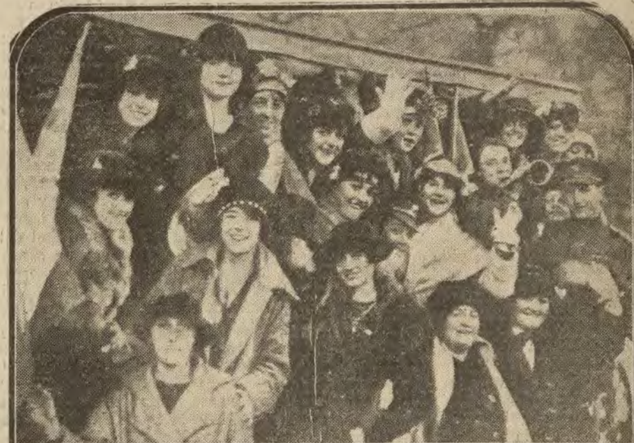
PARIS.—Uno de los equipos femeninos de «foot-ball», ingleses, que ha llegado a París para tomar parte en un campeonato sensacional.