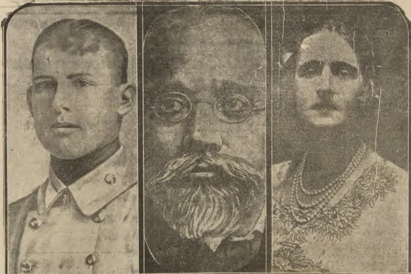
GRECIA.—El hijo mayor del ex Rey Constantino, antiguo heredero del Trono; Venizelos, el «salvador de Grecia», derrotado en las últimas elecciones, y la princesa Elisabett de Rumania, prometida del Príncipe heredero, cuya anunciada alianza matrimonial ha influido mucho en los últimos acontecimientos políticos, por la actitud de Rumania.