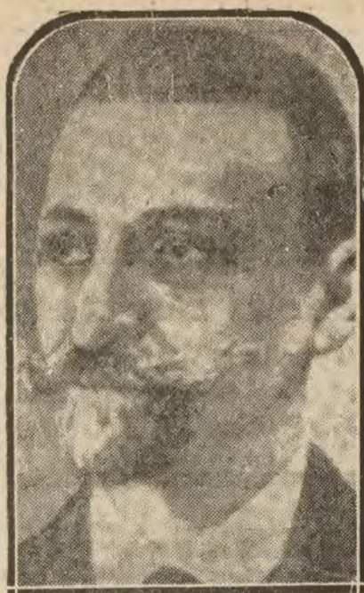
GRECIA.—M. Rhaulis, presidente del Gobierno que sucede a Venizelos.