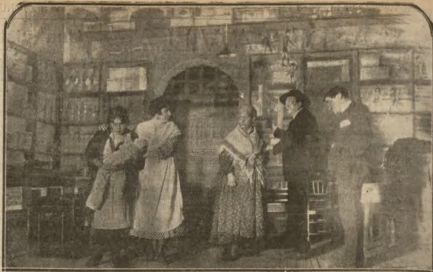
MADRID.—Una escena de «La Novellera», zarzuela de Parado y Jiménez, estrenada en el Teatro Cervantes

ALFONSO FOTOGRAFO TELÉFONO 2509 FUENCARRAL 6, MADRID