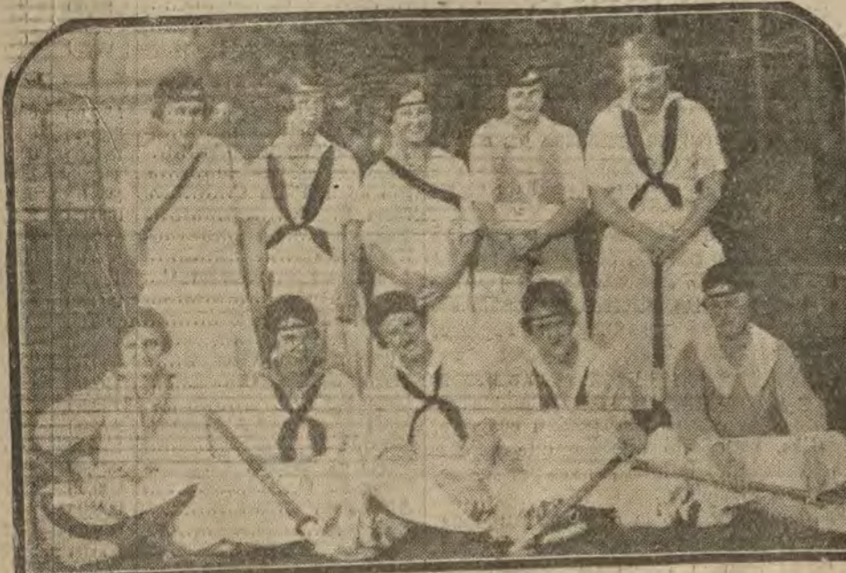
FILADELFA.—La mujer americana y el sport. El equipo de polo que ha obtenido el campeonato femenino norteamericano

EL ANUNCIO MAS PRODUCTIVO ES EL DE LA VALLA ANUNCIADORA de las calles ALCALA y SEVILLA Palacio en construcción del BANCO DE BILBAO Más de 200.000 personas lo leen diariamente Concesionario: P. MARTINEZOROZCO Plaza de Canalejas 6, primero