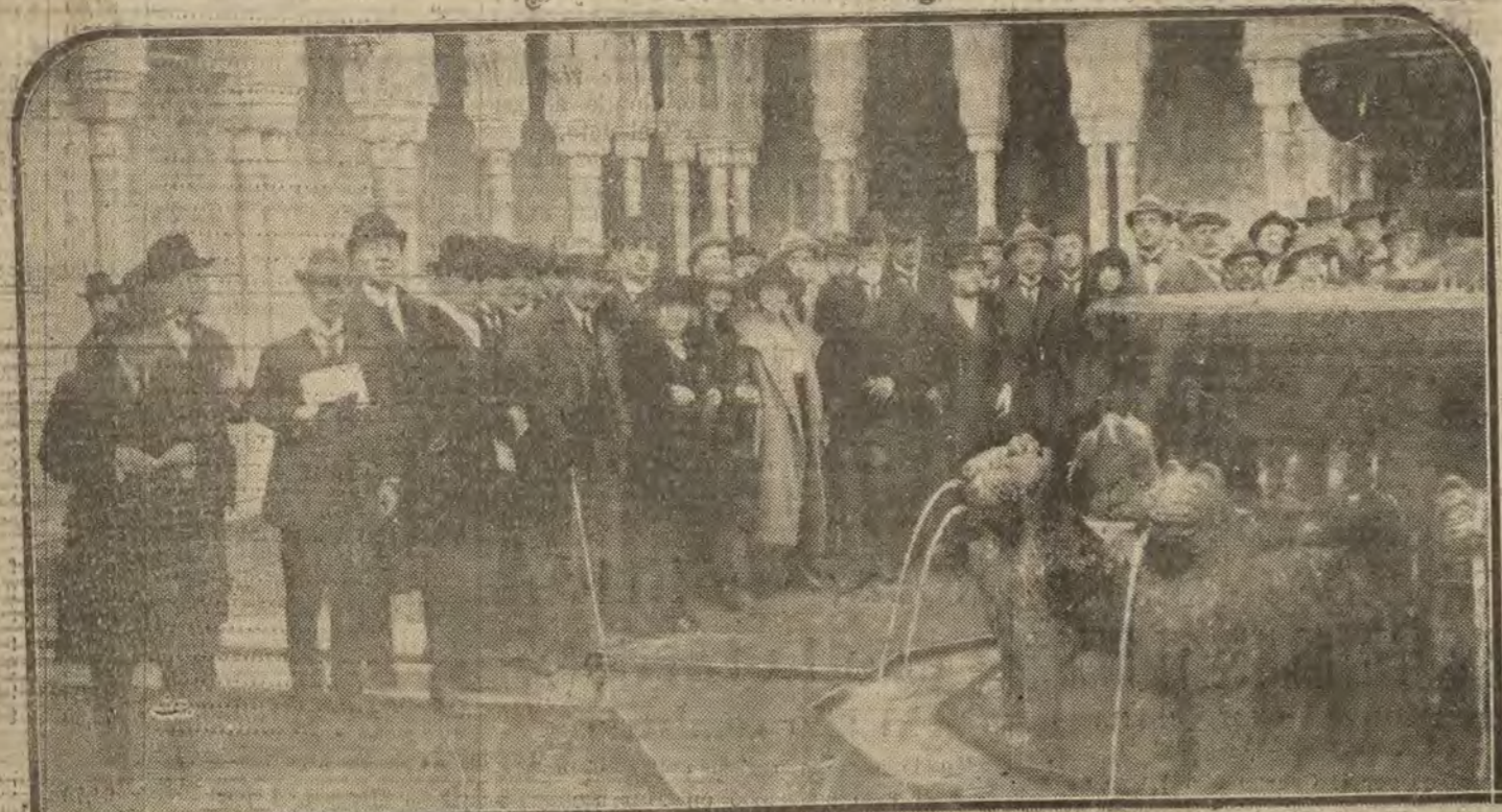
GRANADA.—Delegados extranjeros, durante su visita a la Alhambra