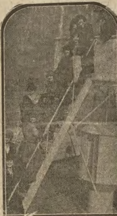
NUEVA YORK.—La Pavlova (x) con su compañía de bailes rusos a bordo del «Adriatico», donde se dirige a Norteamérica