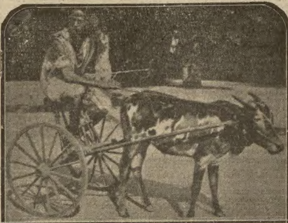
INDIA.—Carro serie 1920. Uno de los vehículos utilizados aún por los habitantes de la India inglesa.