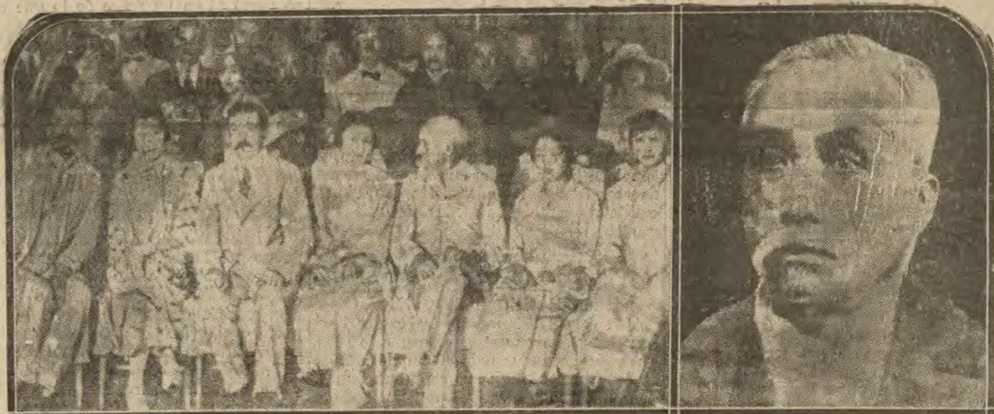
CHINA.—Festival literario en honor de los embajadores extranjeros celebrado en Shanghai.—A la derecha, el presidente de la República China, Hsu Cseu Tchang