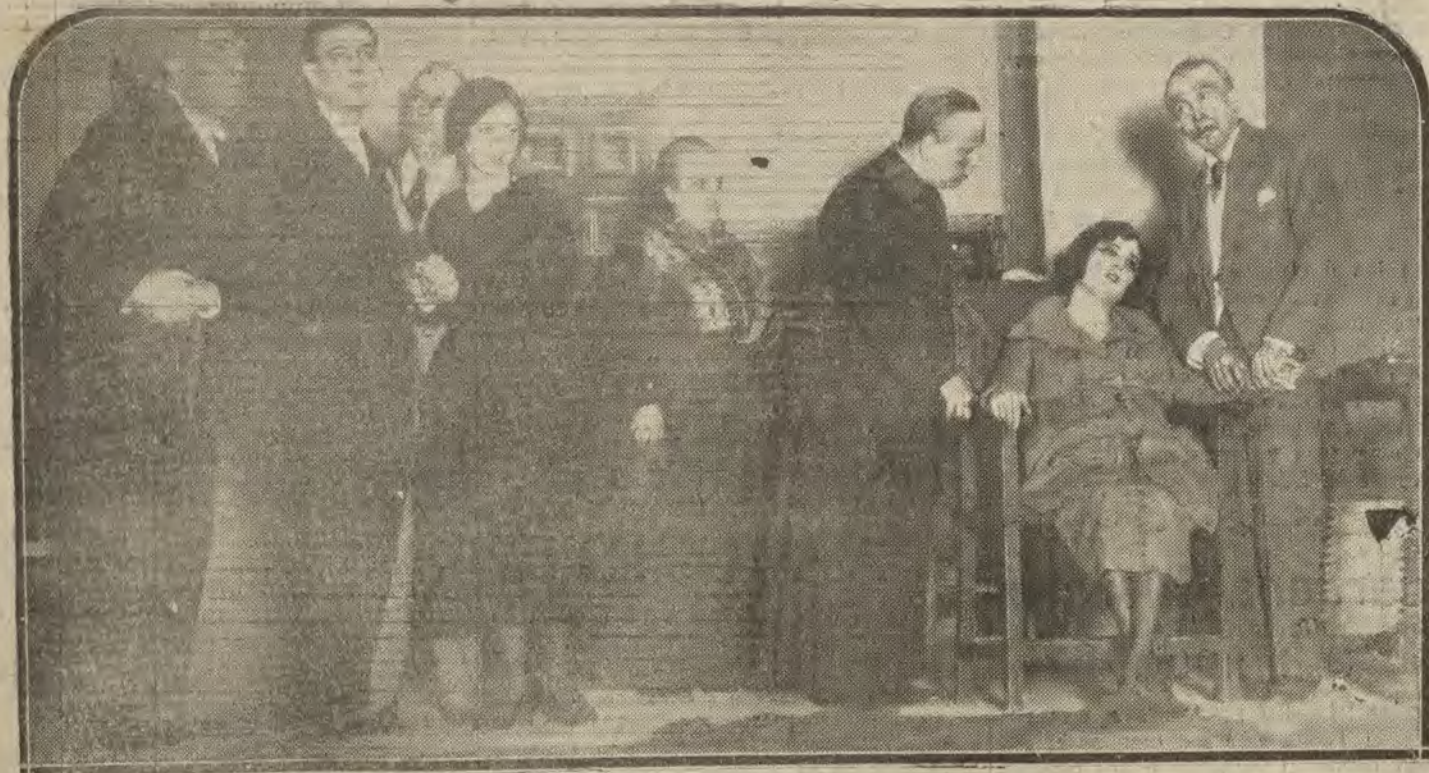
MADRID.—Una escena de «La princesita rusa», drama estrenado ayer con gran éxito en el Coliseo Imperial.