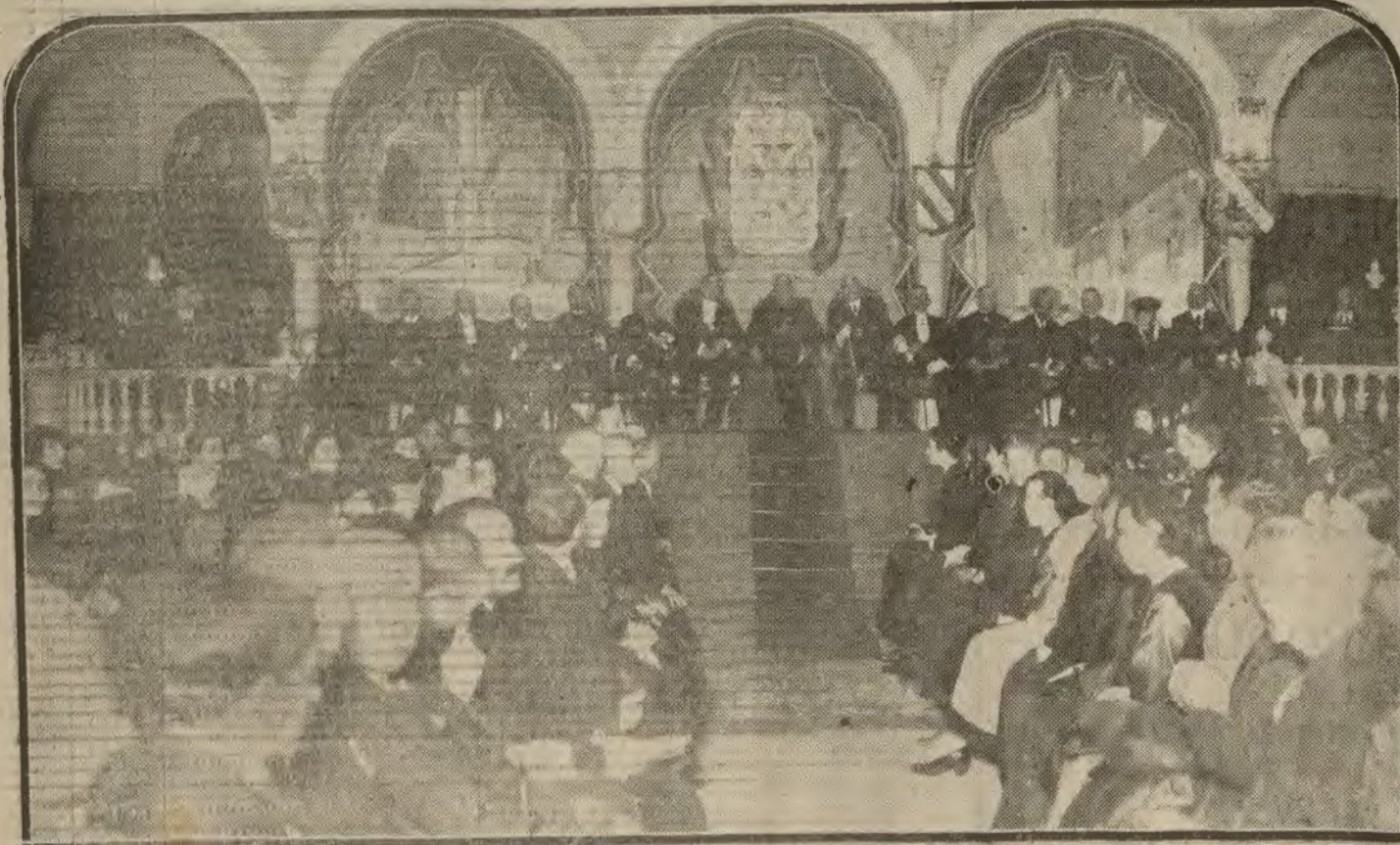
SEVILLA.—Presidencia del Certamen literario celebrado por la Real Asociación de San Casiano.