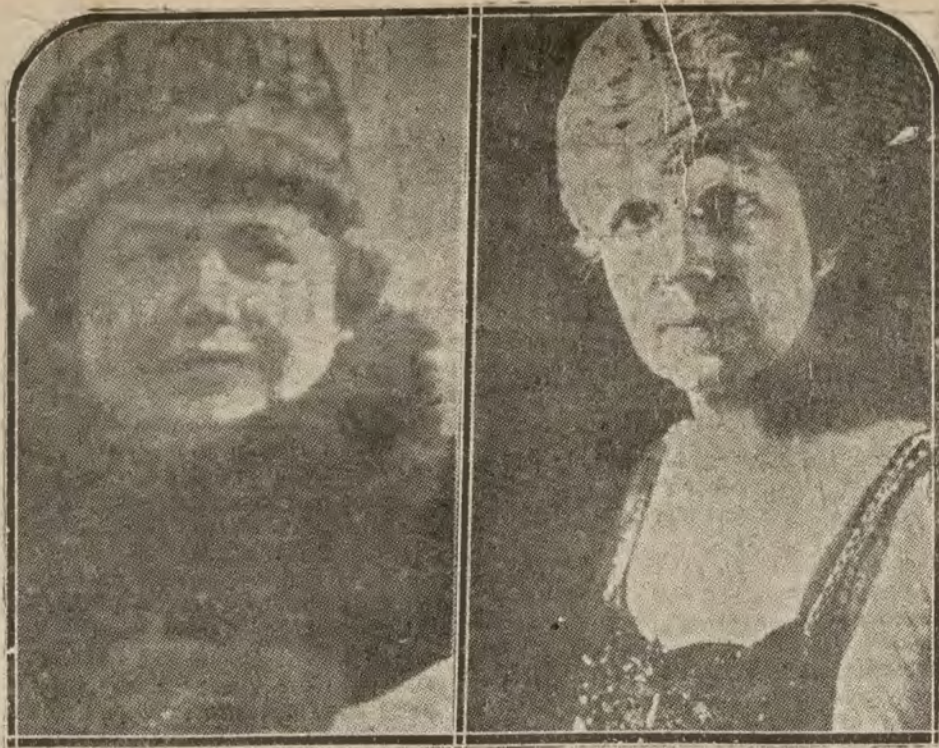
ESTADOS UNIDOS.—Las dos presidentas americanas. Mrs. Wilson que se va: Mrs. Harding, lo que viene.