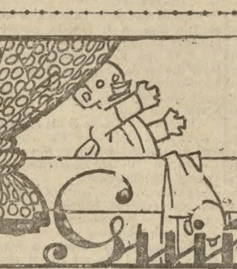
CRISTOBITA.—De manera que no le suben el sueldo a los funcionarios. CURRILLO.—Hombre, no les van a subir todo; ya les han subido el precio de las subsistencias.