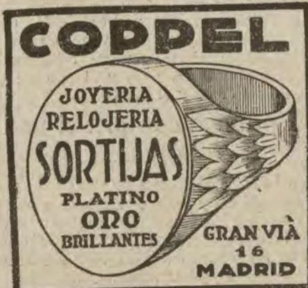
El impermeable más práctico. Es la gabardina última inglesa que vende la camisería SANCHE, HORTALEZA, 9.