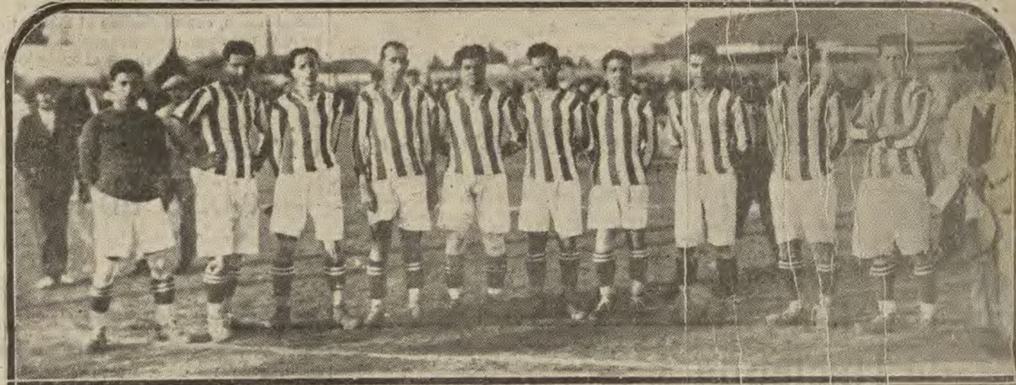
SEVILLA.—El «Real Betis», que ha vencido por tres goals a uno al «Sevilla F. C.».

TELEFONOS APARATOS ACCESORIOS AYALA, núm. 63, fábrica. Teléfono 11-62 S