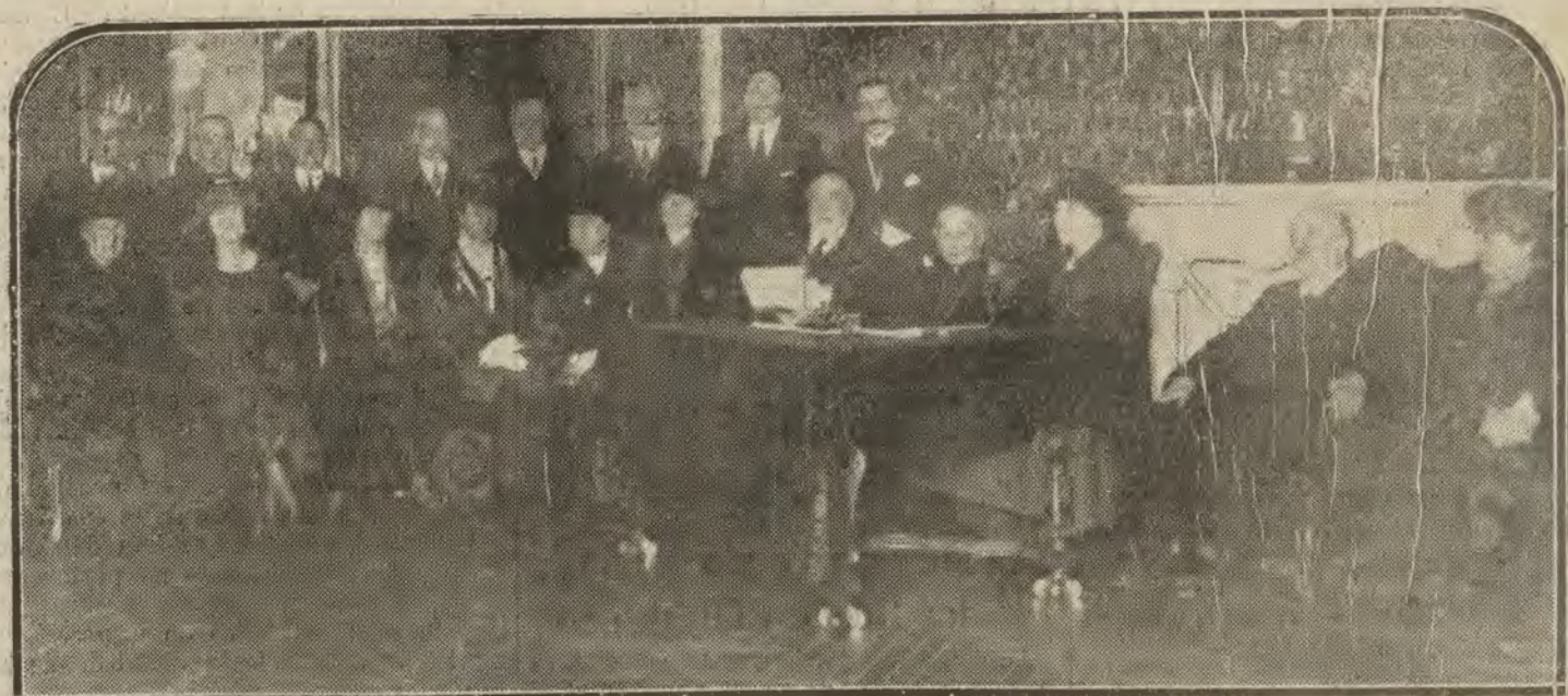
MADRID.—La junta organizadora del «Aguinaldo del soldado en Marruecos», constituida ayer en el ministerio de la Guerra.