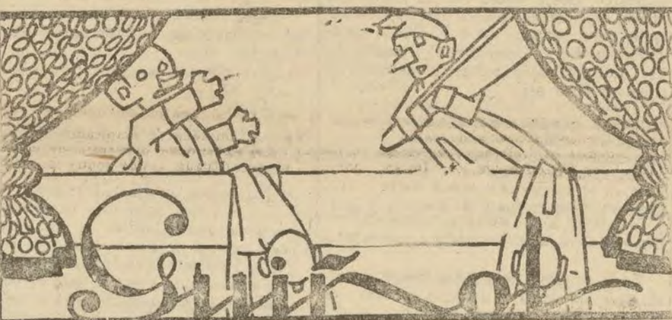
CRISTOBITA.—¿De modo, Currillo, que no hay pan? CURRILLO.—¡N autoridades!

Los nuevos esposos han salido para Francia.