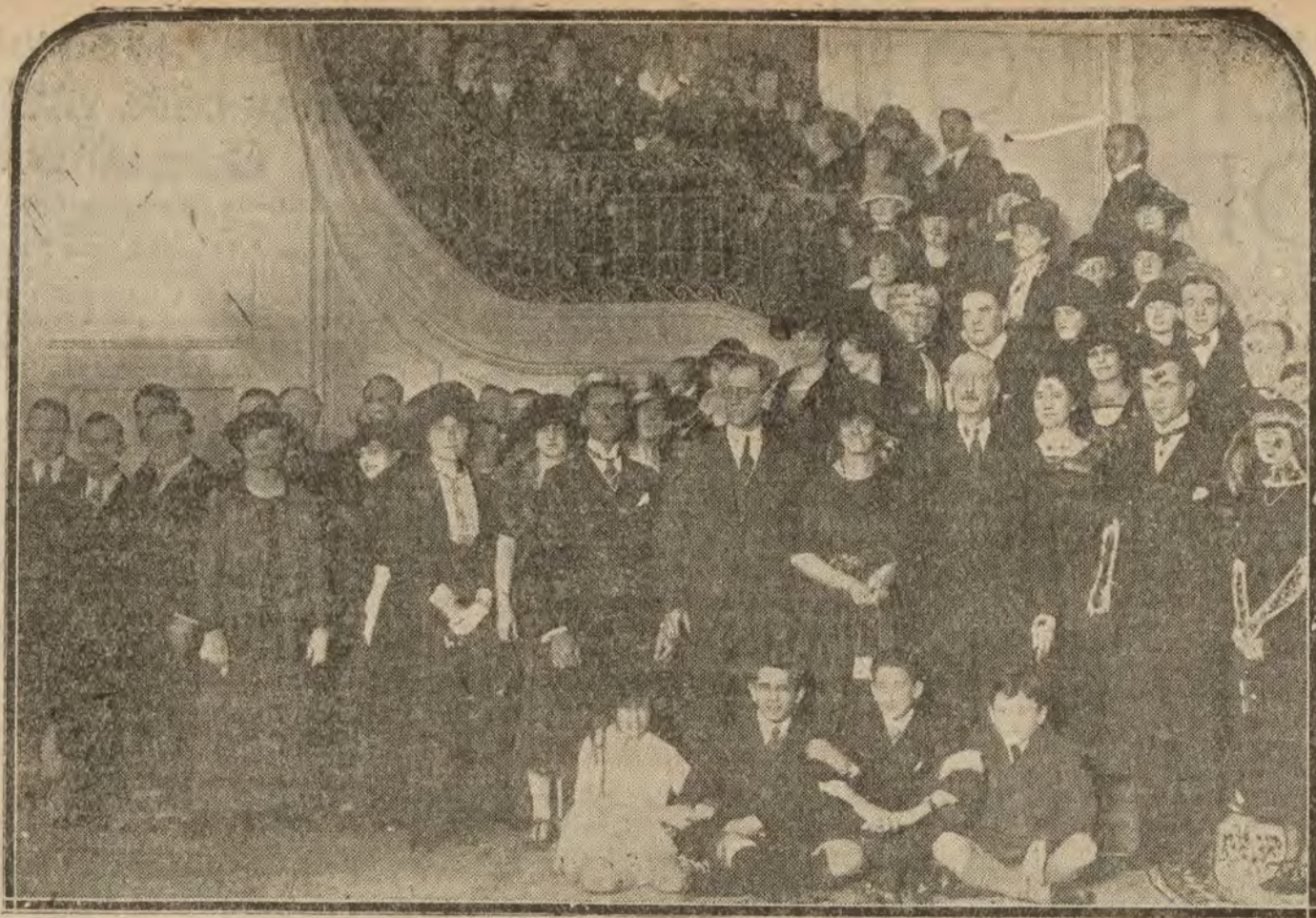
MADRID.—El embajador de los Estados Unidos, Mr. Willard y su esposa, con los invitados al té servido ayer noche con motivo del «Thanksgiving Day» en la Embajada norteamericana