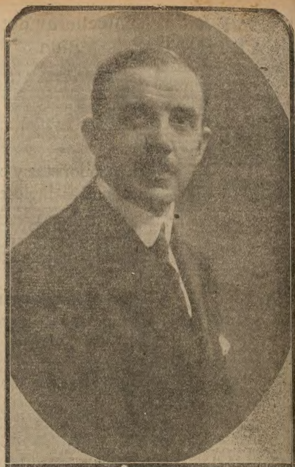
MADRID.—El director general de Comunicaciones señor conde de Colom