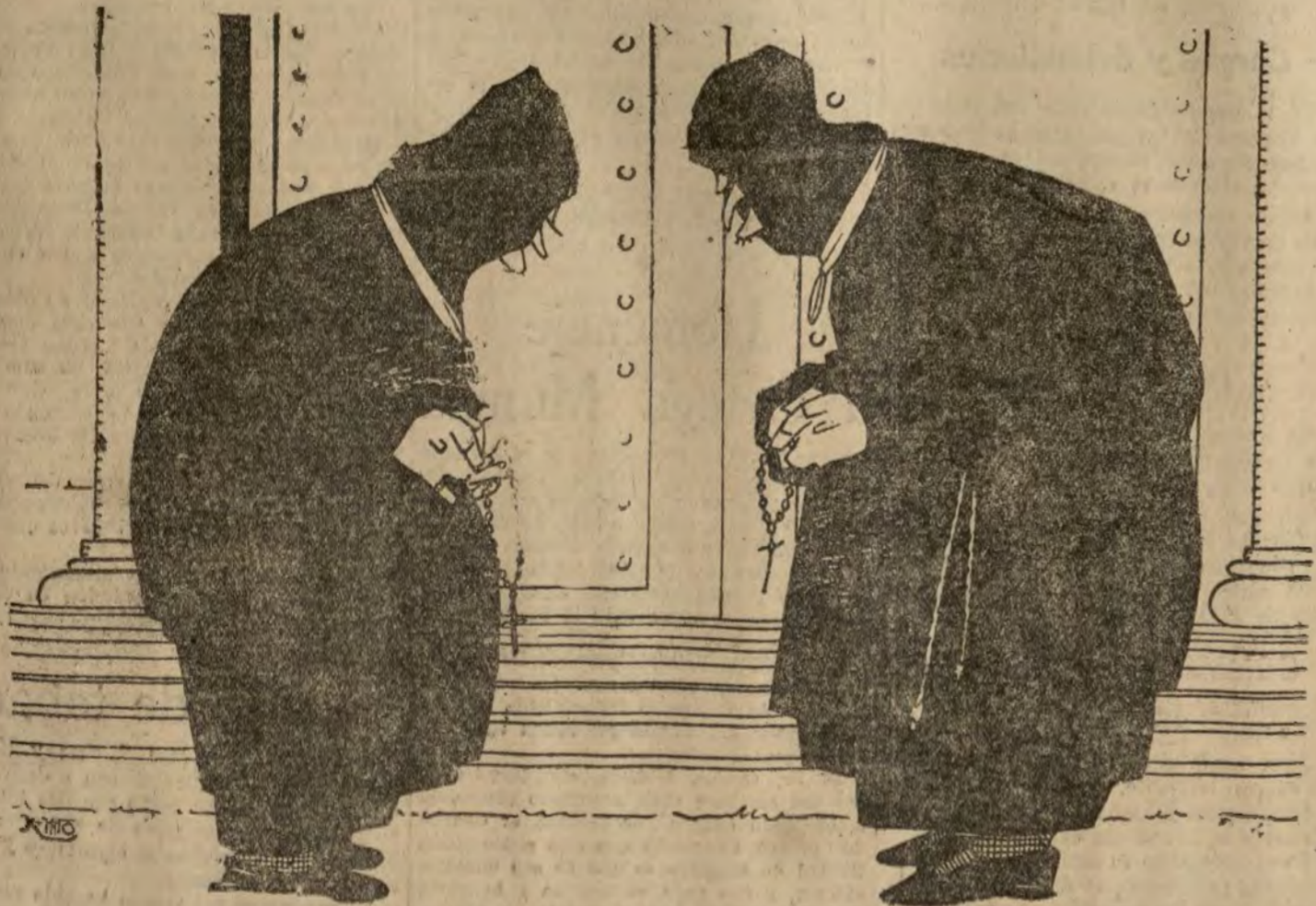
CON PERDON SEA DICHO