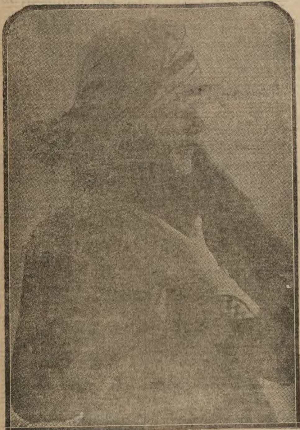
PARIS.—Las modas de invierno. Sombreros de fieltro recortado y guantes con manopla «teñero de damas».