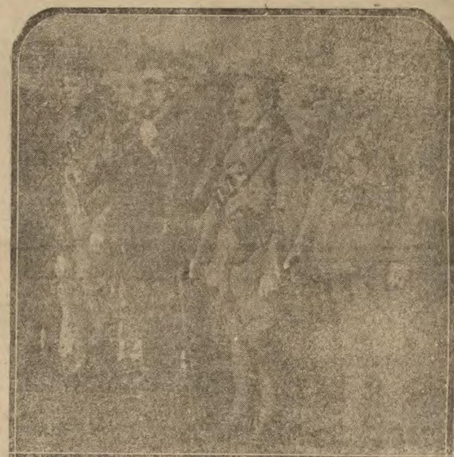
IRLANDA.—Alistamiento e instrucción de los voluntarios para sofocar el movimiento de rebeldía en Irlanda