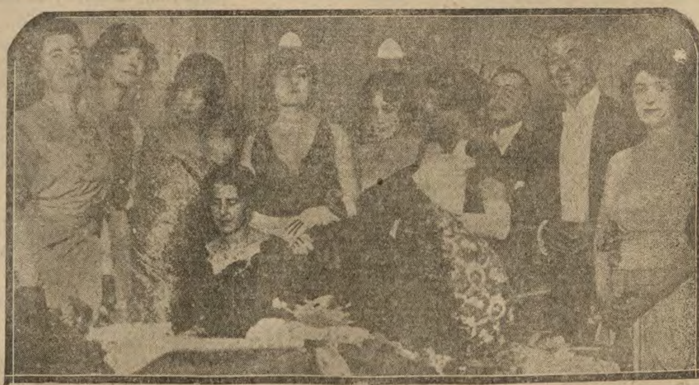
INGLATERRA.— El club de los bailarines de Londres. Curiosa institución destinada al cultivo y perfeccionamiento de las danzas