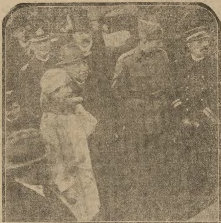
BRASIL.— Los Reyes de Bélgica, en el Brasil. El príncipe Leopoldo (x) presenciando el concurso de aeronaves