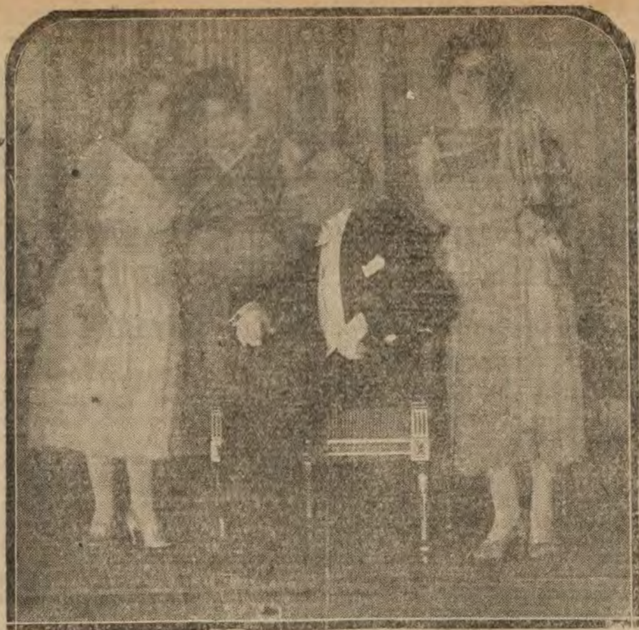
MADRID.—Una escena de «La feria de los maridos», comedia estrenada anoche en el teatro Lara